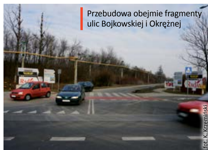
Przebudowa obejmie fragmenty ulic Bojkowskiej i Okrężnej

■ Południowa obwodnica miejska łącząca ulice Rybnicką i Pszczyńską ma się ciągnąć na długości blisko 4 km. Odcinek od ul. Rybnickiej do Bojkowskiej (2,1 km) wytyczono po południowej stronie ogrodów działkowych przy ul. Rybnickiej i po południowej stronie lotniska aeroklubu do skrzyżowania