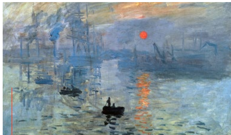
„Impresja, wschód słońca”, Claude Monet (1872 rok)

Projekcję filmu w reżyserii Phila Grabsky'ego zaplanowano w kinie Amok (ul. Dolnych Wałów 3) dwukrotnie, 26 lutego i 5 marca, o godz. 18.15. (mm)