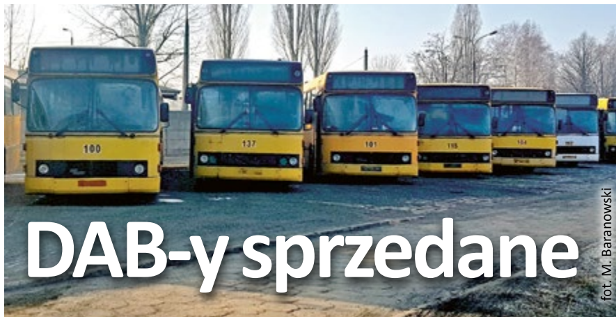
fol. M. Baranowski