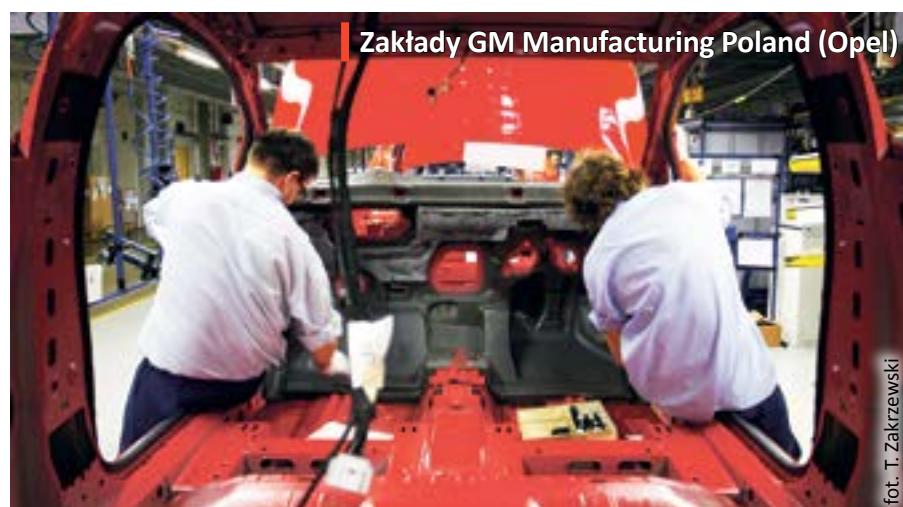
Zakłady GM Manufacturing Poland (Opel)

W raporcie Financial Times (magazyn fDi – Global Free Zones of the Future 2012/2013) KSSE została uznana za 2. w Europie i 11. na świecie najlepszą strefę ekonomiczną.