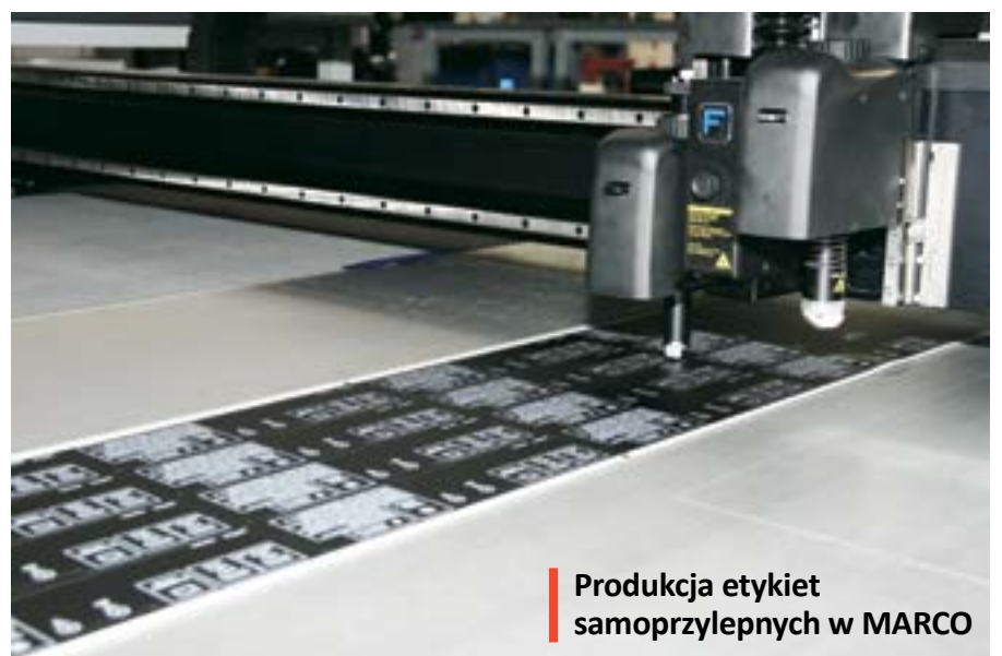
Produkcja etykiet samoprzylepnych w MARCO

W całej gliwickiej strefie ekonomicznej działa aktualnie 81 firm oraz 7 deweloperów. W Gliwicach – 64 firmy i 6 deweloperów. Dotychczas wyasygnowały one 8,9 mld zł na budowę fabryk, magazynów i obiektów infrastrukturalnych. Kwota ta tylko w naszym mieście wyniosła 7,6 mld zł.