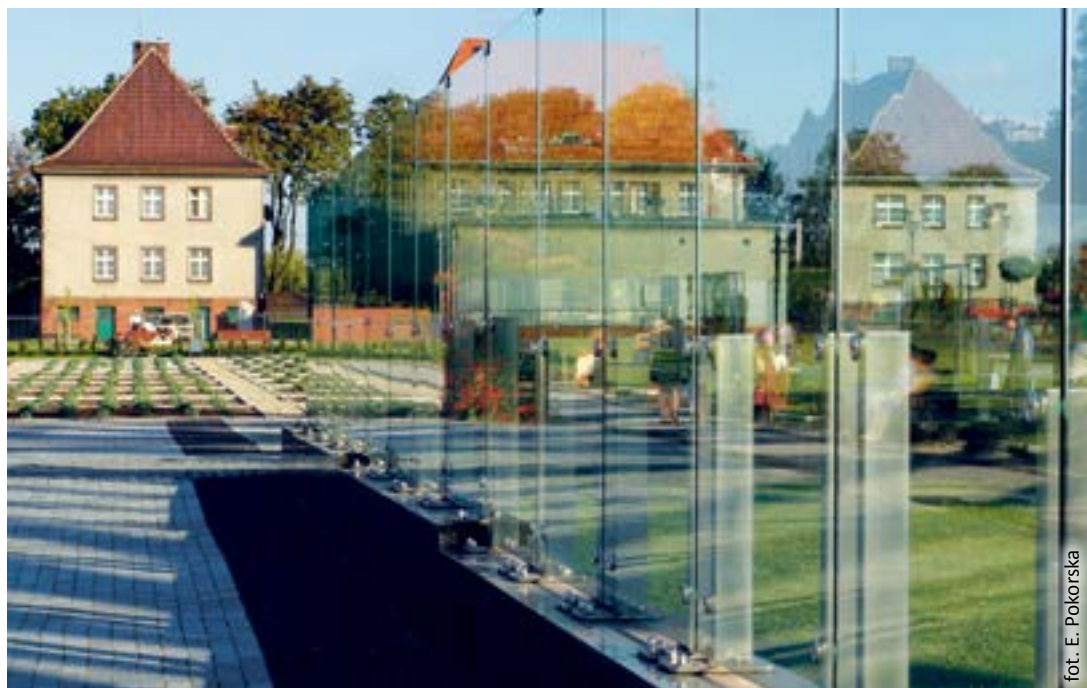
fol. E. Pokorska

Jeden z budynków zespołu przy ul. Tarnogórskiej, usytuowany na wprost wieży, to obiekt techniczny. Tam mieściła się obsługa przedwojennej radiostacji. Dwa pozostałe budynki to dawne domy mieszkalne, których rozplanowanie, architektura, kolorystyka, materiały wykończeniowe zachowały się w znaczącym stopniu i w zasa-