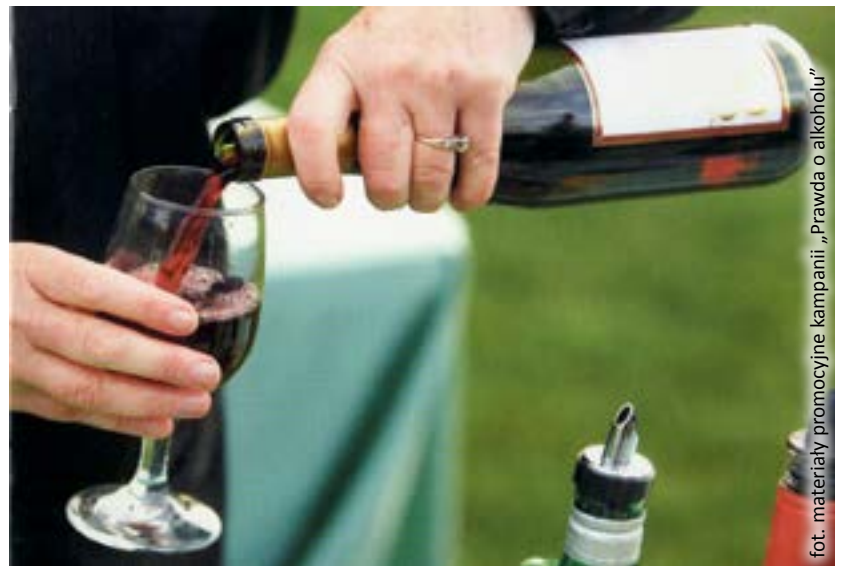
fol. materiały promocyjne kampanii „Prawda o alkoholu”

ul. Okopowa 6 44-100 Gliwice poniedziałki i środy od godz. 16.15 do 17.30