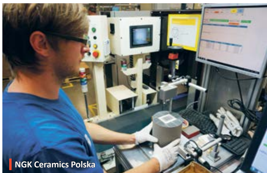
NGK Ceramics Polska