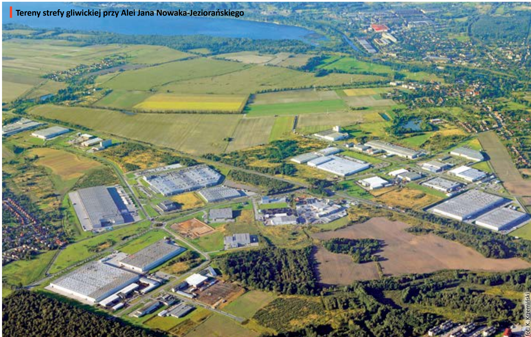
Tereny strefy gliwickiej przy Alei Jana Nowaka-Jeziorańskiego

Według raportu Instytutu Badań nad Gospodarką Rynkową „Atrakcyjność inwestycyjna województw i podregionów Polski 2013” województwo śląskie jest najbardziej atrakcyjnym inwestycyjnie regionem naszego kraju.