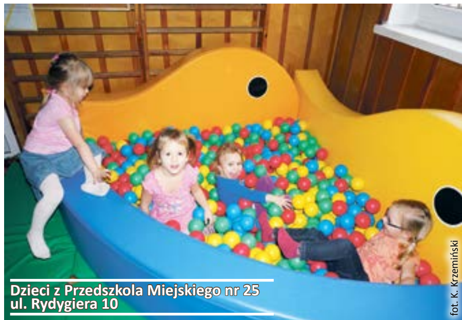
Dzieci z Przedszkola Miejskiego nr 25 ul. Rydygiera 10

– Miasto Gliwice, przygotowując dla dzieci miejsca w przedszkolach i oddziałach przedszkolnych zlokalizowanych w szkołach podstawowych, musi uzależnić ich liczbę od liczby dzieci, które w tym roku szkolnym rozpoczną naukę w klasie pierwszej szkoły podstawowej. Mówimy tu o 6-latkach z pierwszej połowy rocznika 2008 i z rocznika 2007 – usłyszeliśmy w delegaturze Kuratorium Oświaty w Gliwicach. – Jednak to, ile miejsc zwolni się ostatecznie w przedszkolach, zależy od decyzji rodziców 6-latków z drugiej połowy rocznika 2008. Mogą one bowiem