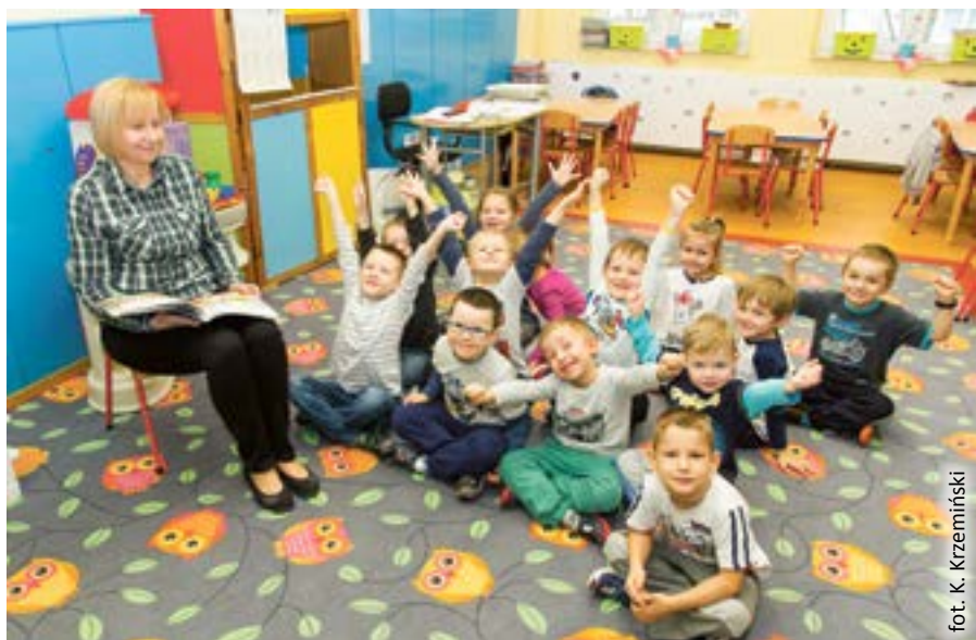
fot. K. Krzeмиński