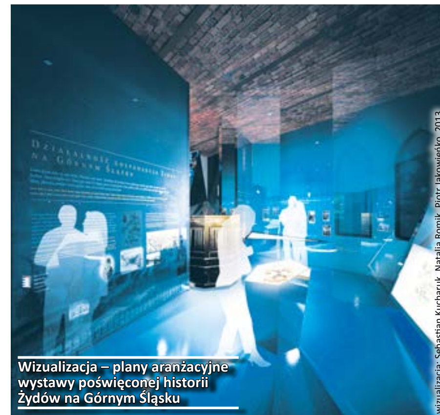
Wizualizacja – plany aranżacyjne wystawy poświęconej historii Żydów na Górnym Śląsku

przywróci mu dawny blask. Już wiadomo, że powstanie tam oddział Muzeum w Gliwicach, który będzie poświęcony historii Żydów na Górnym Śląsku. Koszty tej inwestycji są szacowane na mniej więcej 4 mln złotych. Plany są imponujące. W pierwszej kolejności prowadzone będą prace budowlane. Potem wyjątkowo cenna historycznie i architektonicznie przestrzeń zostanie zagospodarowana przez muzealników. Muzeum Żydów na