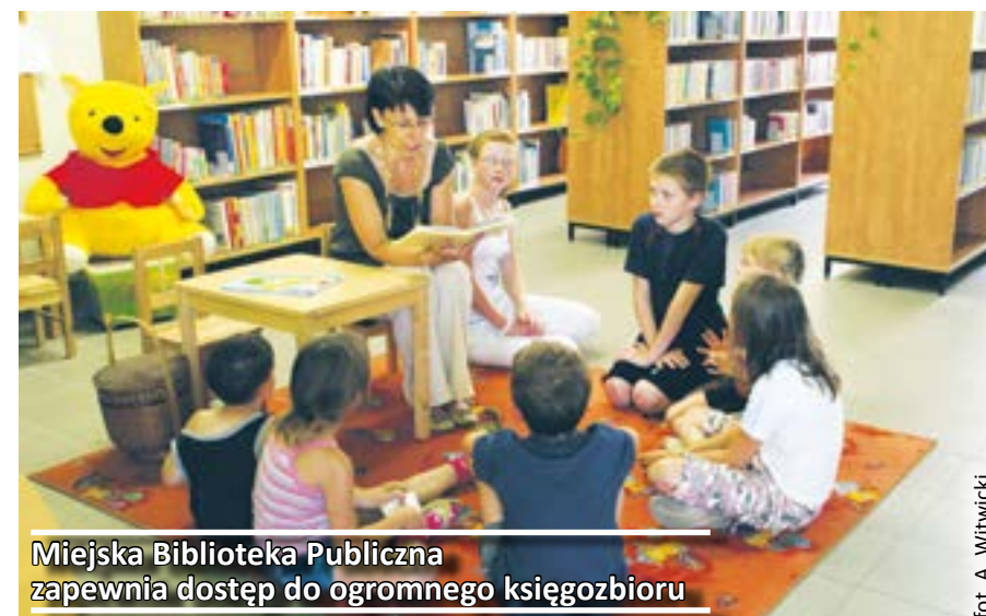
Miejska Biblioteka Publiczna zapewnia dostęp do ogromnego księgozbioru