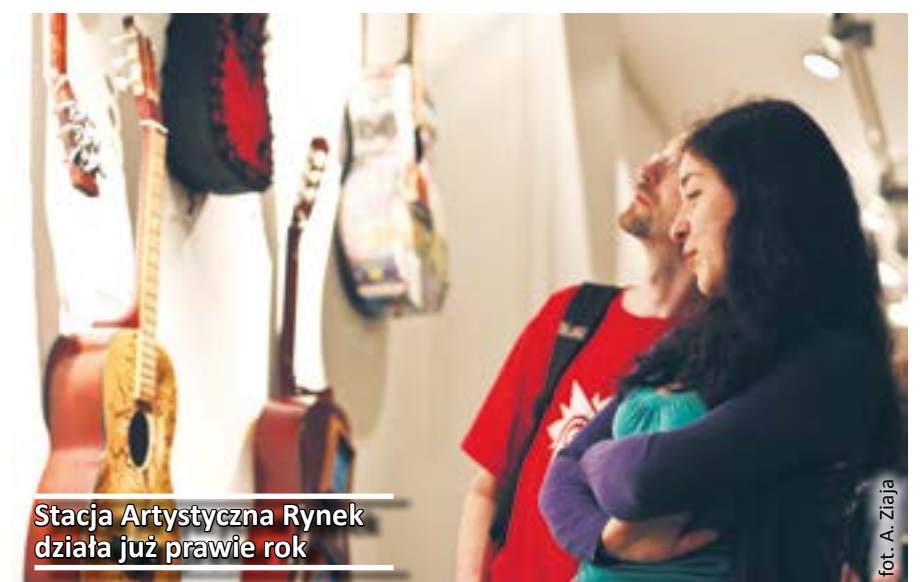
Stacja Artystyczna Rynek działa już prawie rok

Górnym Śląsku będzie miało charakter edukacyjno-muzealny.