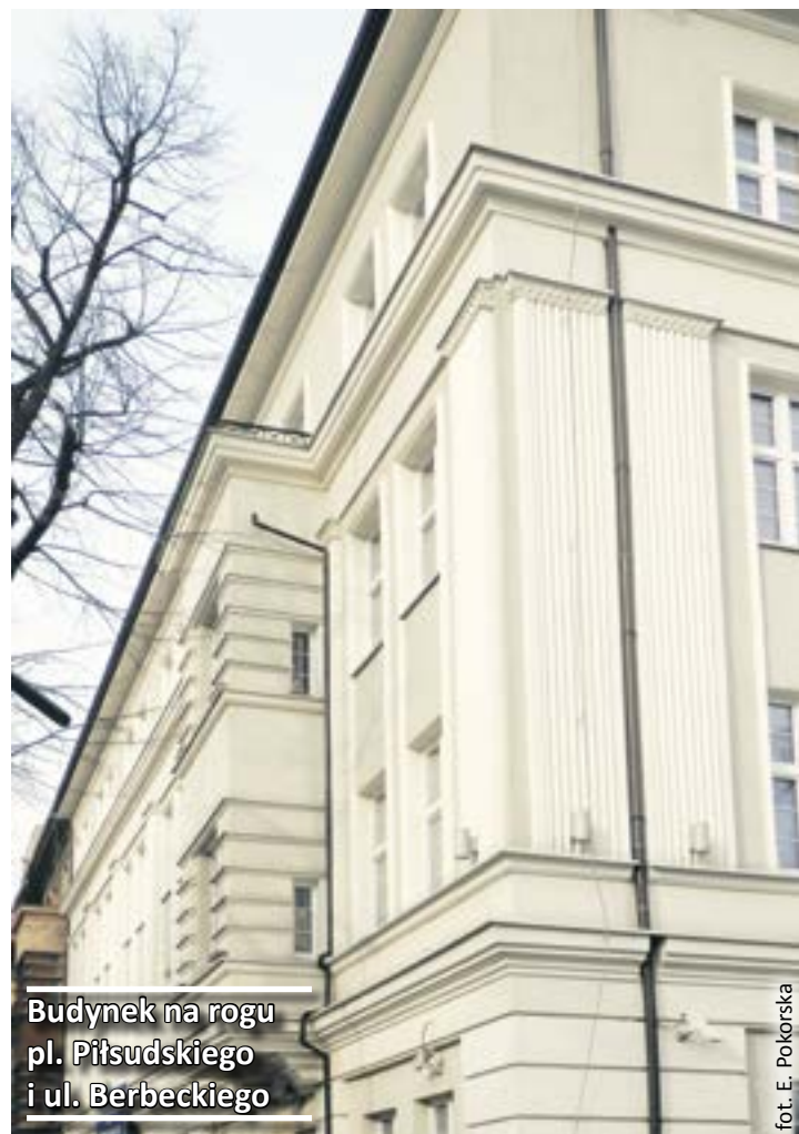
Budynek na rogu pl. Piłsudskiego i ul. Berbeckiego

W XIX wieku zaczęła obowiązywać konwencja haska nakładająca na walczące strony obowiązek ochrony dóbr kultury i sztuki, szczególnie świątyń. Z jej realizacją różnie bywało, ale to już inna kwestia. A dziś? Wpisy do wojewódzkiego rejestru zabytków, które umożliwiają m.in. ubieganie się o dotacje, zależą głównie od