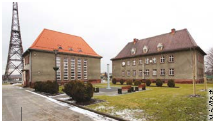
Budynek do wydzierżawienia – po prawej.

Maszt jest widoczny z daleka, ładnie oświetlony i estetycznie wyeksponowany. Teren wokół niego został gruntownie odnowiony – urządzono tu bezpieczne miejsce do wypoczynku z zielenią, ozdobnymi minibusami i ławkami. Cyklicznie organizowane są tu imprezy kulturalne i sportowe. Na sąsiedniej, 3-hektarowej działce miasto planuje