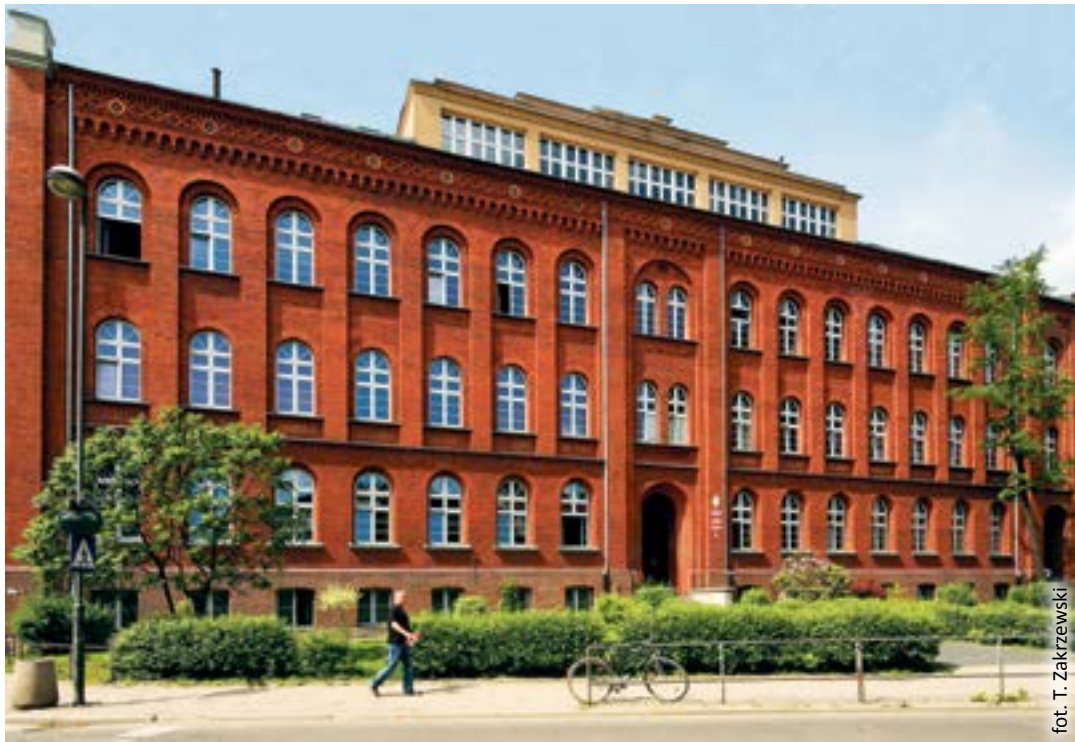
fol. T. Zakrzewski