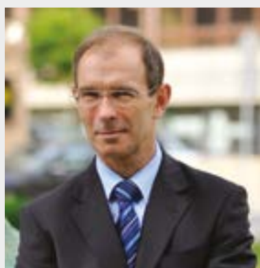
Prezydent Gliwic Zygmunt Frankiewicz:

Projekt NOWE GLIWICE II ma wiele zalet. Dzięki niemu chcemy stworzyć dobre miejsce pod przyszłe inwestycje. Jeśli uda się zrealizować te ambitne plany, to wszyscy zyskamy bardzo atrakcyjną, tętniącą życiem przestrzeń – nowoczesną i funkcjonalną, ale nawiązującą także do poprzemysłowego charakteru, z którego znane są gliwiczanom tereny zlokalizowane w pobliżu Fabryki Drutu. W założeniach ma być to miejsce, w którym będzie można miło spędzić wolny czas. Mam nadzieję, że NOWE GLIWICE II, gdy już powstaną, dostarczą nam nie tylko odpowiednio wysokich wrażeń estetycznych, ale też pręźnie działających firm z branży nowoczesnych technologii, której eksplozji w Gliwicach od pewnego czasu nie sposób nie zauważyć.