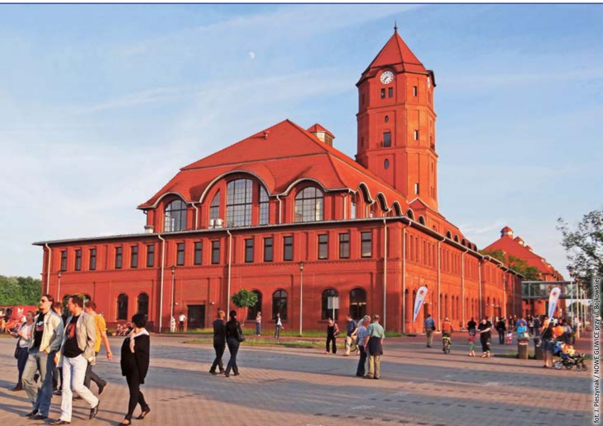
NOWE GLIWICE przy ul. Bojkowskiej