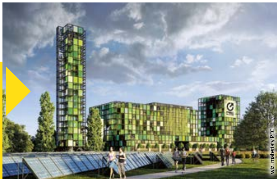
wiz. materiały PEC

Park Zielonej Energii to ekologiczna i nowoczesna inwestycja PEC-Gliwice, która będzie stanowić konieczny element systemu gospodarowania odpadami w mieście. Wielopaliwowy blok ciepłowniczy będzie współpracował z wieloformatową farmą solarną i magazynem ciepła. Teren Parku ma się stać wizytówką Gliwic i będzie całkowicie dostępny dla mieszkańców, na wieży planowany jest taras widokowy. Rozpoczęcie budowy Parku Zielonej Energii planowane jest na 2023 r. Instalacja powinna zostać oddana do użytku pod koniec 2026 r. lub na początku 2027 r. Pakiet informacji na temat inwestycji jest dostępny na stronie internetowej Parkzielonejenergii.pl .