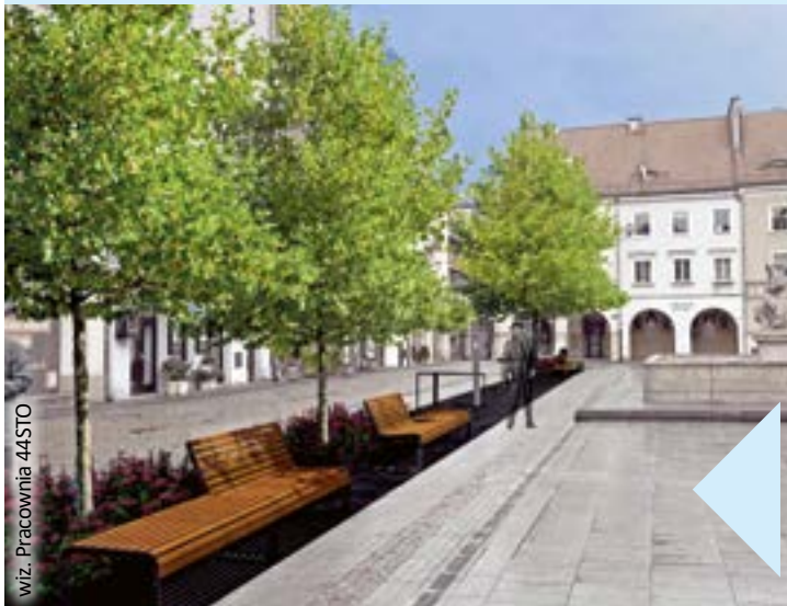
wiz. Pracownia 44STO

Gliwicki Rynek wypięknije. Zaplanowano więcej zieleni, w tym 11 większych drzew, pojawią się estetyczne elementy małej architektury, nowe ławki i stojaki na rowery. Projekt modernizacji zyskał już akceptację Wojewódzkiego Konserwatora Zabytków. Wykonała go gliwicka pracownia 44STO. Inwestycję zrealizuje Zarząd Dróg Miejskich.