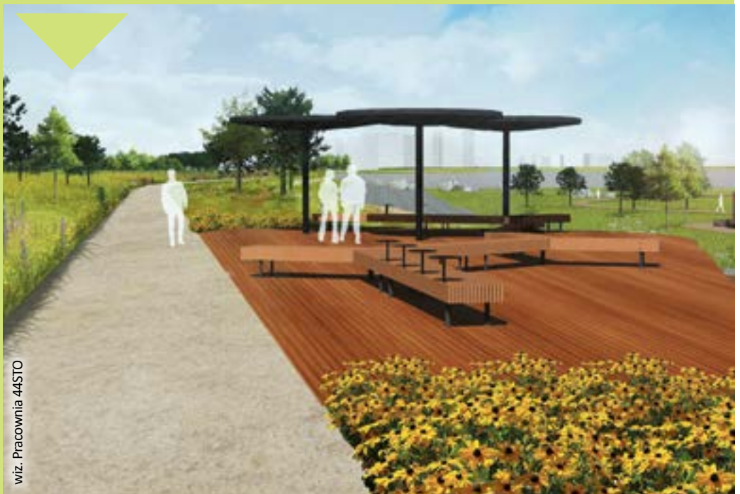
wiz. Pracownia 44STO