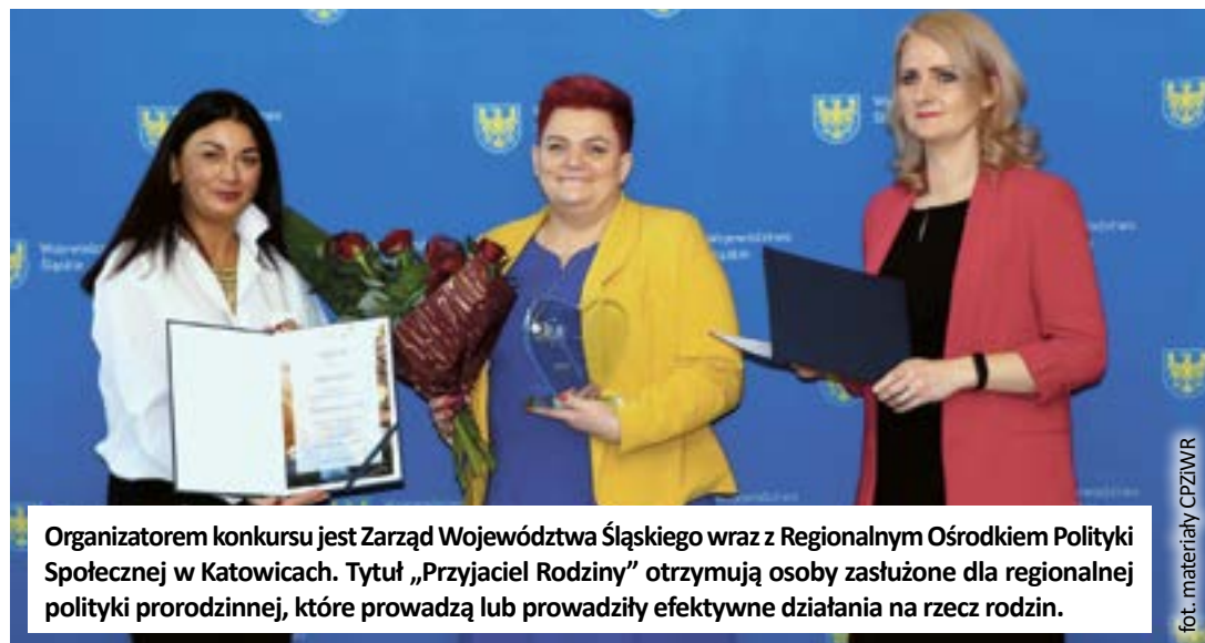
Organizatorem konkursu jest Zarząd Województwa Śląskiego wraz z Regionalnym Ośrodkiem Polityki Społecznej w Katowicach. Tytuł „Przyjaciel Rodziny” otrzymują osoby zasłużone dla regionalnej polityki prorodzinnej, które prowadzą lub prowadziły efektywne działania na rzecz rodzin.

Tworzenie Rodzinnych Domów Dziecka wpisuje się w Miejski Program Rozwoju Pieczy Zastępczej dla Miasta Gliwice na lata 2019–2021. Na rzecz Gliwic działa już kolejna tego typu forma pieczy zastępczej, w 2022 r. powstaną następne.