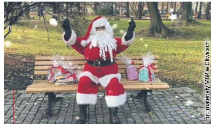
fol. materiały MBP w Gliwicach

Uwaga! Święty Mikołaj i jego Elfy przed Świętami mają pełne ręce roboty, dlatego na spotkanie w Gliwicach przygo-