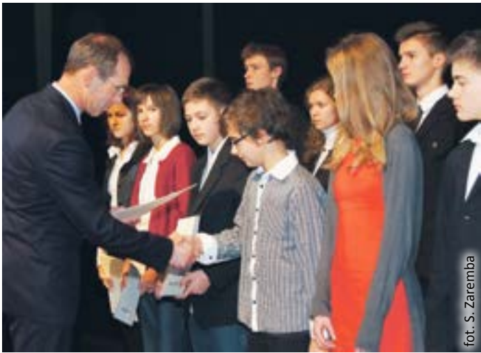
fol. S. Zaremba

Siódma edycja tej imprezy za nami. 29 listopada w Centrum Kultury Studenckiej MROWISKO prezydent miasta uhonorował 69 uczniów z 23 gliwickich szkół podstawowych, gimnazjalnych i ponadgimnazjalnych, którzy w minionym roku zostali laureatami olimpiad i konkursów przedmiotowych na szczeblu wojewódzkim, ogólnopolskim bądź międzynarodowym.