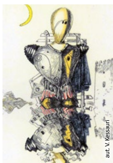
aut. V. Kessauri

„Metafizyczna tajemnica” Giorgia de Chirico i „Holocaust – podtrzymywanie pamięci” – Muzeum w Gliwicach przygotowało dwie ciekawe ekspozycje. Obie będzie można oglądać od piątku 24 stycznia.