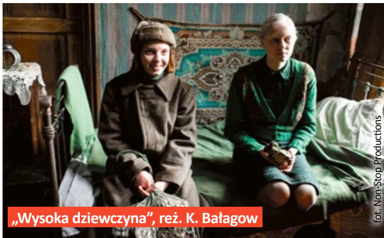
„Wysoka dziewczyna”, reż. K. Bałagow