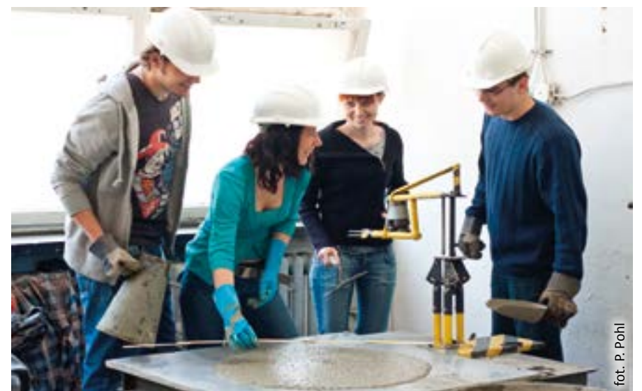
fol. P. Pohl