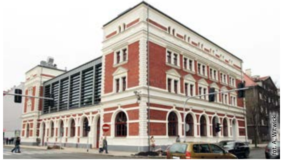
fol. A. Wrtwicki