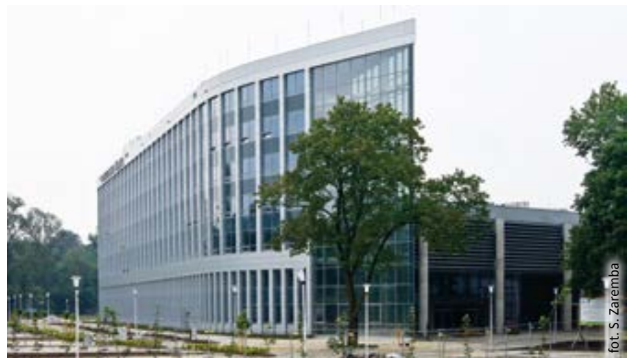
fol. S. Zaremba