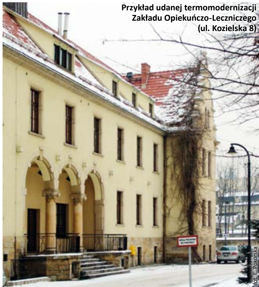
Przykład udanej termomodernizacji Zakładu Opiekuńczo-Leczniczego (ul. Kozielska 8)

Co jednak robić, gdy miejscowy plan zagospodarowania przestrzennego wy-