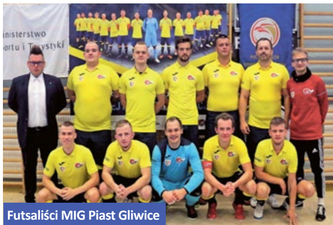
Futsaliści MIG Piast Gliwice