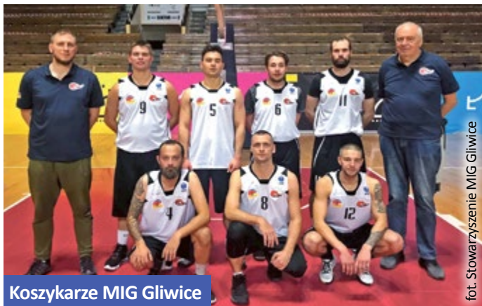
Koszykarze MIG Gliwice

Stowarzyszenie MIG Gliwice rozpruło worek z medalami na trzech imprezach odbywających się w miniony weekend w Łodzi Mistrzostwach Polski Niestyszających.