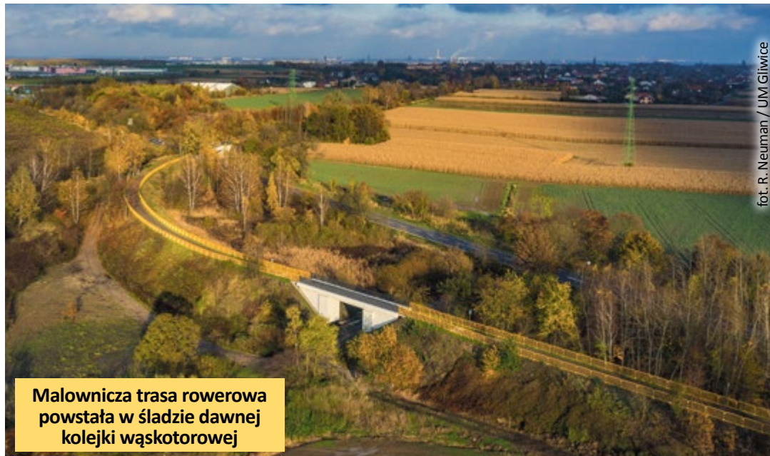
Malownicza trasa rowerowa powstała w śladzie dawnej kolejki wąskotorowej

Na tej trasie znajdują się odcinki wytyczone drogami asfaltowymi i szutrowymi (polnymi). Wydział Usług Komunalnych Urzędu Miasta w Gliwicach przygotowuje się do przeniesienia ich w ślad kolei wąskotorowej. W przyszłym roku zakończą się prace nad projektem przeniesienia 1,6 km odcinka trasy od ul. Łanowej do Knurowskiej.