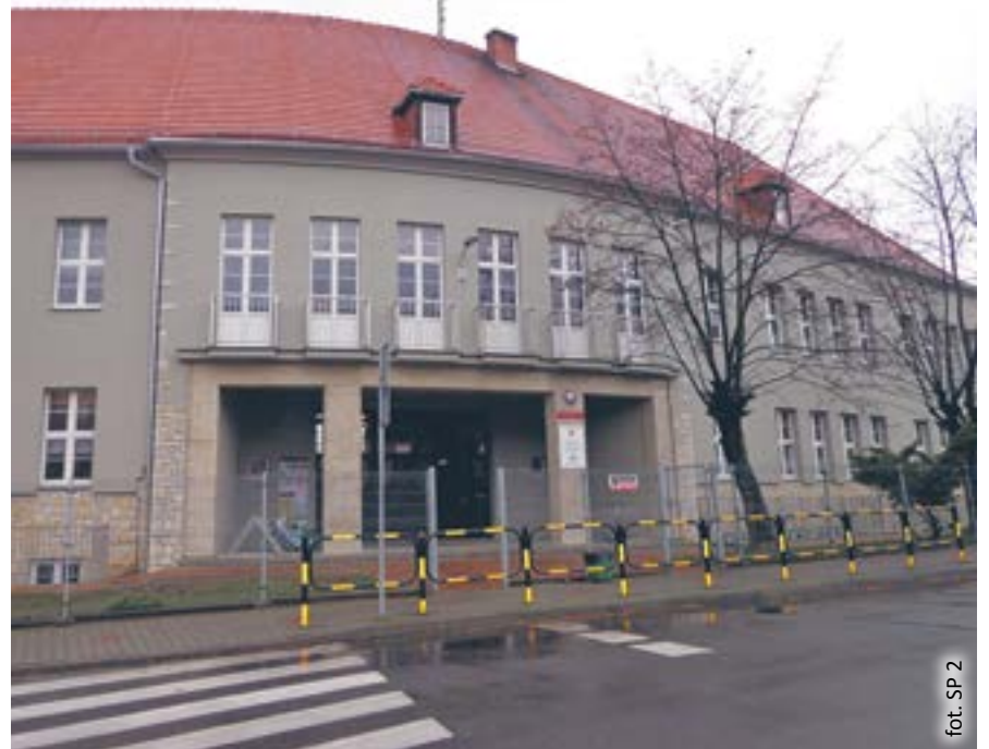
fol. SP 2

Mieszkańcy Wilczego Gardła mają powód do radości – zakończyła się modernizacja Szkoły Podstawowej nr 2 przy ul. Goździkowej. Remont przedwojennego budynku był prowadzony pod czujnym okiem konserwatora zabytków. Mieszkańcy zyskali nie tylko piękny obiekt – zmienił się też teren wokół szkoły.