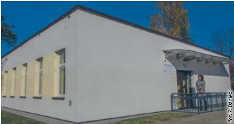
fol. Z. Daniec