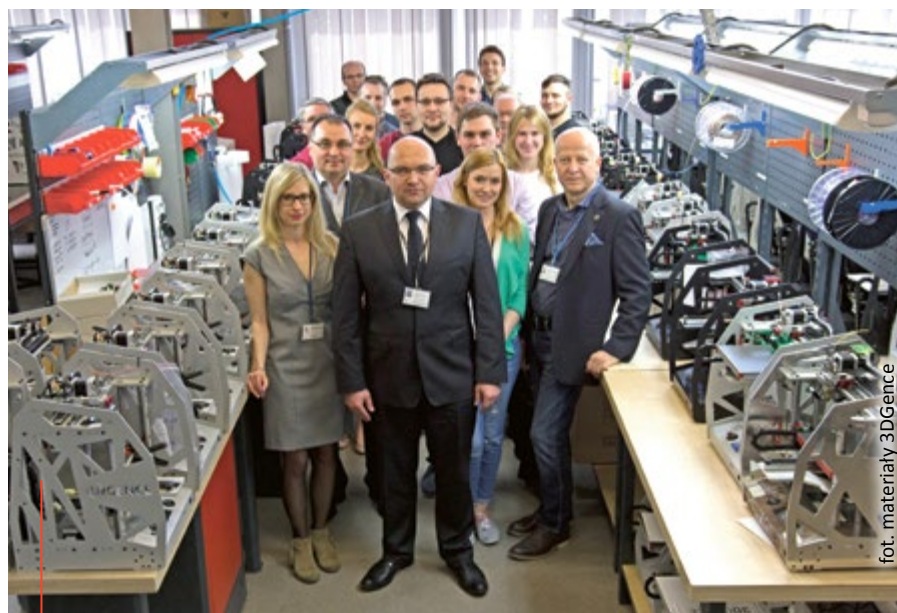
Zespół 3DGence w swojej siedzibie w gliwickim Technoparku