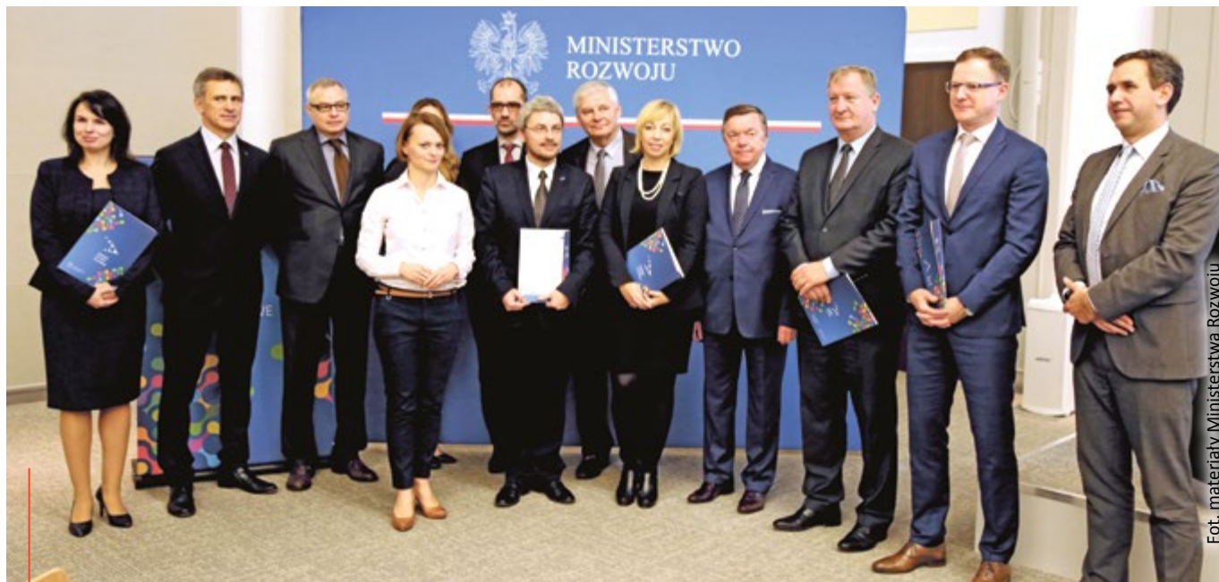
Fot. materiały Ministerstwa Rozwoju

Klaster MedSilesia – Śląska Sieć Wyrobów Medycznych powstał w 2007 r. Obecnie zrzesza ponad 70 podmiotów. Więcej o działaniach Klastra MedSilesia można znaleźć na stronie www.medsilesia.com . Przynależność do klastra jest bezpłatna. (mf)