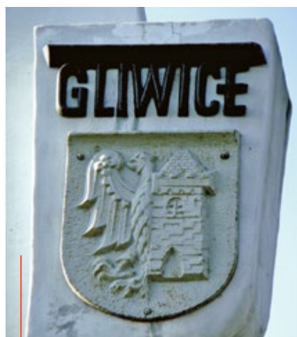
Stare witacze Miasto chce zastąpić nowymi, o bardziej współczesnej stylistyce

mięskich. „Ekspozytory o industrialnym designie służyć będą między innymi witanii wjeżdżających gości i zachęcaniu do odwiedzenia Miasta. Staną się dzięki temu inteligentnymi wizytówkami Miasta” – czytamy w uzasadnieniu do uchwały, którą podczas ostatniej sesji Rady Miasta przyjęli gliwiczanie. Obecnie trwają prace związane z przygotowaniem dokumentacji technicznej. Inwestycję zrealizuje Śląska Sieć Metropolitalna. (mf)