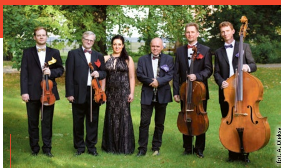
Zespół Eleganza zagrał swój premierowy koncert na Pożegnaniu Lata w parku Chopina

uwertur i tańców. Muzycy wykonają utwory zarówno znanych mistrzów (Johanna Straussa, Wolfganga Amadeusza Mozarta), jak i nieco zapomnianych kompozytorów (Vittoria Montiego, Juliusa Fućka). W programie są także utwory Imrego Kálmána i Ferencza Lehára, węgierskich twórców muzyki operetkowej. – Zaprezentujemy program pod tytułem „Wiedeński ogród muzyczny”, dający obraz klimatu muzycznego, który