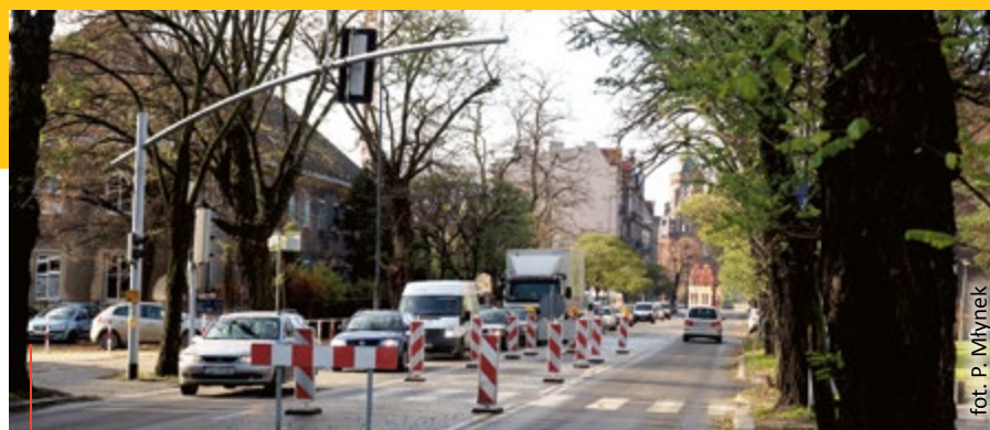
Kierowcy poruszający się ul. Konarskiego muszą liczyć się z utrudnieniami

Natomiast powodem zamknięcia fragmentu ul. Dolnych Wałów, między ul. Dworcową a ul. Zwycięstwa, było rozpoczęcie prac przy budowie przyłączy wodno-kanalizacyjnych i ciepłych w tym rejonie.