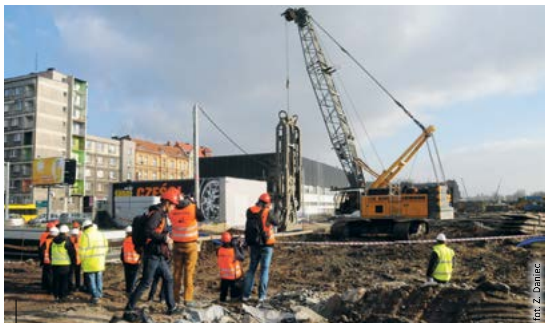
W śródmieściu natomiast ruszyła budowa prawie 500-metrowego tunelu. W sąsiedztwie ul. Dworcowej powstają ściany szczelinowe

nieczne, ale nie powinny paraliżować miasta – tak było np. z ul. Śliwki. Myślę, że te rozwiązania są dobrym kompromisem. W mieście da się żyć, co jest po części zasługą wprowadzonego niedawno inteligentnego systemu sterowania ruchem, a po części samych mieszkańców. Wykazują oni daleko idącą cierpliwość i tolerancję dla tego, co się dzieje. Wiedzą, że ta dro-