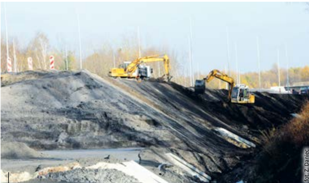
Na G1 ponad 50% nasypów pod przyszłą drogą jest już gotowych