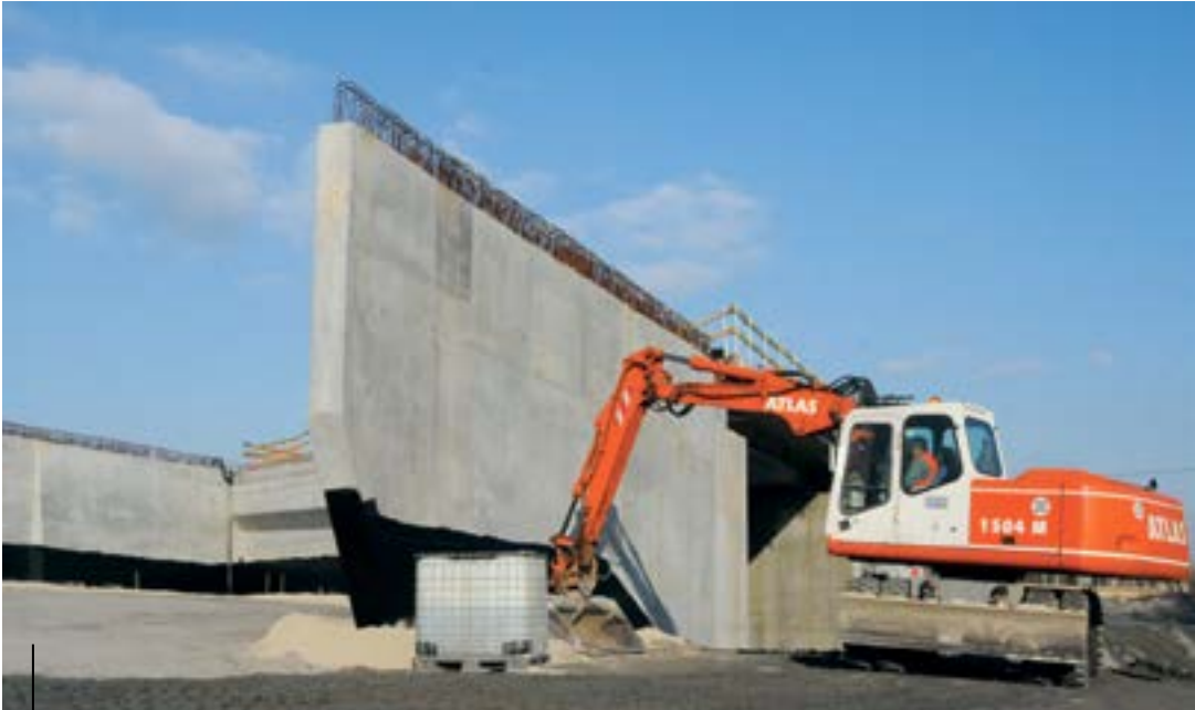
Na pierwszym odcinku DTŚ w Gliwicach widać już wiadukty nad torami kolejowymi, ulicami: Wschodnią, Błonie i Kujawską oraz nad autostradą A1

TO JUŻ PRAWIE 500 DNI BUDOWY DROGOWEJ TRASY ŚREDNICOWEJ W NASZYM MIEŚCIE. ROBOTY IDĄ PEŁNĄ PARĄ, A PIERWSZE EFEKTY JUŻ WIDAĆ. – 59% NA ODCINKU OZNACZONYM JAKO G1 O DŁUGOŚCI 2,8 KM OD GRANICY Z ZABRZEM DO ULICY KUJAWSKIEJ ORAZ 22% NA KOLEJNYM, MIERZĄCYM 5,6 KM FRAGMENTE (G2) DO WĘZŁA ŁĄCZĄCEGO ULICĘ PORTOWĄ Z DROGĄ KRAJOWĄ NR 88 – TO STAN ZAAWANSOWANIA BUDOWY GLIWICKIEGO ODCINKA DTŚ – RELACJONOWALI PRZEDSTAWICIELE INWESTORA I WYKONAWCY PODCZAS UBIEGŁOTYGODNIOWEJ KONFERENCJI PRASOWEJ. JAK PRZEBIEGAJĄ PRACE?