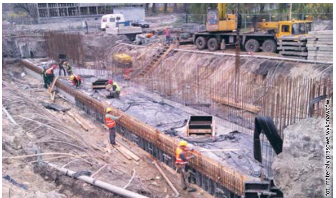
...a także obiektów w ciągu ul. Konarskiego nad przyszłą DTŚ