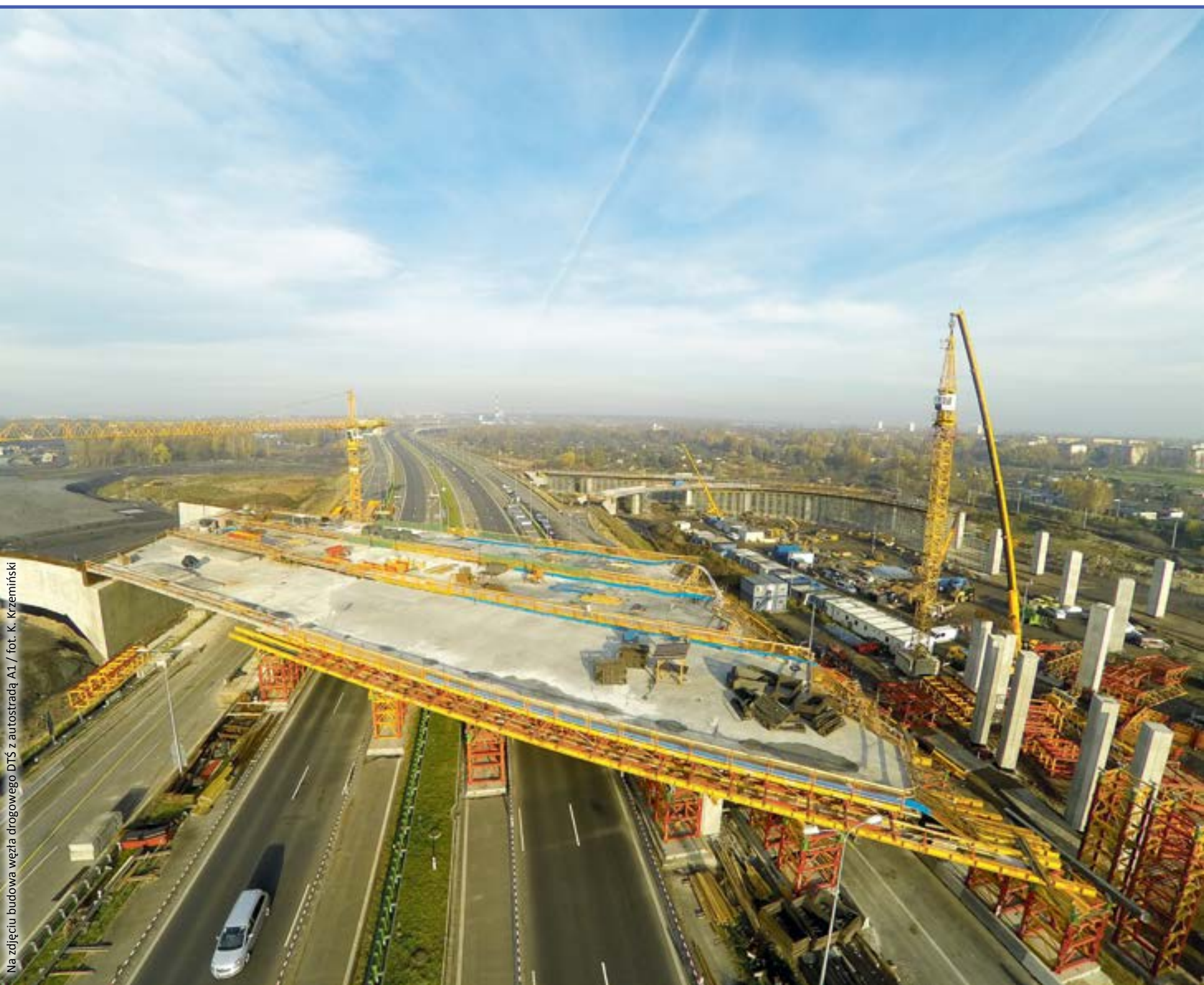
Na zdjęciu budowa węzła drogowego DTŚ z autostradą A1