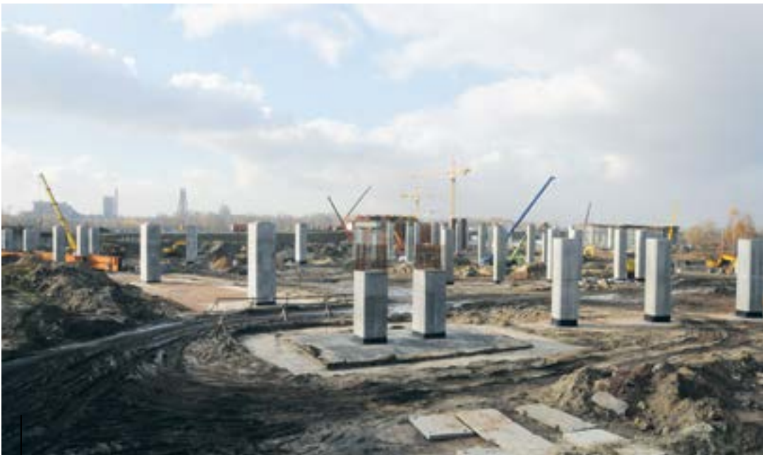
W sąsiedztwie autostrady „wyrósł” las słupów – wzniesiono je pod obiekty mostowe przyszłego węzła drogowego łączącego DTŚ i A1