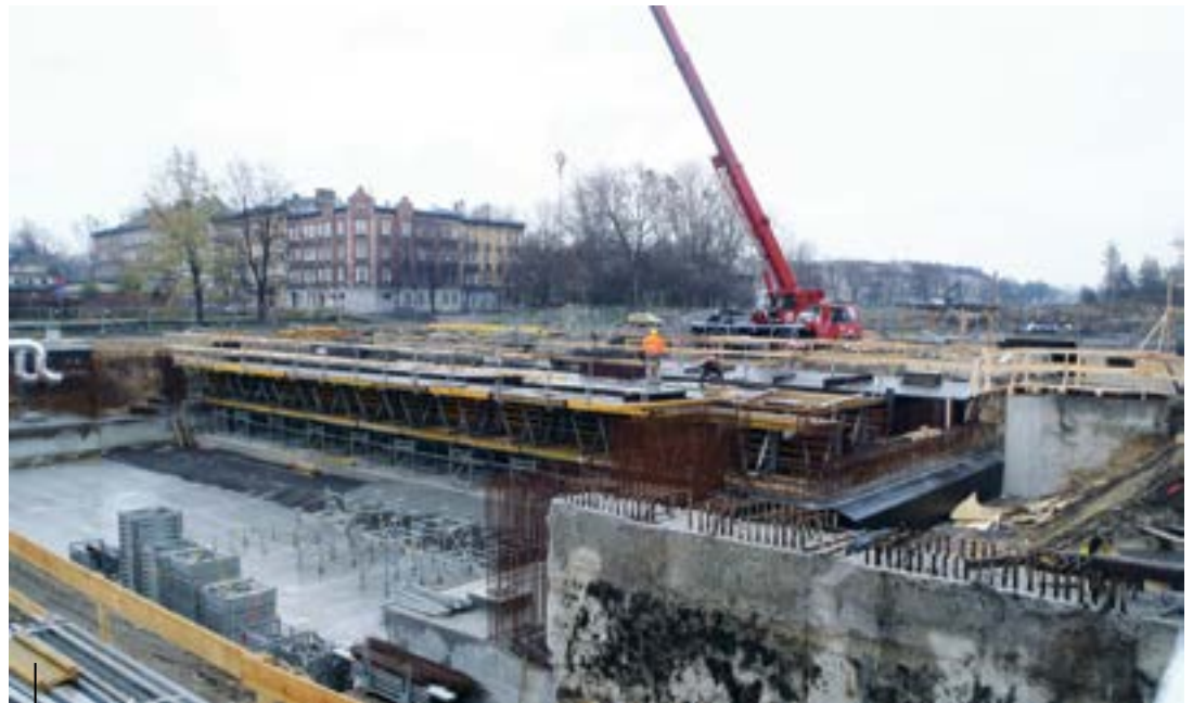
Sporo dzieje się także na odcinku G2. Trwa m.in. budowa wiaduktu i kładki dla pieszych, które połączą ulice Robotniczą i Franciszkańską...