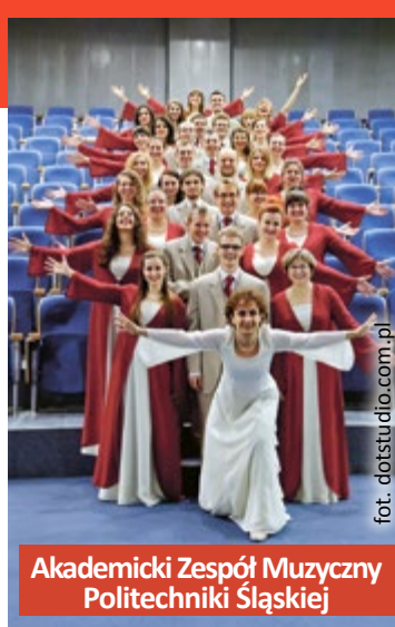
Akademicki Zespół Muzyczny Politechniki Śląskiej

Koncert rozpocznie się o godz. 19.00 w niedzielę 18 listopada. Wstęp jest bezpłatny. Impreza będzie połączona z promocją płyty „Treasures of Armenia”, na której można usłyszeć czternaście ormiańskich utworów w wykonaniu chórów z Armenii, Mołdawii, Niemiec i Polski. Każdy