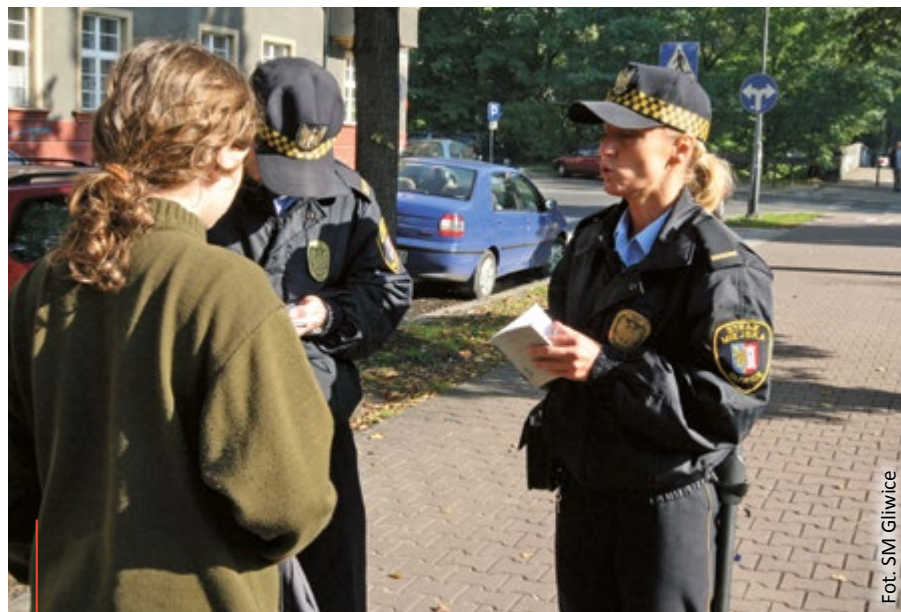
Nie bądźmy obojętni na ludzką niedolę. Bezpośrednie zgłoszenie lub bezpłatna infolinia (nr tel. 987) to jedno z narzędzi, dzięki którym możemy pomóc potrzebującym w ciężkim dla nich okresie

Infolinia działająca w Śląskim Urzędzie Wojewódzkim została uruchomiona dla osób, które tej pomocy potrzebują. Policja apeluje, aby dzwonili również zwykli mieszkańcy, gdy tylko zauważą coś niepokojącego. – Im więcej oczu w terenie, tym skuteczniej możemy wypatrzeć osoby potrzebujące. Dlatego zwracamy się do wszystkich, by nie pozostawać obojętnym wobec bezdomnych czy pijanych, śpiących na ławce w parku lub na przystanku autobusowym. Czasem wystarczy jeden telefon, by komuś uratować życie. Oprócz bezpłatnej infolinii (nr 987) zawsze do dyspozycji jest nr 112 lub 997 – mówi Marek Słomski, rzecznik KMP w Gliwicach. (pm)