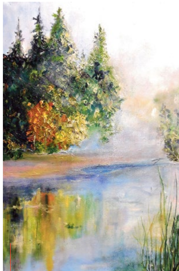
Obraz autorstwa Grażyny Burzak z cyklu „Krajobrazy emocji”