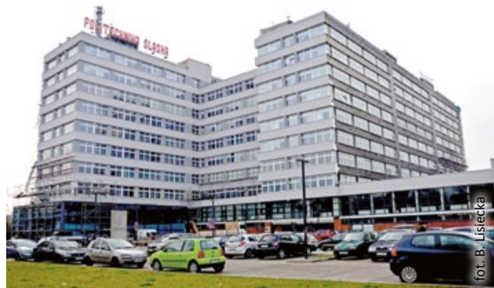
fol. B. Lisiecka

Generalnym wykonawcą robót na Politechnice jest Mostostal Zabrze GPBP SA. Nowa infrastruktura wydziałów posłuży obecnym, jak i przyszłym studentom, kształcącym się na takich kierunkach, jak: automatyka i robotyka, biotechnologia, elektronika i telekomunikacja, energetyka, informatyka, inżynieria bezpieczeństwa czy teleinformatyka. (kik)