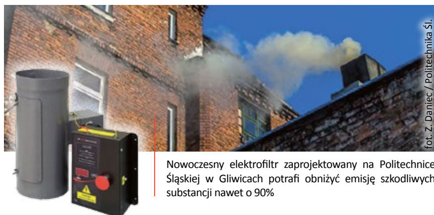
Nowoczesny elektrofiltr zaprojektowany na Politechnice Śląskiej w Gliwicach potrafi obniżyć emisję szkodliwych substancji nawet o 90%

Kolejnym etapem prac będzie uruchomienie programu pilotażowego, w ramach którego elektrofiltry trafią do kilkudziesięciu gospodarstw domowych na Śląsku, gdzie będą testowane w warunkach rzeczywistych. Jeśli pomysł się sprawdzi – a wszystko na to wskazuje – już niedługo będą one mogły być stosowane w prawie każdym domu i mieszkaniu ogrzewanym piecem opalonym węglem lub drewnem. (kik)