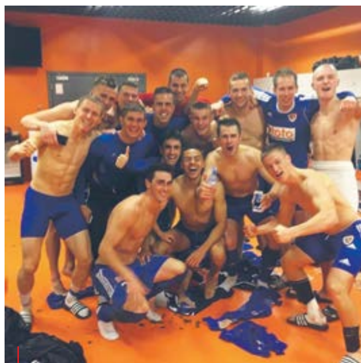
Tak cieszył się Piast po wygranej z Jagiellonią. Atmosfera w drużynie jest wyśmienita.

od negatywnych komentarzy. Zarówno nowy trener, jak i nowi zawodnicy – kolejka po kolejce, mecz po meczu – udowadniaли