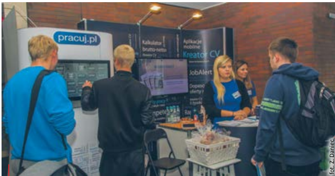
Politechnika Śląska kształci specjalistyczne kadry – to jeden z powodów, dla których firmy biorą udział w Giełdzie Pracodawcy i Przedsiębiorczości

– Gliwice mają wiele atutów, dlatego stopa bezrobocia jest tu niższa niż w regionie czy kraju. Po pierwsze i najważniejsze mamy kapitał ludzki. Dzięki działalności Politechniki Śląskiej stale na rynek pracy trafia wykształcona kadra, która jest bardzo dobrym zapleczem dla wielu firm powstających na terenie Gliwic. Na wyróżnienie zasługują też liczne instytuty badawcze, które oprócz tego, że same tworzą miejsca pracy, odgrywają istotną rolę w podnoszeniu kwalifikacji. Na niską stopę bezrobocia znaczący wpływ ma działająca już od wielu lat strefa ekonomiczna i firmy nowych technologii, w których zatrudnienie znajduje wielu specjalistów. Dla rozwoju firm, a co za tym idzie w tworzeniu miejsc pracy, istotne znaczenie mają władze miasta, które m.in.