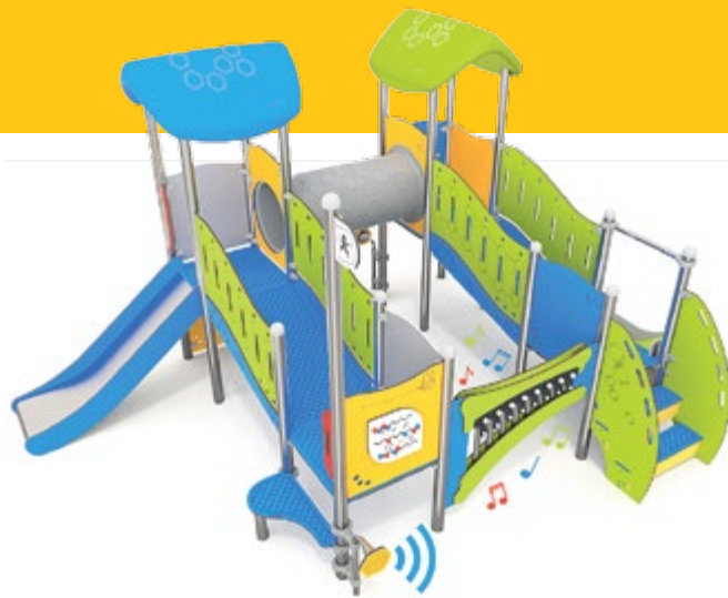
grafika projektowa RK Studio Katarzyna Roston

Trwa budowa nowego placu zabaw przy ul. Klasztornej. Wykonawca inwestycji został już wybrany. Zadanie realizowane w ramach Gliwickiego Budżetu Obywatelskiego powinno być gotowe na początku grudnia.