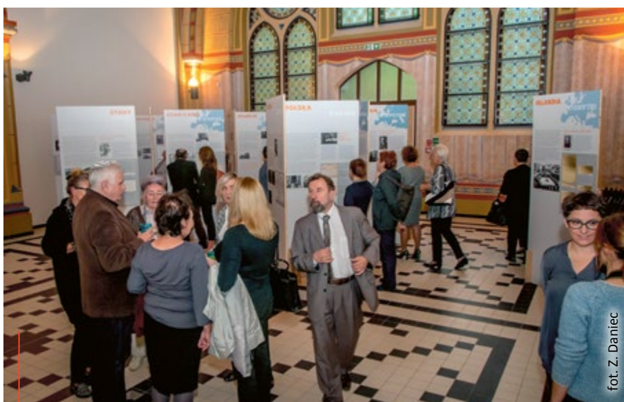
fol. Z. Daniec

temat historii Żydów na Górnym Śląsku oraz ich wkładu w rozwój naszego regionu. Tej tematyce poświęcona będzie wystawa stała. Dom Pamięci Żydów Górnośląskich jest przestrzenią dialogu międzykulturowego, debat na temat tolerancji i koegzystencji różnych religii, kultur i narodów. (pm)