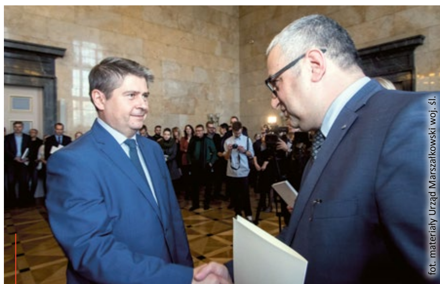
fol. materiały Urząd Marszałkowski woj. śl.

W Domu Pamięci Żydów Górnośląskich regularnie odbywają się wydarzenia sprzyjające krzewieniu tolerancyjnych postaw w duchu dialogu między różnymi kulturami