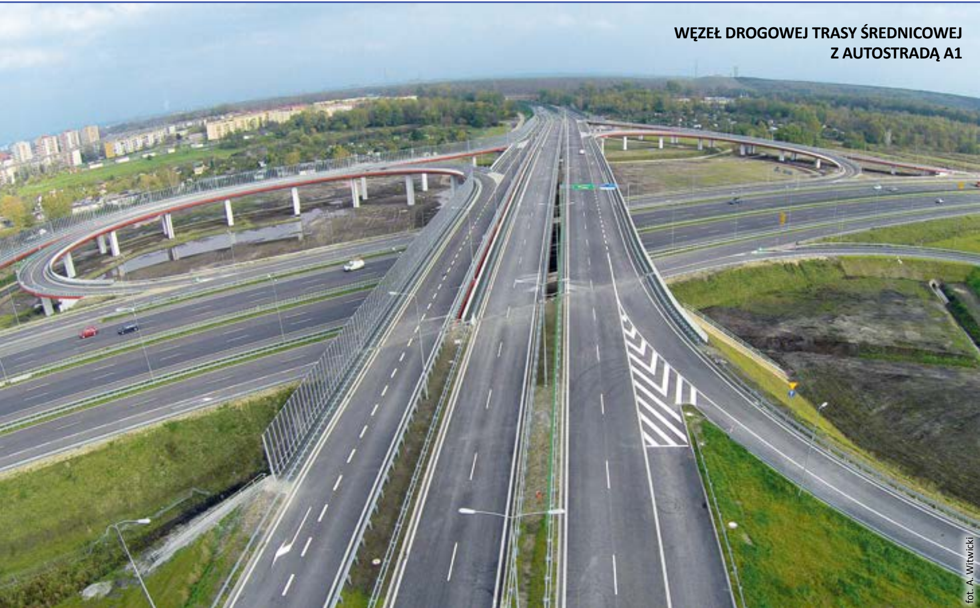
WĘZŁ DROGOWEJ TRASY ŚREDNICOWEJ Z AUTOSTRADĄ A1