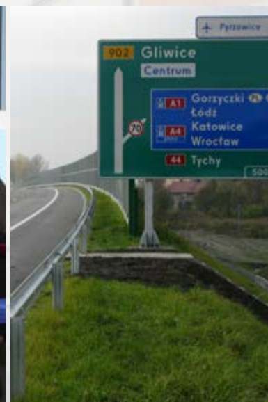
Od 5 listopada przejezdny jest pierwszy gliwicki odcinek DTŚ, od granicy miasta z Zabrzem do ul. Kujawskiej.