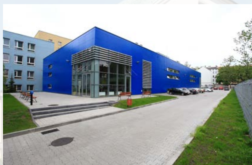
W maju zorganizowano dzień otwarty kolejnej miejskiej nowoczesnej hali sportowej – CHORZOWSKA 5