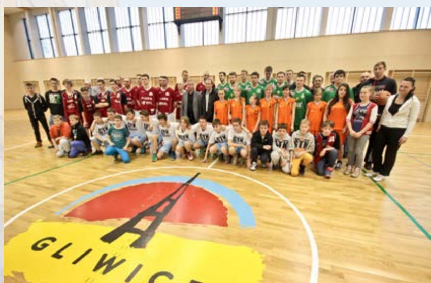
Na początku marca otwarto Centrum Sportowo-Kulturalne „Łabędź” w Łabędach