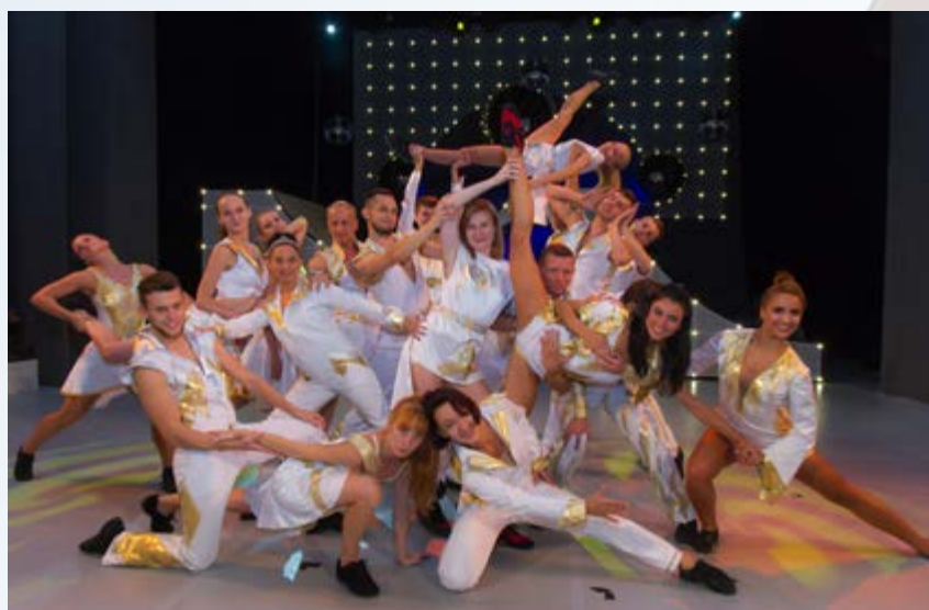
20 września – premiera widowiska „I have a dream” na deskach Gliwickiego Teatru Muzycznego