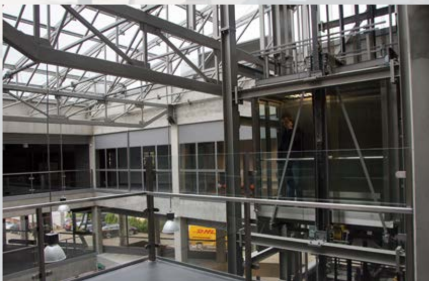
Tuż przed rozpoczęciem roku akademickiego na Politechnice Śl. uroczyste zainaugurowano działalność Centrum Nowych Technologii