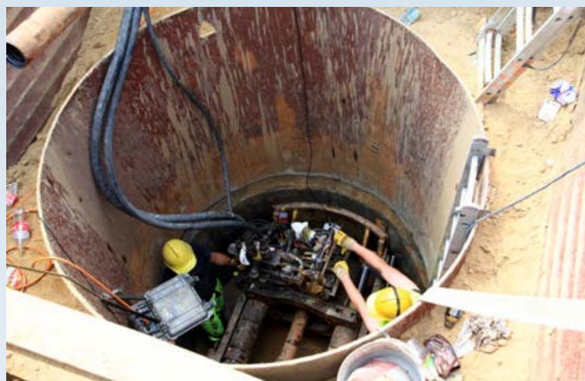
W lutym PWiK pozyskało kolejne miliony na budowę kanalizacji w Bojkowie i Ostropie