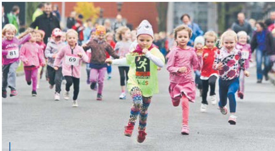
Biegowego bakcyła łapią wszyscy, od najmłodszych do najstarszych. Bieg Bąbla, Krasnala, Smyka, Urwisa, Juniora, Małolata i Nastolatka, to kategorie, w których rywalizowały dzieci i młodzież. Przegranych nie było – każdy dostał medal i odblaskowa opaskę