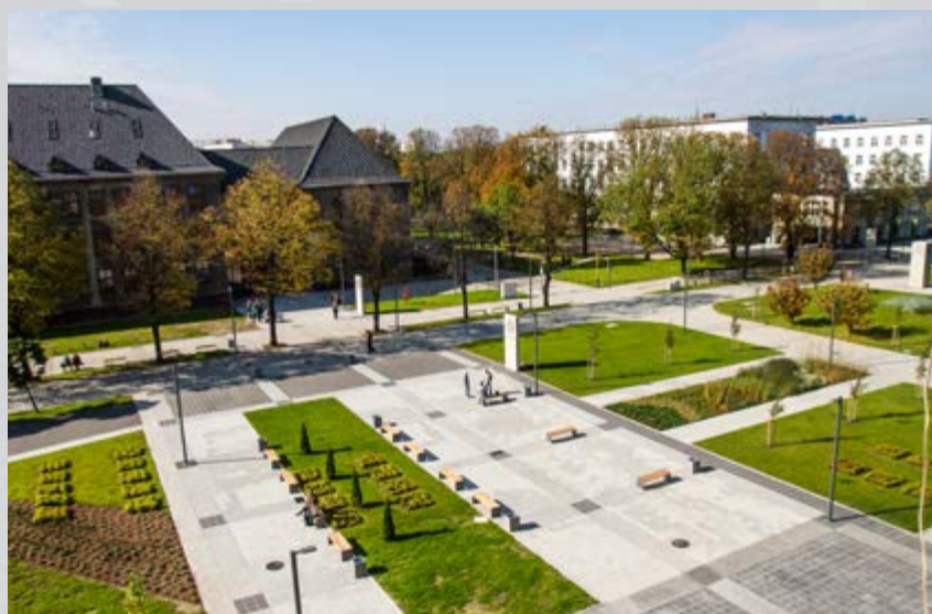
Zaprezentowano także Nowe Miasteczko Akademickie z odrestaurowanym deptakiem