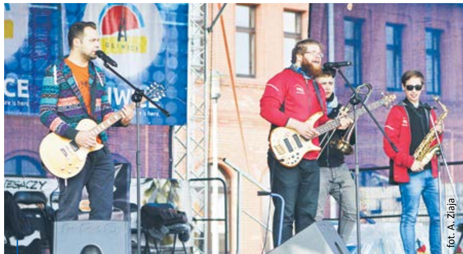
O oprawę muzyczną i dobre samopoczucie wszystkich uczestników gliwickiego półmaratonu zadbały zespoły Wiewiórka na Drzewie (na zdjęciu), Glass Balerina, Łami Łuki i Minimum Masy