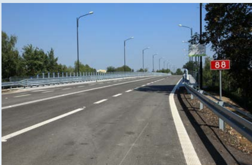
We wrześniu zakończyła się przebudowa wiaduktu nad torami kolejowymi w ciągu DK 88