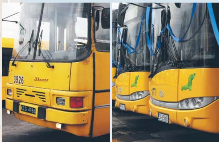
Żegnamy Ikarusy, witamy Solarisy (na zdjęciu z prawej) – gliwicki PKM symbolicznie pożegnał się z węgierską marką