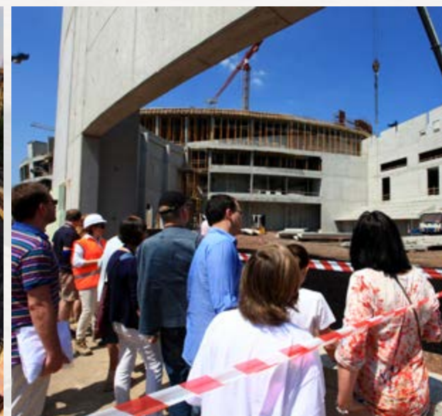
7 czerwca – dzień otwarty hali Gliwice. Wrażeń było co nie miara!