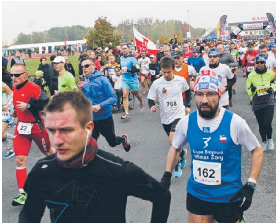
II Półmaraton Gliwicki ukończyło 1076 biegaczy. W sumie z atrakcji przygotowanych w Nowych Gliwicach skorzystało 1700 osób. Akcją koordynowało blisko 400 wolontariuszy – w tym ponad 250 uczniów gliwickich szkół oraz uczniowie Szkoły Mundurowej w Knurowie

Imprezie towarzyszyły targi sprzętu sportowego, spotkania ze sportowcami, tor przeszkód Runmageddon Kids oraz koncerty zespołów Wiewiórka na Drzewie, Glass Balerina, Łami Łuki i Minimum Masy. Impreza zorganizowana przez Fundację Bieg Rzeźnika, biegacze stowarzyszonych w gliwickim klubie OTK Rzeźnik oraz Rybnickiej Grupie Biegowej, została dofinansowana z budżetu miasta Gliwice. (mf)