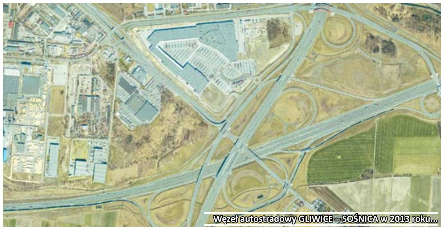
Węzeł autostradowy GLIWICE – SOŚNICA w 2013 roku...