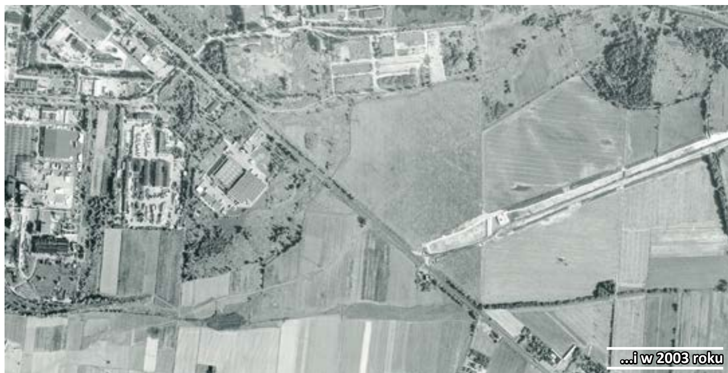
...i w 2003 roku

Multimedialny MSIP, wdrożony przez Urząd Miejski w Gliwicach dzięki wsparciu z Europejskiego Funduszu Rozwoju Regionalnego, ma ogromne możliwości. Kryją się one w 7 serwisach mapowych (głównym – geoportalu mieszkańca – dedykowanym gliwiczansom i turystom, geoportalach: inwestora, komunikacyjnym, wyborczym i komunikacyjnym, serwisie Biblioteki Miejskiej, Katalogu metadanych oraz serwisie 3D). Warto wiedzieć, że strona MSIP zawiera również odnośniki do akustycznej mapy Gliwic oraz mapy Drogowej Trasy Średnicowej z zaznaczonymi (obowiązującymi od wiosny) zmianami w organizacji ruchu w mieście.