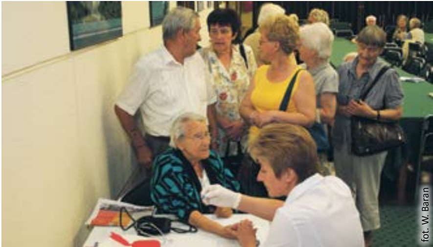
fol. W. Baran