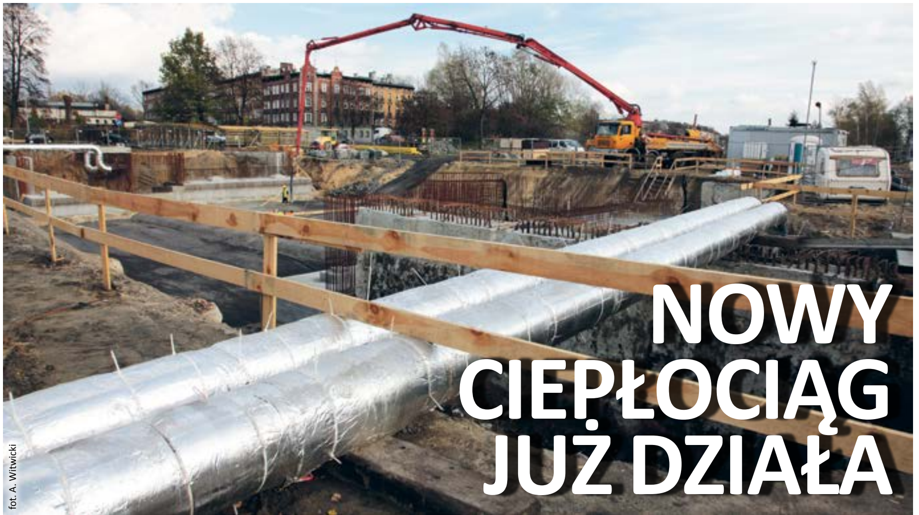
fol. A. Witwicki