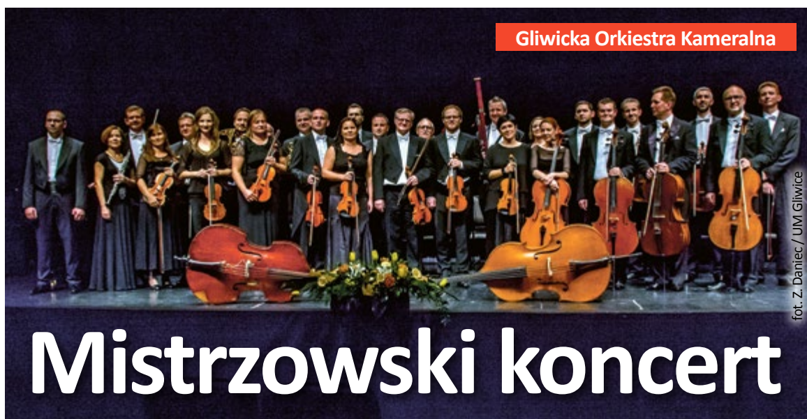
Gliwicka Orkiestra Kameralna