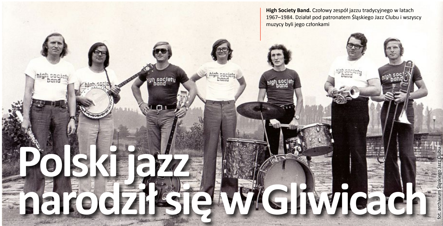
High Society Band. Czołowy zespół jazzu tradycyjnego w latach 1967–1984. Działał pod patronatem Śląskiego Jazz Clubu i wszyscy muzycy byli jego członkami