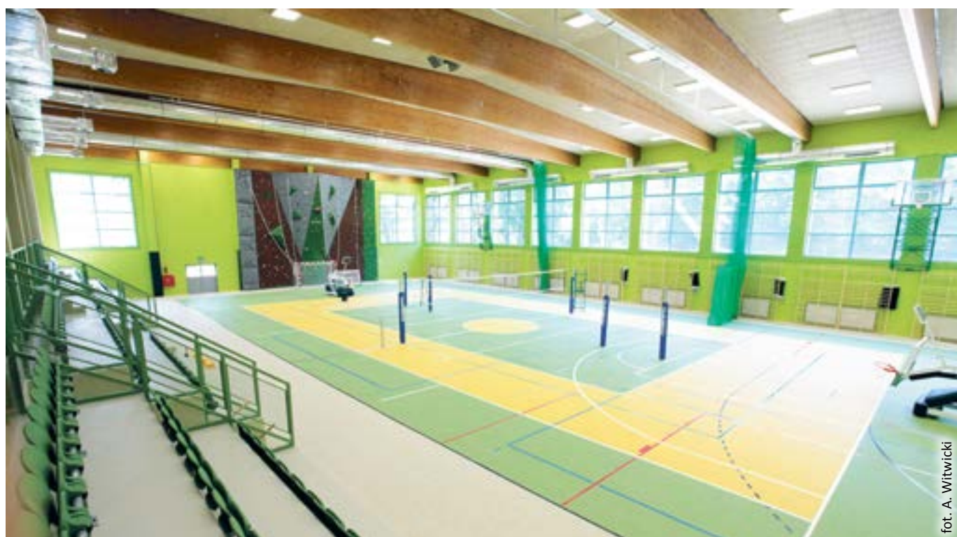
fol. A. Witwicki

Nowoczesny obiekt sportowy przy ul. Kozielskiej 1 znajduje się przy Zespole Szkół Ekonomiczno-Usługowych i Zespole Szkół Ogólnokształcących nr 1. Mieści pełnowymiarowe boiska, na których można uprawiać różne dyscypliny sportu – m.in. koszykówkę, siatkówkę,