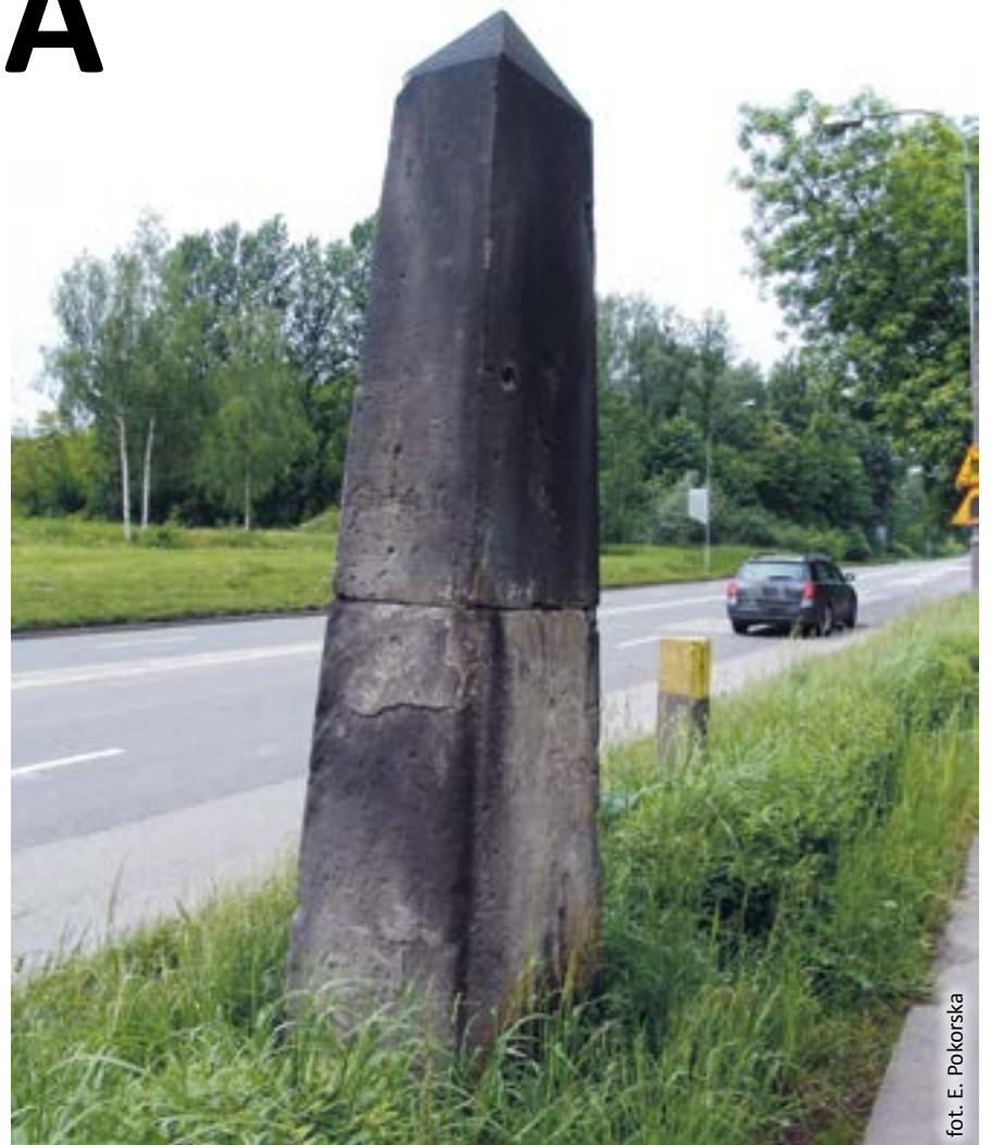
fol. E. Pokorska

Więcej na temat intrygujących obiektów z ul. Pszczyńskiej można przeczytać