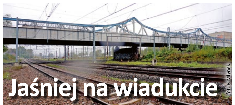
fol. P. Mlynek