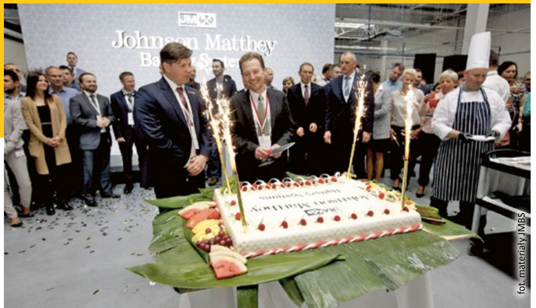
fol. materiały JMBS

cializuje się w produkcji nowoczesnych rozwiązań zasilania. Bardzo dobrą wiadomością jest również to, że JMBS chce nie tylko produkować, ale także kładzie nacisk na prace badawczo-rozwojowe w ramach swej działalności w Gliwicach. Takie przedsięwzięcia zapewniają Gliwicom rozwój, co pozwala z optymizmem patrzeć na przyszłość naszego miasta – mówił Zygmunt Frankiewicz, prezydent Gliwic, podczas otwarcia nowej siedziby JMBS.