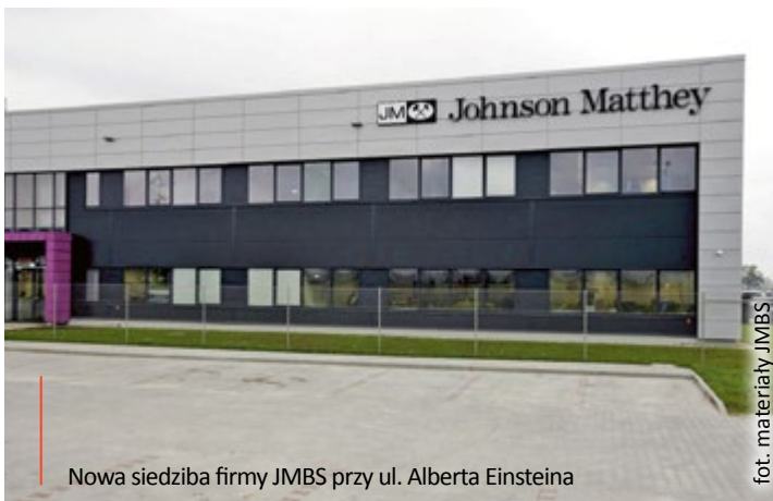
Nowa siedziba firmy JMBS przy ul. Alberta Einsteina

elektrycznych i hybrydowych. Przetwarza 50 milionów ogniw litowo-jonowych rocznie, dostarczając dwa i pół miliona baterii na globalny rynek. Johnson Matthey Battery Systems jest częścią Johnson Matthey Plc., międzynarodowej firmy specjalizującej się w produkcji zaawansowanych materiałów chemicznych, działającej na rynku międzynarodowym od ponad 200 lat. Firma jest obecna w Gliwicach od 1999 r. i jest laureatem wielu prestiżowych nagród i wyróżnień, m.in.: Air Quality Excellence Award, Pharmaceutical CMO Leadership Awards, ICSA Awards, Britain's Most Admired Company, The Queen Award: Sustainable Development, IChemE Sustainable Technology Award, IChemE Innovative Product of the Year 2015, Chemical Industry Award. (mf)