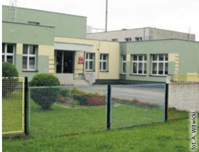
Przedszkole Miejskie nr 28