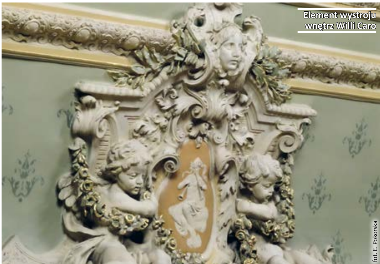
Element wystroju wewnątrz Willi Caro