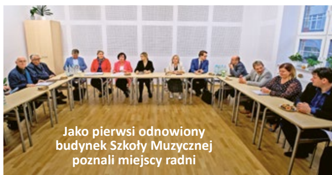
Jako pierwsi odnowiony budynek Szkoły Muzycznej poznali miejscy radni

gliwiczian na dzień otwarty – między godz. 13.00 a 17.00 każdy zainteresowany będzie mógł zobaczyć efektowne wnętrza oraz posłuchać muzyki i śpiewu najwyższych lotów.