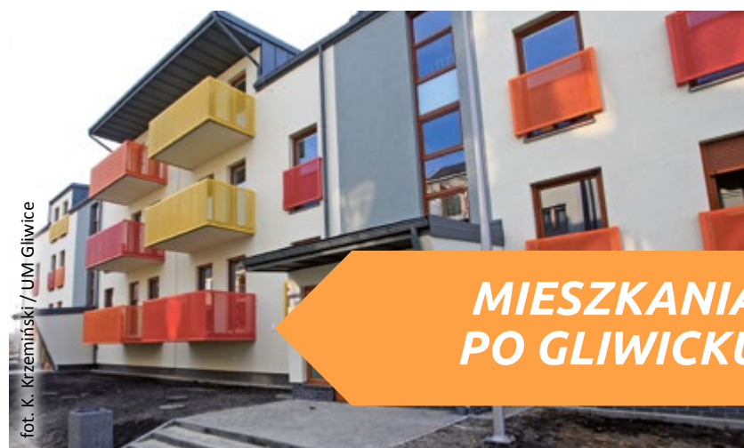
MIESZKANIA PO GLIWICKU

Gliwice z powodzeniem realizują swój własny program mieszkaniowy. Wydają rocznie od 20 do 30 mln zł na szeroko zakrojone remonty mieszkań komunalnych i dopłaty do funduszy remontowych wspólnot mieszkaniowych, które decydują się na modernizację swoich nieruchomości. Miasto realizuje też nowe inwestycje mieszkaniowe, które w ostatnich 4 latach zaowocowały 1 100 nowymi komfortowymi lokalami (ul. Jana Pawła II, Żeromskiego, Jasna, Targowa, Kochanowskiego, Staromiejska). Najnowszą inwestycją miasta są wielorodzinne budynki komunalne przy ul. Kujawskiej.