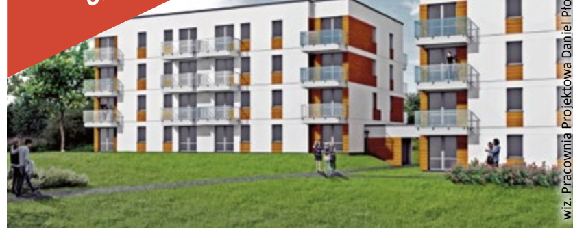
NAJNOWSZA INWESTYCJA – BUDYNKI KOMUNALNE PRZY UL. KUJAWSKIEJ

Gliwice z powodzeniem realizują swój własny program mieszkaniowy. Wydają rocznie od 20 do 30 mln zł na szeroko zakrojone remonty mieszkań komunalnych i dopłaty do funduszy remontowych wspólnot mieszkaniowych, które decydują się na modernizację swoich nieruchomości. Miasto realizuje też nowe inwestycje mieszkaniowe, które w ostatnich 4 latach zaowocowały 1 100 nowymi komfortowymi lokalami (ul. Jana Pawła II, Żeromskiego, Jasna, Targowa, Kochanowskiego, Staromiejska). Najnowszą inwestycją miasta są wielorodzinne budynki komunalne przy ul. Kujawskiej.