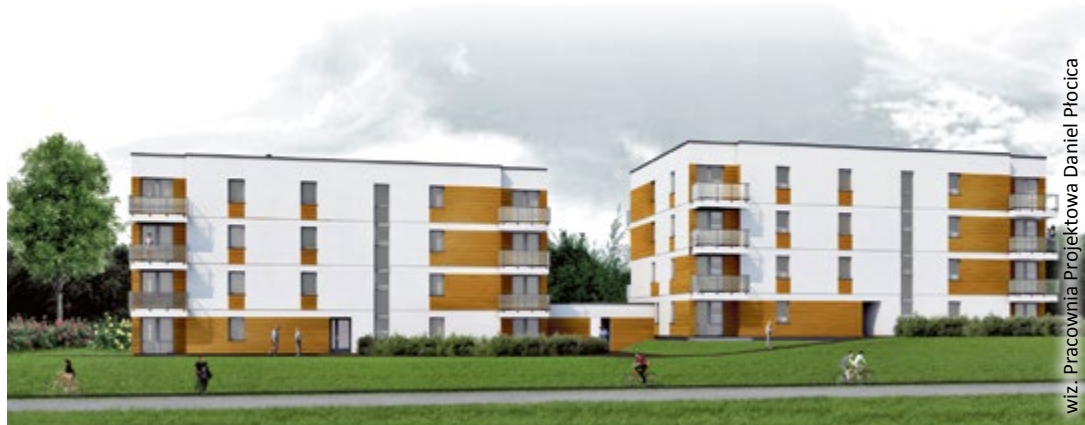
wiz. Pracownia Projektowa Daniel Płocica

– Dobrze funkcjonujące miasto, to takie w którym jest dobra praca i warunki do wygodnego życia. Od lat konsekwentnie i planowo dbamy o poprawę sytuacji mieszkaniowej w Gliwicach. Przeznaczamy ogromne kwoty na remonty zasobu mieszkaniowego. Jako jedno z nielicznych miast w Polsce mamy praktycznie 100% planów zagospodarowania przestrzennego, dzięki czemu zwłaszcza w ostatnim czasie w Gliwicach powstaje bardzo dużo prywatnych inwestycji mieszkaniowych. Szeroki program inwestycyjny od lat prowadzą też nasze spółki. Inaugurujemy budowę kolejnego dużego kompleksu komfortowych mieszkań komunalnych.