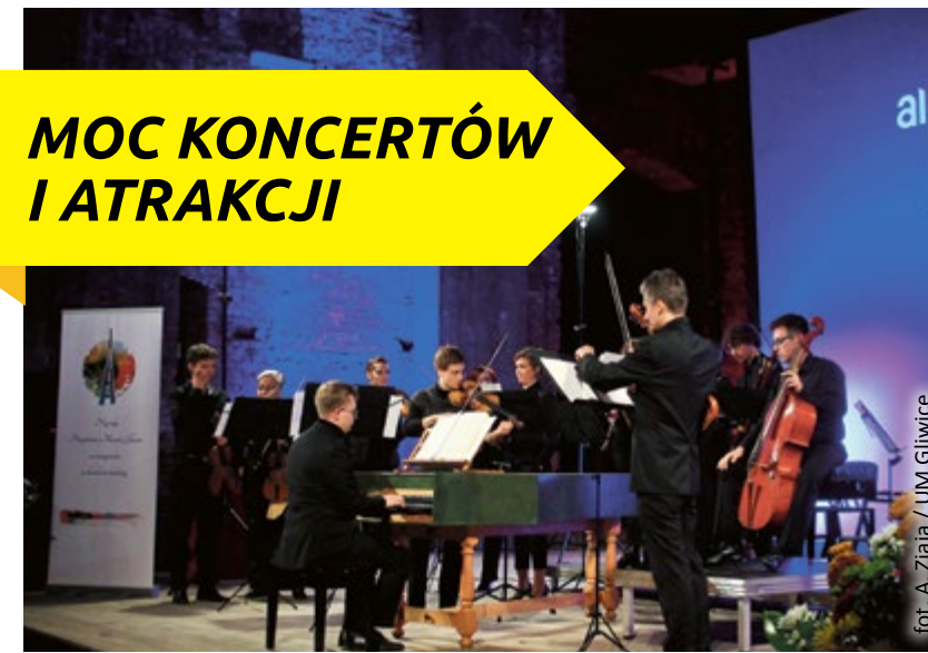
MOC KONCERTÓW I ATRAKCJI

W Gliwicach każdego miesiąca odbywają się festiwale muzyczne, imprezy plenerowe, wystawy, spektakle teatralne i nowatorskie przedsięwzięcia artystyczne. W bogatym wachlarzu propozycji są m.in. otwarte imprezy organizowane przez samorząd, takie jak Noc Świętojańska czy Muzyczne Pożegnanie Wakacji. Specjalne programy edukacyjne dla mieszkańców w każdym wieku przygotowują Muzeum w Gliwicach, Dom Pamięci Żydów Górnos Śląskich, Teatr Miejski i kino Amok. A prawie wszystkie wydarzenia w mieście – włącznie z tymi największymi, jak festiwal Ulicznicy, Filharmonia, Parkowe Lato czy PalmJazz – są organizowane dzięki znacznemu dofinansowaniu z miejskiej kasy. Głównym mecenasem szeroko rozumianej kultury w Gliwicach jest bowiem samorząd, który w 4 ostatnich latach przeznaczył na ten cel z budżetu ok. 95 mln zł. Miasto hojnie wspiera kulturę poprzez konkursy, małe granty i inne formy współfinansowania, i to się opłaca – w Gliwicach sporo się dzieje!