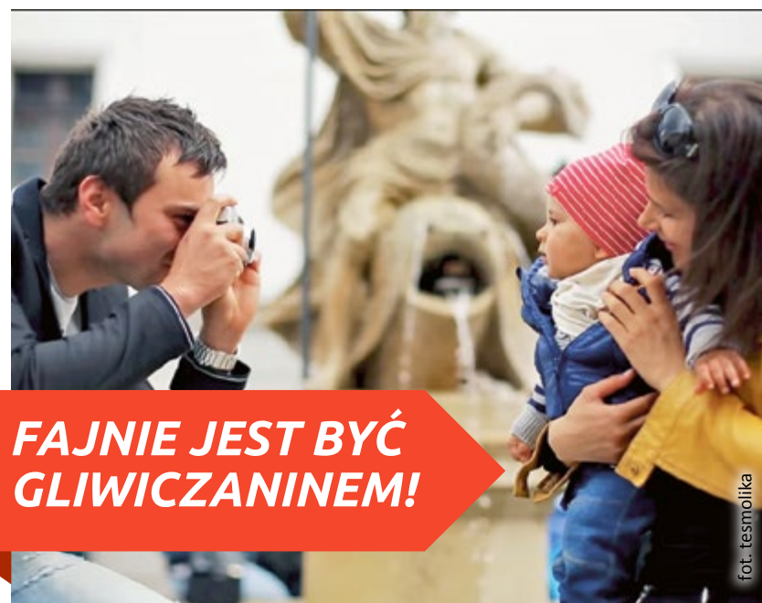
FAJNIE JEST BYĆ GLIWICZANINEM!

Miasto docenia duże rodziny i seniorów, dla których uruchomiło przed kilkoma laty programy „Rodzina 3+” oraz „Gliwicki Senior”. Od początku ich istnienia do końca września br. z atrakcyjnych zniżek i ulg m.in. za przejazdy kolejowe, bilety do teatru czy wejściówki na basen skorzystało już tysiące mieszkańców, dysponujących jedną z 8,5 tys. kart „Rodzina 3+” lub jedną z 6,3 tys. Kart Seniora. Gliwice cenią również tych, którzy chcą się tutaj zadomowić i po przeprowadzce w innej gminie decydują się zameldować na pobyt stały. Podziękowaniem miasta dla świeżo upieczonych gliwiczian są drobne, ale bardzo gliwickie upominki wydawane na podstawie zaświadczenia o zameldowaniu. Na „prezent powitalny” składają się gliwicka koszulka oraz kubek z symbolami Rynku, Radiostacji i Areny Gliwice.