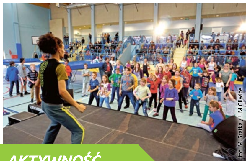
AKTYWNOŚĆ PO GODZINACH

Co zmieniło się w Gliwicach w ostatnich 4 latach? Jak nam się mieszka, pracuje, spędza wolny czas? Tego wszystkiego dowiemy się z lektury drugiego odcinka cyklu Raport o Gliwicach. Zapowiada on szczegółowe zestawienie za okres od 2014 roku do połowy roku bieżącego – już wkrótce do pobrania ze strony Gliwice.eu .