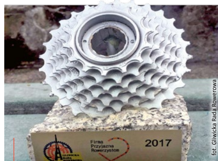
Główna nagroda w konkursie „Firma Przyjazna Rowerzystom” trafiła do firmy Etisoft