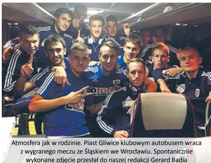
Atmosfera jak w rodzinie. Piast Gliwice klubowym autobusem wraca z wygranego meczu ze Śląskiem we Wrocławiu.