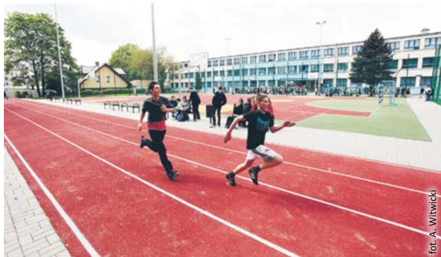
fol. A. Witwicki

Pieniądze z kredytów przeznaczono w ostatnich latach na realizację lub refinansowanie różnych inwestycji poprawiających jakość życia w mieście i przyczyniających się do dalszego rozwoju. Wśród nich znalazły się m.in.: