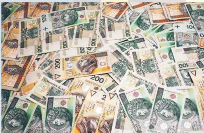
Gliwice rozpoczynają nowy rok w dobrej kondycji finansowej. Wydatki miasta mogą wynieść pierwszy raz ponad miliard złotych!