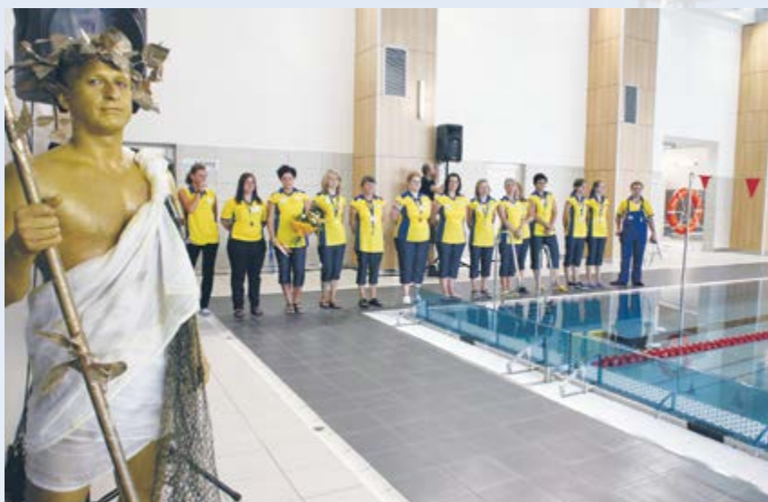
W Sośnicy otwarto kryty basen „Neptun”. To czwarta nowoczesna, miejska pływalnia w Gliwicach