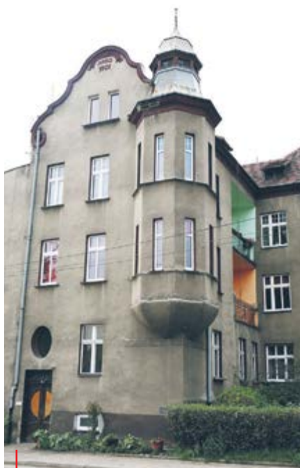
W tym domu mieszkał Tadeusz Różewicz