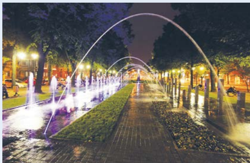
Spacer wśród strumieni. W samym centrum Gliwic, na Pl. Marszałka Józefa Piłsudskiego powstała nowoczesna i imponująca fontanna!