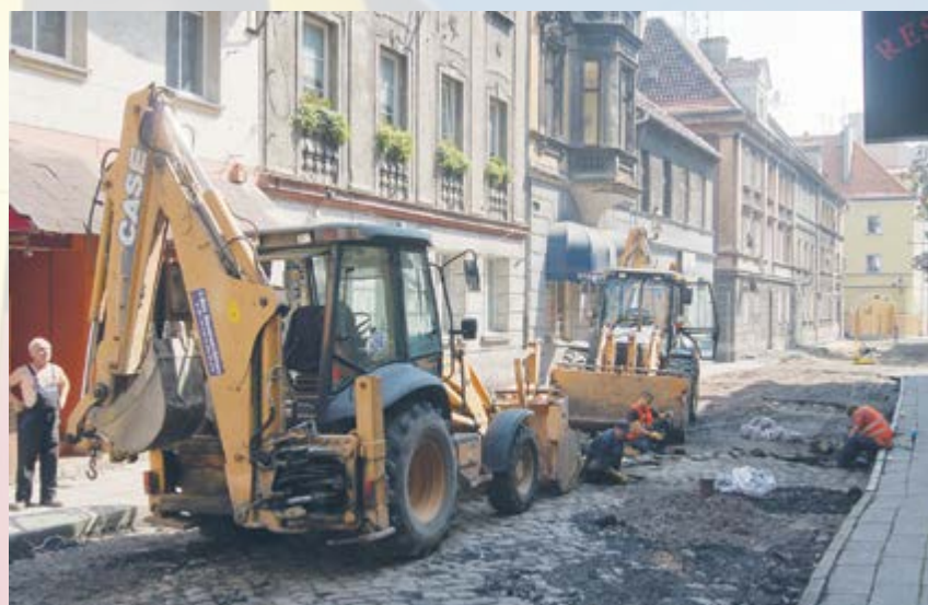
Wszystkie uliczki w pobliżu Rynku zostaną odnowione! Prace będą wykonywane etapami przez 5 lat za ponad 41 mln złotych