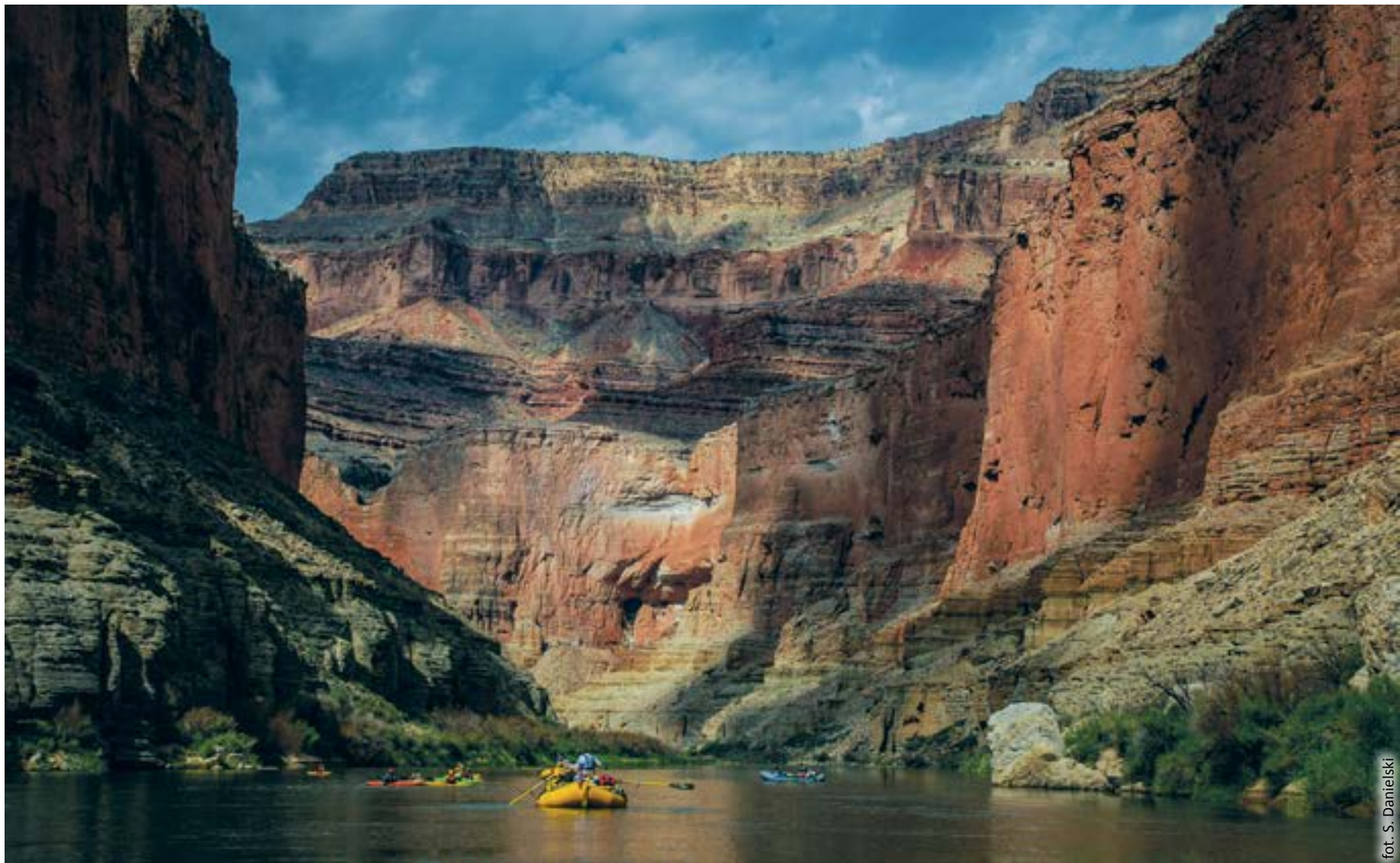
fol. S. Danielski