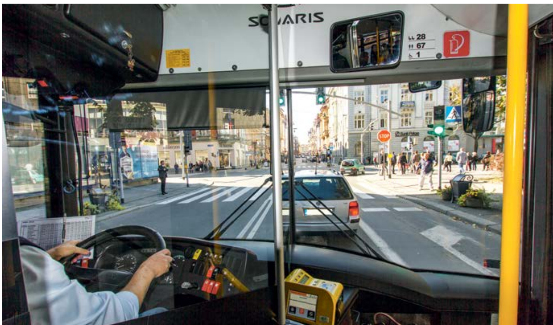
Sieć szerokopasmowa poszerza zasięg inteligentnego systemu zarządzania sygnalizacją świetlną. Na zdjęciu autobus linii A4 mogącej korzystać z tzw. priorytetu światła zielonego w ramach ITS