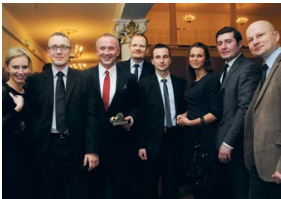
Tegoroczny laureat dedykował lwią statuettkę całemu zespołowi Plastic Omnium. Jego reprezentacja dopingowała szefa podczas gali

utrzymało zatrudnienie, co było wyjątkowym sukcesem w kontekście bardzo trudnej sytuacji, w jakiej znalazł się Plastal – wspomina menedżer. Kilkakrotnie jeszcze podkreśla, że gliwicka fabryka wyszła obronną ręką z procesu upadłościowego dzięki ogromnemu zaangażowaniu całego zespołu, a także dobrej współpracy z syndykiem i merytorycznemu wsparciu wielu życzliwych ludzi.