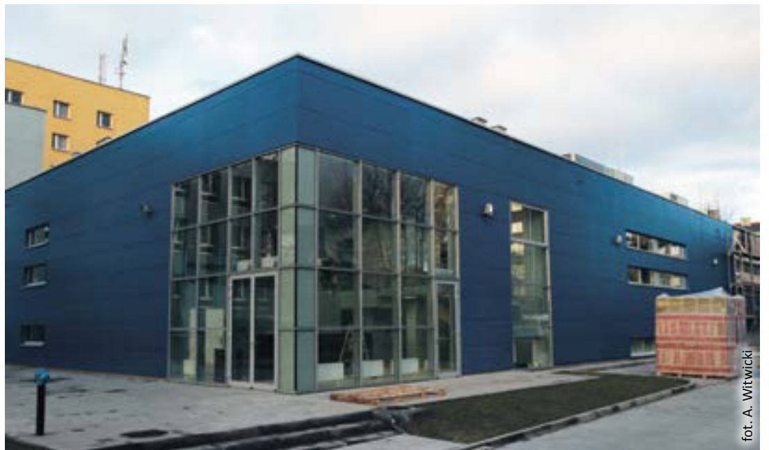
fol. A. Witwicki

do tenisa stołowego. Budynek skomunikowano łącznikiem ze szkołą, teren wokół niego jest ogrodzony i oświetlony, a dla użytkowników przygotowano 33 miejsca parkingowe, w tym miejsca dla osób niepełnosprawnych.