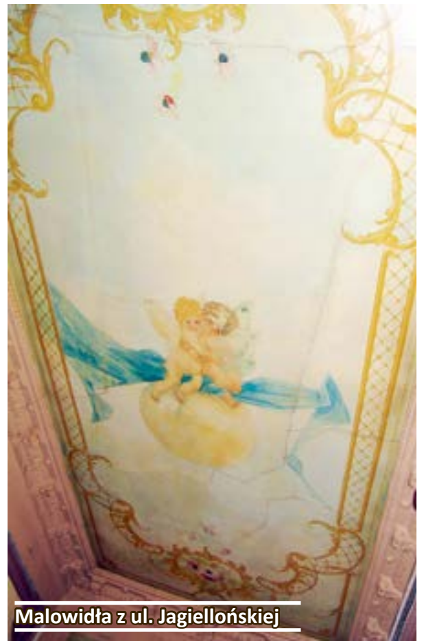
Malowidła z ul. Jagiellońskiej

Idylliczny krajobraz miał być może przekazywać jakieś ukryte treści lub po prostu odzwierciedlał wymagania zleceniodawcy tych zdobień. Warto jednak przypomnieć, że anioły były symbolem posłańców, a motyl obrazuje przemianę, odrodzenie, jednocześnie mówiąc o krótkotrwałości życia – to tłumaczenie z symboliki