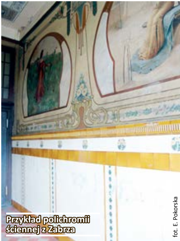
Przykład polichromii ściennej z Zabrze