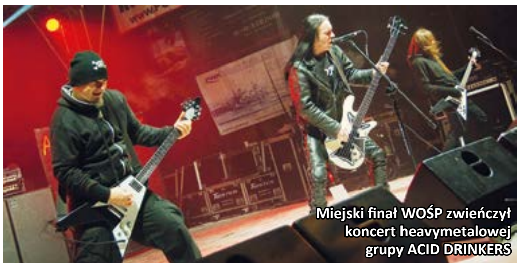
Miejski finał WOŚP zwieńczył koncert heavymetalowej grupy ACID DRINKERS