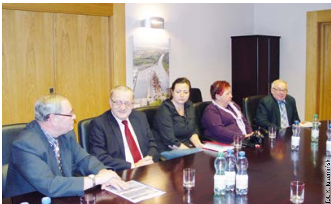
Kolejne spotkanie z reprezentantami działkowców

zostanie po prostu rozwiązany, majątek związku znacjonalizowany, a setki tysięcy działkowców pozostawionych samym sobie, co może doprowadzić do anarchizacji struktur na ogrodach.