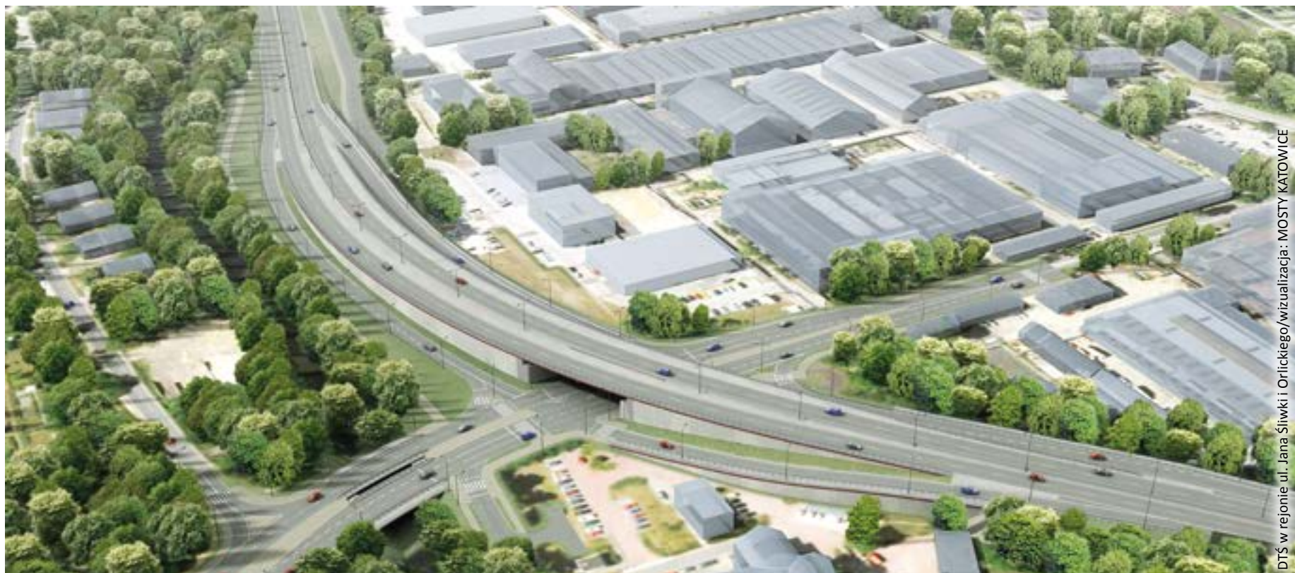
DTŚ w rejonie ul. Jana Śliwki i Orlickiego/wizualizacja: MOSTY KATOWICE