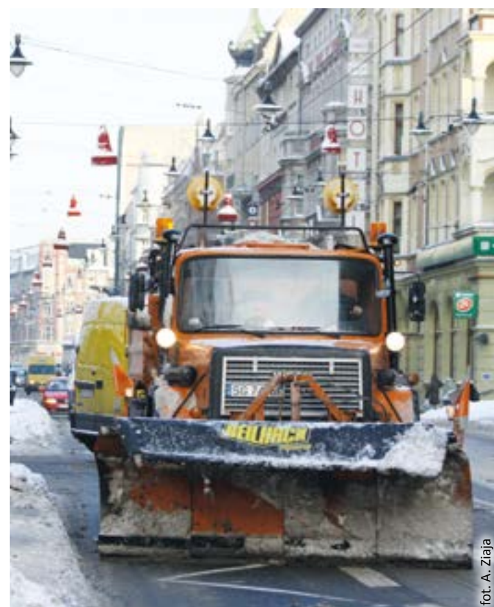
fol. A. Ziela

Warto wiedzieć, że odśnieżaniem tras A1 i A4 w obrębie Gliwic i zjazdów autostradowych zajmuje się Generalna Dyrekcja Dróg Krajowych i Autostrad. Warto też pamiętać, że niektóre drogi w mieście znajdują się w gestii spółdzielni i wspólnot mieszkaniowych i to one odpowiedzialne są za odśnieżanie swoich terenów. Natomiast usuwanie śniegu z chodników przy prywatnych posesjach należy do obowiązków właścicieli tych nieruchomości. Nie jest to powinność zarządcy dróg publicznych! Tę kwestię wyraźnie reguluje obowiązujące w naszym kraju ustawodawstwo. (bom)