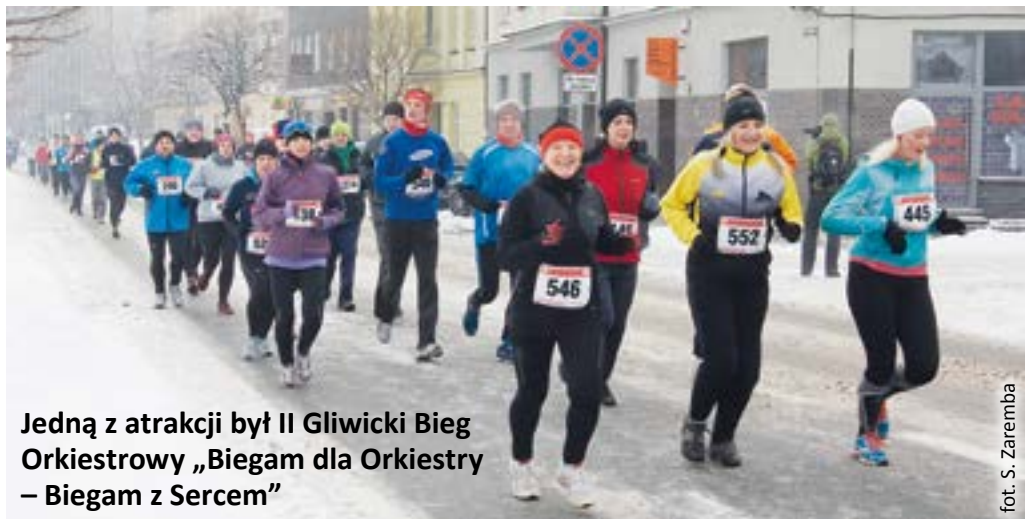
Jedną z atrakcji był II Gliwicki Bieg Orkiestrowy „Biegam dla Orkiestry – Biegam z Sercem”