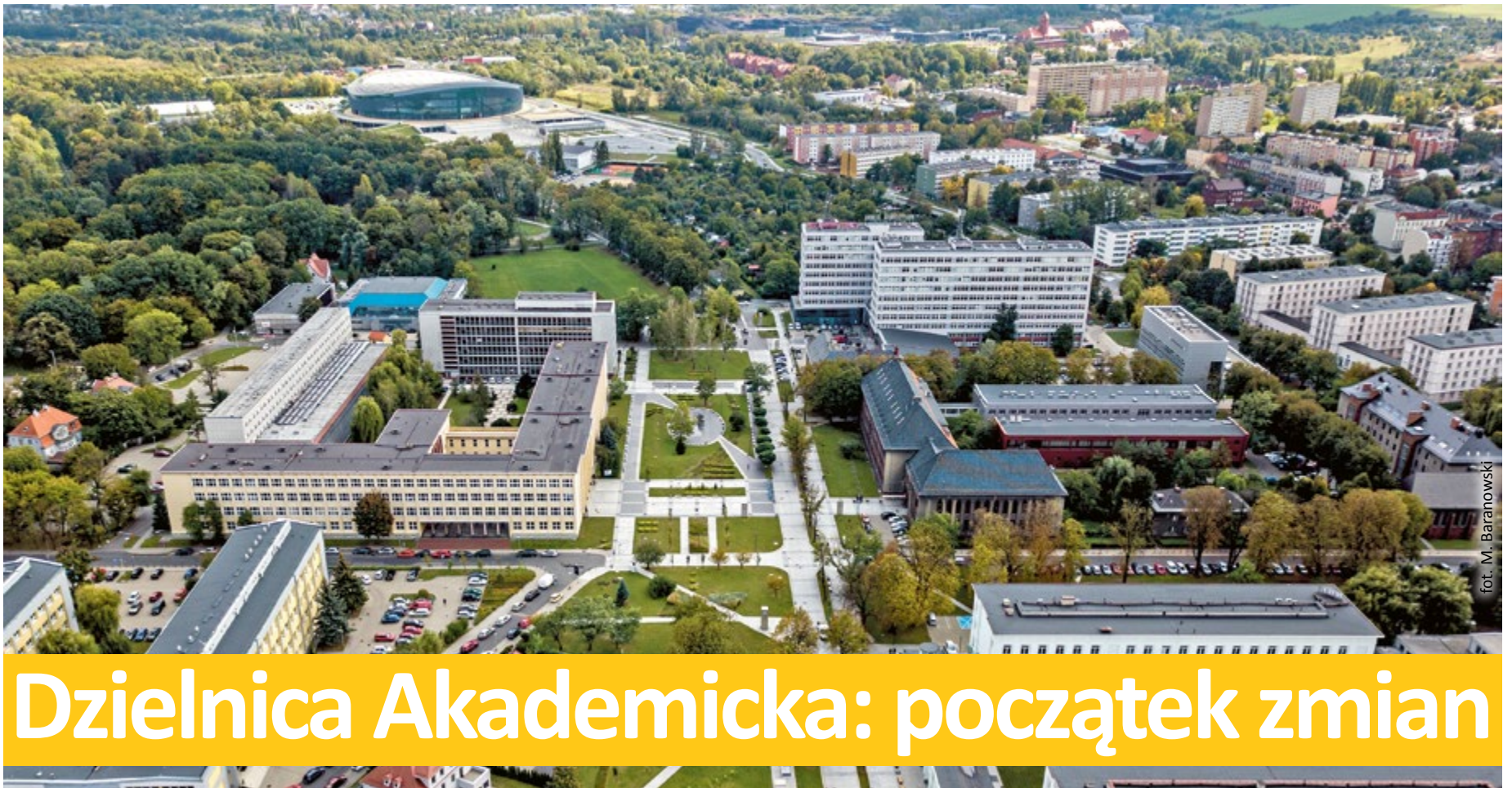
fol. M. Baranowski