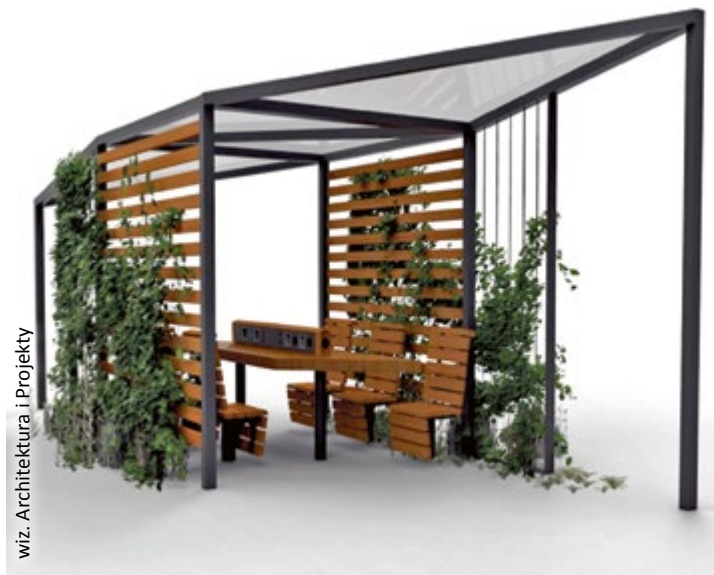
wiz. Architektura i Projekty

Przypominamy, że Miasto od lat organizuje też konkurs Gliwickie Plac Zabaw, doposażający miejsca rekreacji małych gliwiczian. (mf)