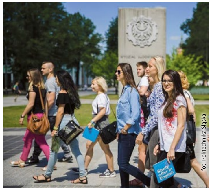
fol. Politechnika Śląska

W kolejnych latach miasto konsekwentnie realizowało plan przemiany tej części Gliwic w centrum rekreacyjno-kulturalne. Z pierwszych efektów tej przebudowy możemy już w pełni korzystać.