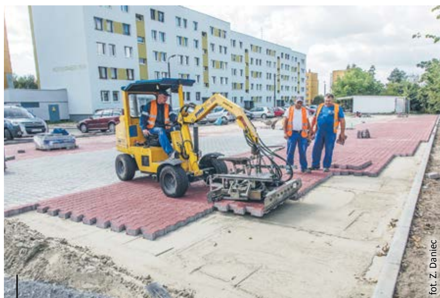
Na ulicy Paderewskiego trwa budowa miejsc parkingowych