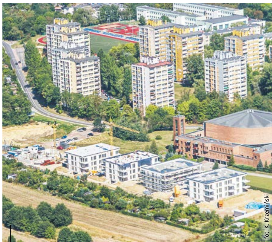
Nowy kompleks mieszkalny na osiedlu Sikornik będzie połączony z ul. Pliszki

Powstanie kompleksu mieszkaniowego wiąże się z koniecznością skomunikowania go z miejskim układem drogowym i zapewnienia kierowcom bezpiecznego przejazdu. Dlatego miasto zawarło z firmą Nexx porozumienie, zgodnie z którym budowa 3-włotowego minironda na