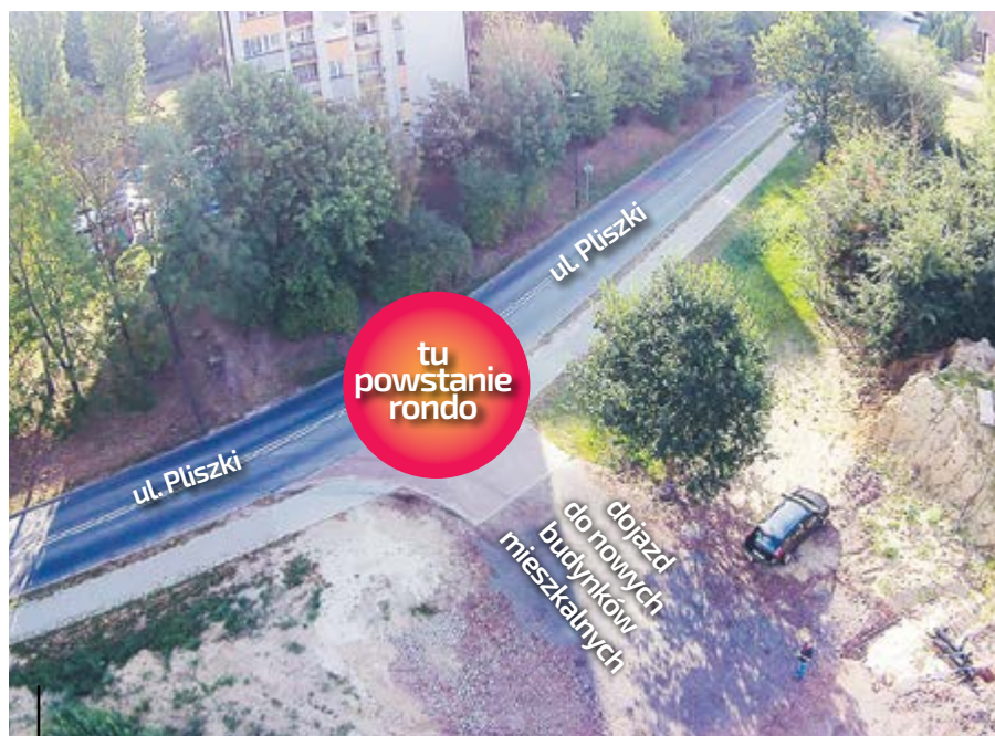
Prace przy budowie minironda rozpoczną się już niedługo

w nich około 100 mieszkań. Jak informuje deweloper, o budowie w Gliwicach zdecydowała przede wszystkim lokalizacja, dobra komunikacja oraz duży potencjał miasta, w tym szczególnie rozwój strefy ekonomicznej i tworzenie wielu miejsc pracy.