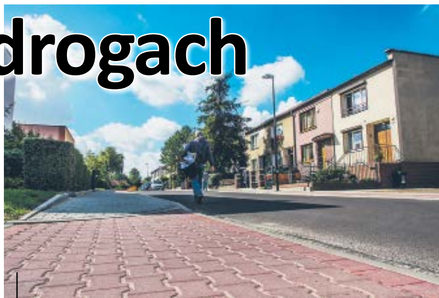
Ulica Karolinki już po remoncie