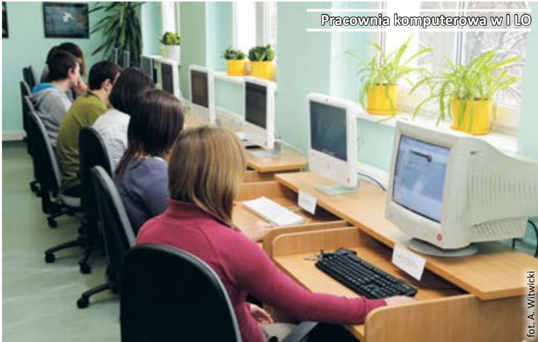
Pracownia komputerowa w I LO