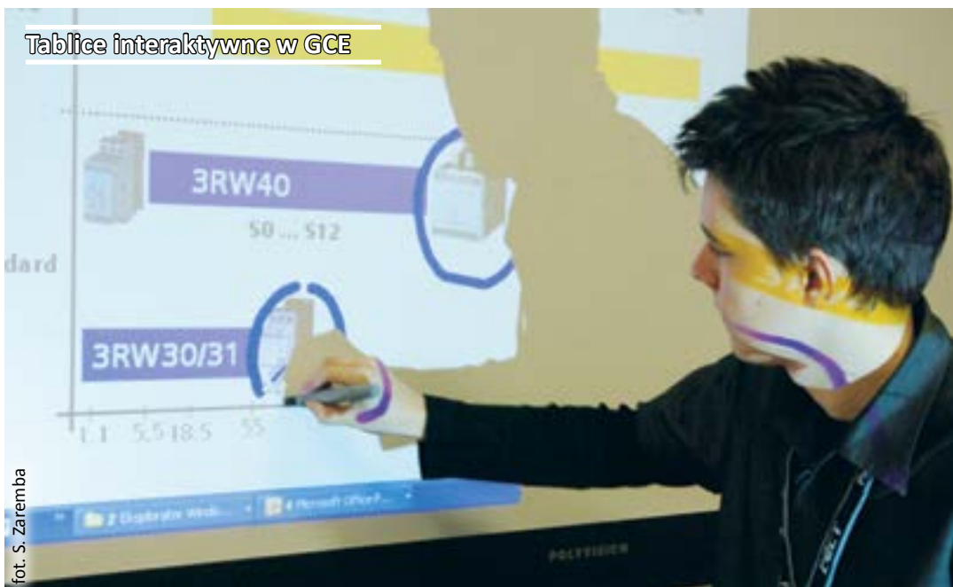
Tablice interaktywne w GCE

Program „Aktywna Edukacja” jest prowadzony w ramach projektu „Wdrożenie podstawy programowej kształcenia ogólnego w przedszkolach i szkołach”. Projekt jest współfinansowany ze środków Unii Europejskiej w ramach Programu Operacyjnego Kapitał Ludzki.