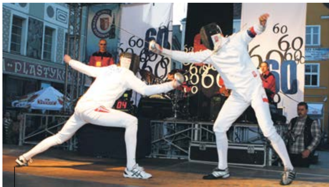
Tak diamentowy jubileusz gliwickiej szermierki świętowano w 2008 roku