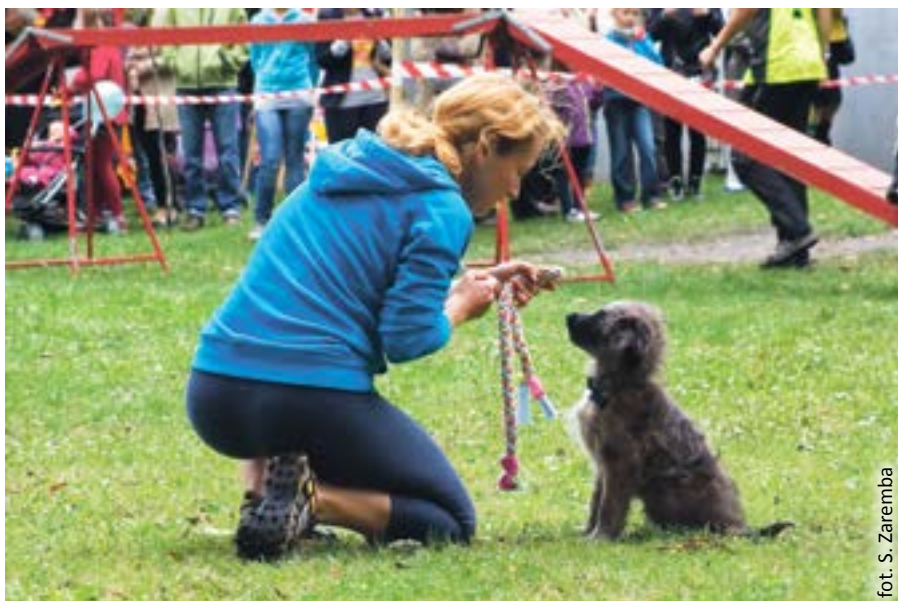
fol. S. Zaremba

W minioną niedzielę w Parku Chopina królowały czworonogi! Skały, biegały, pokonywały przeszkody, a nawet prezentowały się na scenie... Okazją do tego była piąta już edycja imprezy „Wariacje na cztery łapy, czyli baw się razem z psami”, którą zorganizował Miejski Zarząd Usług Komunalnych w Gliwicach.