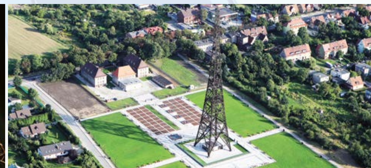
W sierpniu Radiostacja Gliwicka zyskała nowe oświetlenie, a teren wokół został gruntownie przebudowany