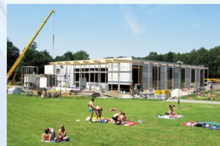
Okoliczni pływacy już zacierają ręce... Budowa krytej pływalni „Olimpijczyk” idzie pełną parą, coraz bliżej do ukończenia!