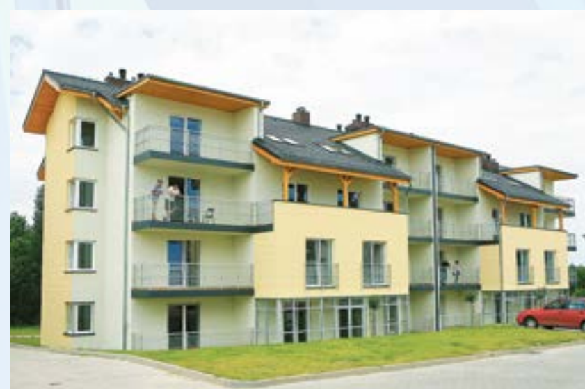
ZBM i TBS oddał do użytku bloki przy ul. Andersena. Kolejni gliwiczanie wprowadzą się do nowych „czterech kątów”