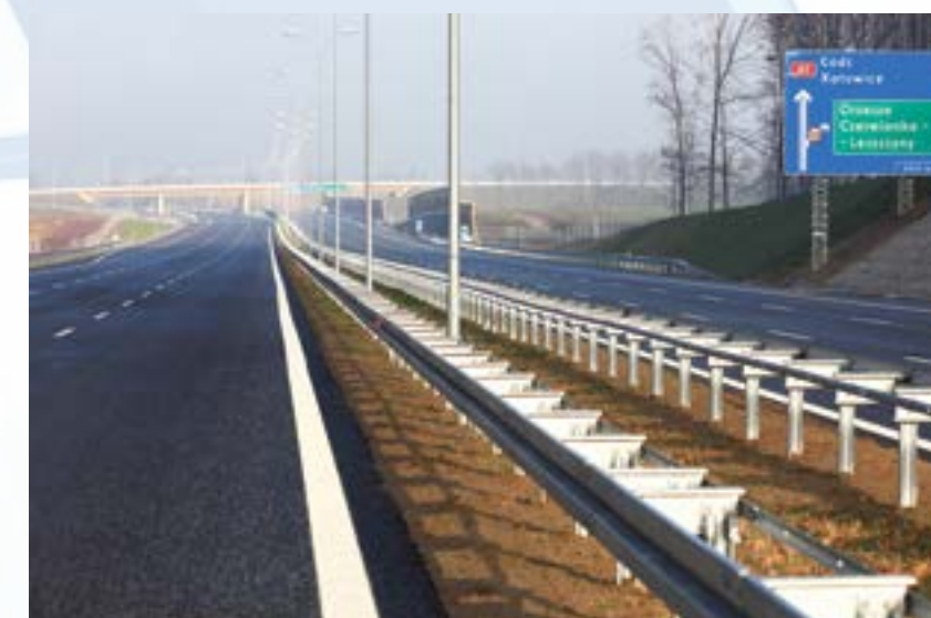
Przed Bożym Narodzeniem oddano do użytku 15-kilometrowy odcinek autostrady A1 oraz częściowo węzeł Gliwice Sośnica