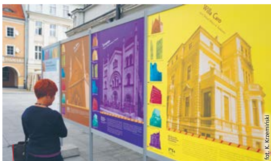
fol. K. Krzemiński

O miejscach związanych z żydowskim dziedzictwem w Gliwicach można przeczytać m.in. na Rynku