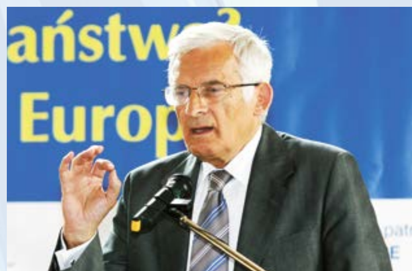
Gliwice mają powód do dumy. 14 lipca prof. Jerzy Buzek został nowym przewodniczącym Parlamentu Europejskiego