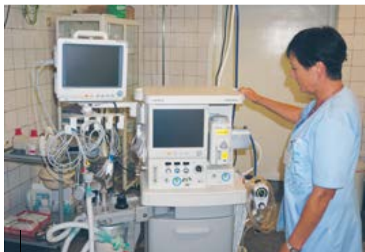
Sytuacja polskich szpitali jest trudna. Przyda się każde nowe urządzenie medyczne