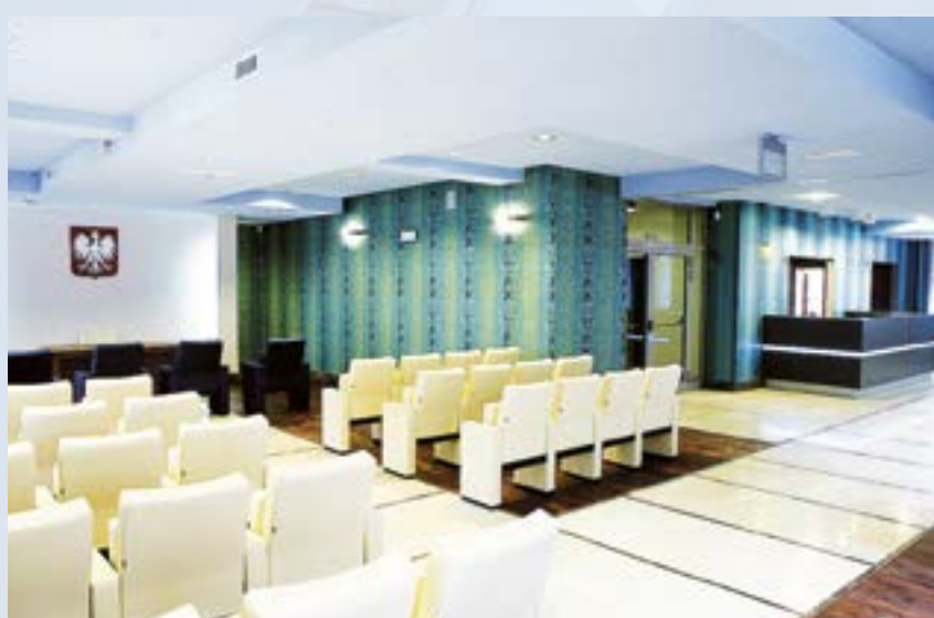
Zakończył się trwający rok gruntowny remont Ratusza. Odnowiono między innymi salę ślubów. Teraz aż chce się ślubować!