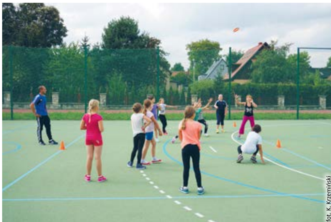
fol. K. Krzemiński