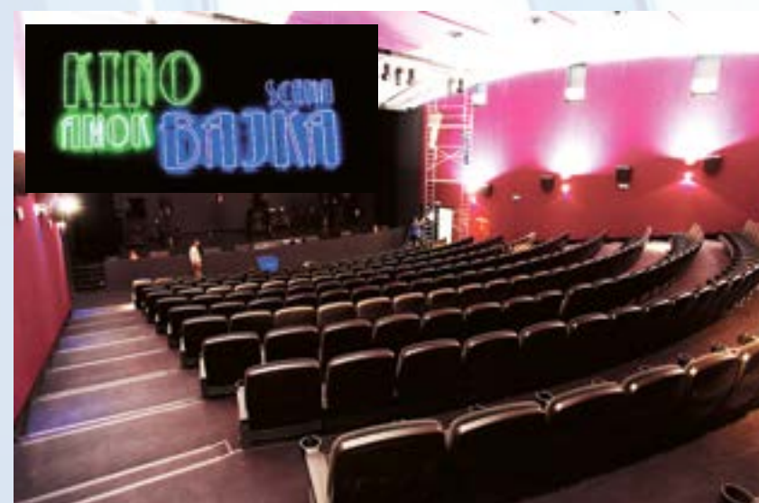
Wszyscy lubiący klimat kin studyjnych mają powód do radości. Otwarto nową placówkę kulturalną „Scena Bajka – Kino Amok”