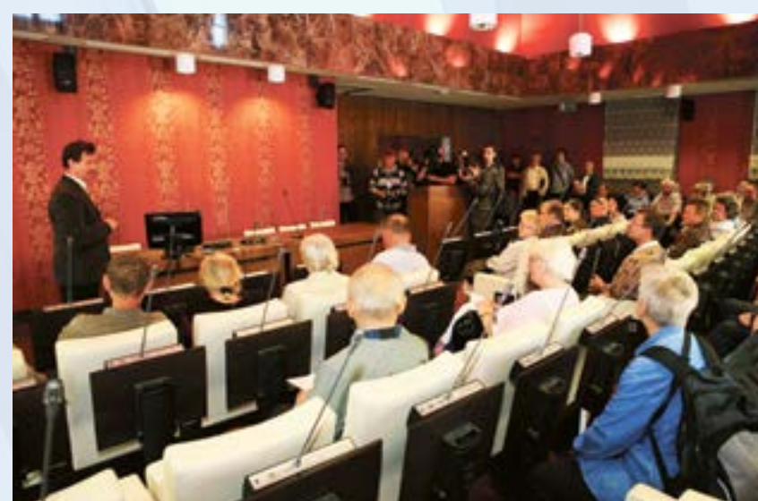
4 czerwca odbyła się pierwsza sesja Rady Miejskiej w Gliwicach w wyremontowanym Ratuszu – transmitowana online