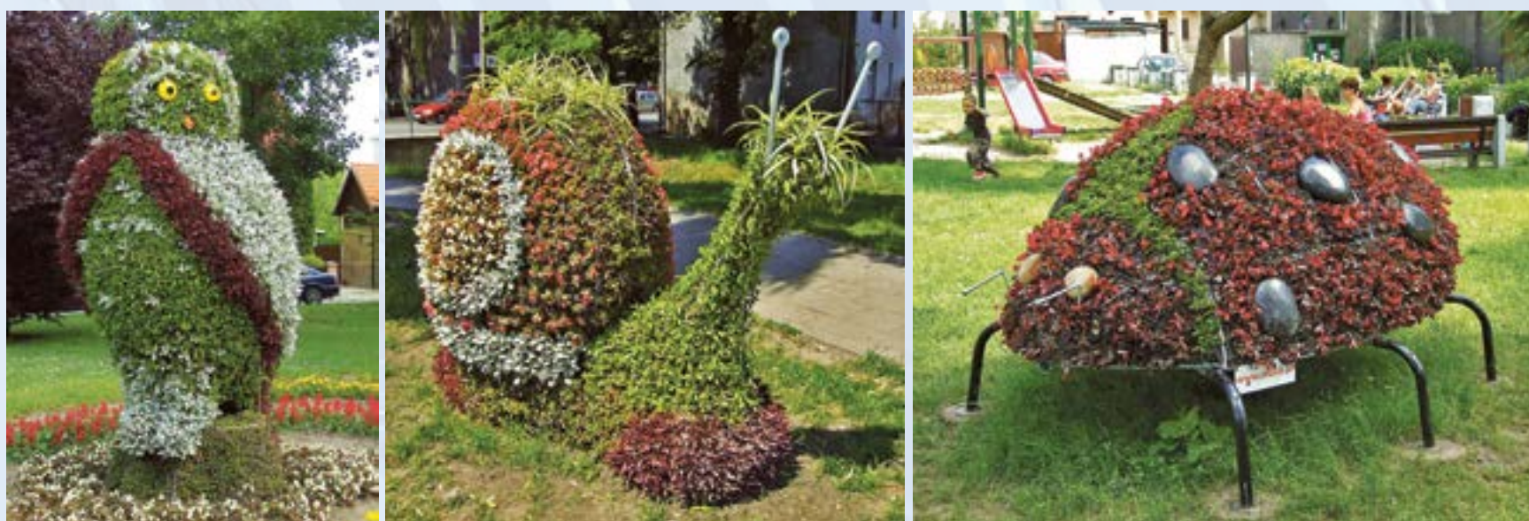
Jak żywe, ale spokojnie – to tylko rzeźby! Sowa, ślimak i biedronka, a także... inne ozdoby kwiatowe, kwitnąc latem, upiększają miasto