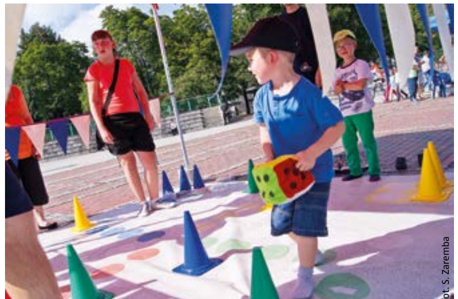
fol. S. Zaremba