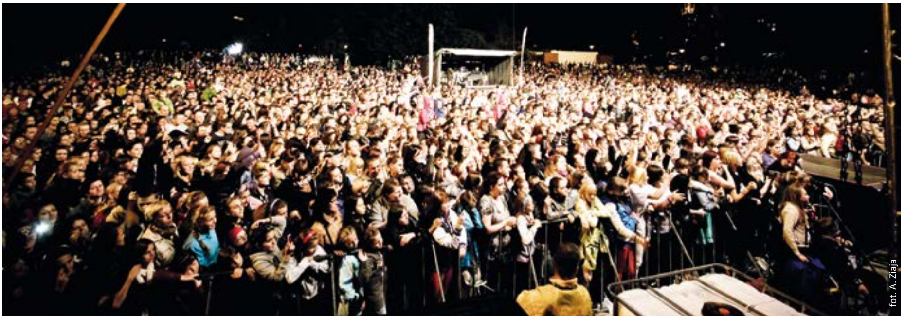
fol. A. Ziaja