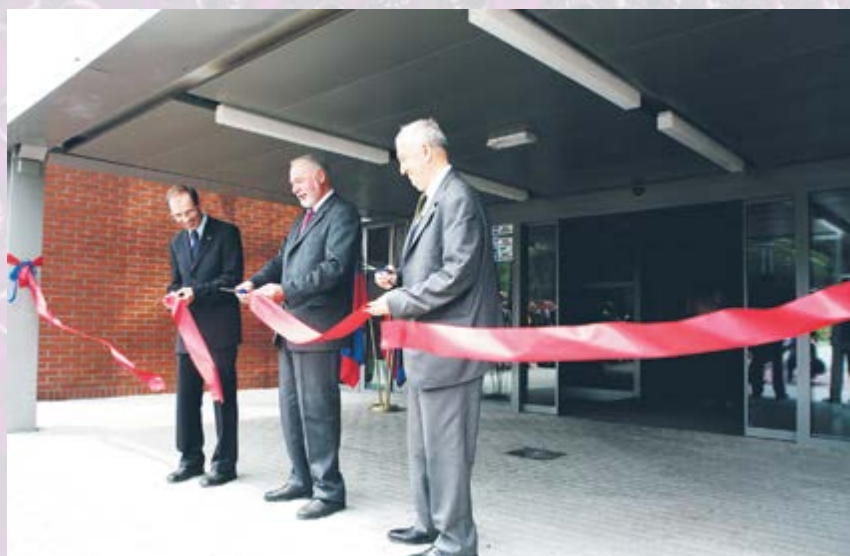
Zdecydowanym, potrójnym cięciem uroczyście otwarto nową siedzibę Parku Naukowo-Technologicznego TECHNOPARK GLIWICE