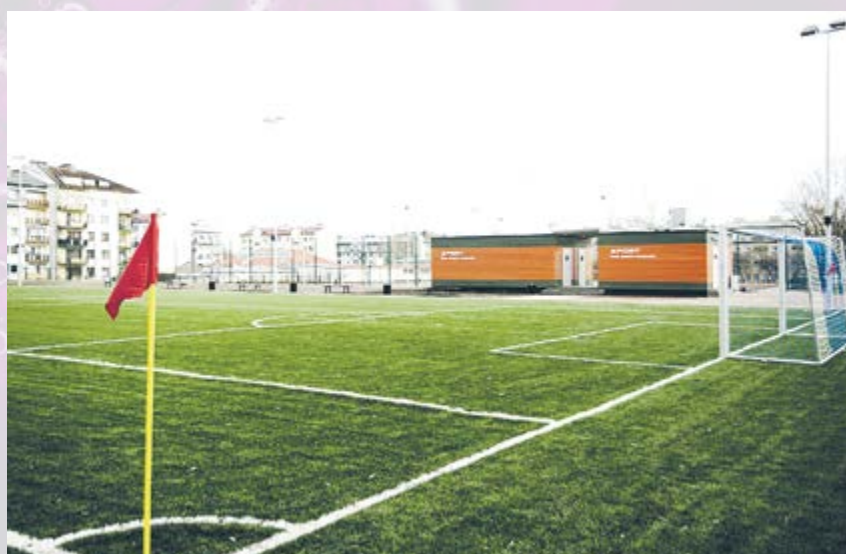
Piłkarska kadra czeka! Nowootwarte boisko na ul. Jasnej w ramach ogólnopolskiego programu inwestycyjnego „ORLIK 2012”