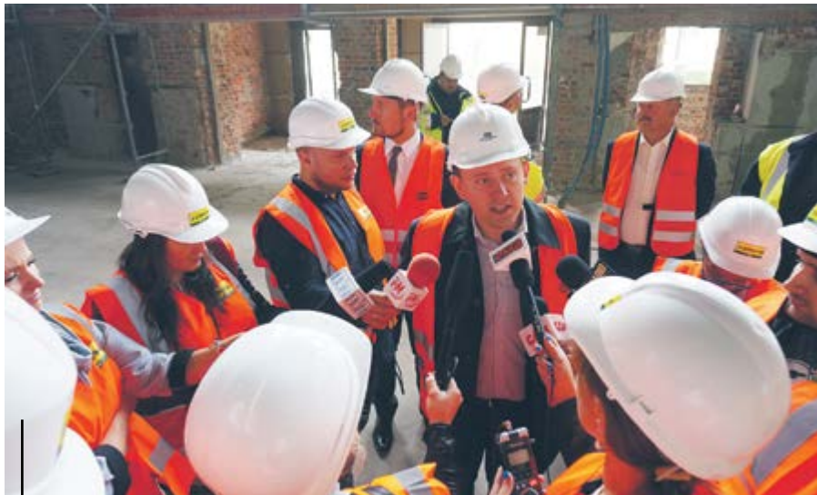
Na początku września zorganizowano spacer dla dziennikarzy. Przedstawiciele mediów mogli zajrzeć niemal w każdy kąt modernizowanego obiektu i udokumentować to, co już zostało zrobione

Budynek dworca PKP to zabytek, dlatego prace modernizacyjne muszą być prowadzone z pietyzmem i uwzględnieniem rangi obiektu. Z tego też powodu nie zostanie zmieniony układ budynku, a ozdobna mozaika w głównej hali dworca oraz strop będą odtworzone i zachowają swój niezwykły charakter. W budynku dworca pojawi się nowoczesna informacja pasażerska, kilkanaście ławek dla podróżnych, 8 kas biletowych. Obiekt będzie przystosowany do potrzeb osób niepełnosprawnych. Pojawią się ścieżki prowadzące i specjalne oznaczenia dla osób