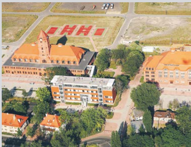
Tu aż chce się działać! Otwarto Centrum Edukacji i Biznesu „Nowe Gliwice” przy ul. Bojkowskiej, powstałe na terenach dawnej KWK Gliwice