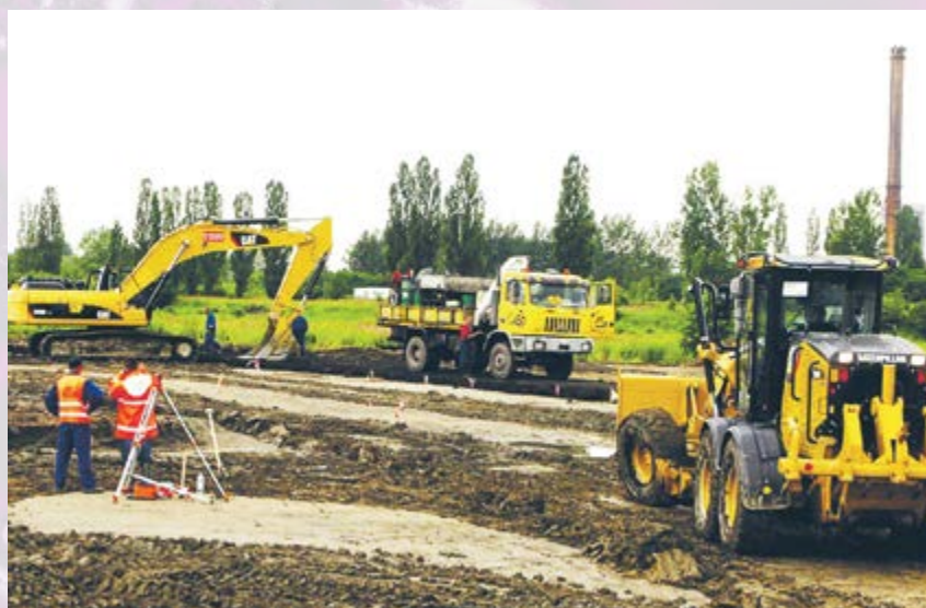
W lipcu rozpoczęto budowę węzła autostradowego „Gliwice-Sośnica”. W przyszłości połączy on autostrady A1 i A4 z ul. Pszczyńską