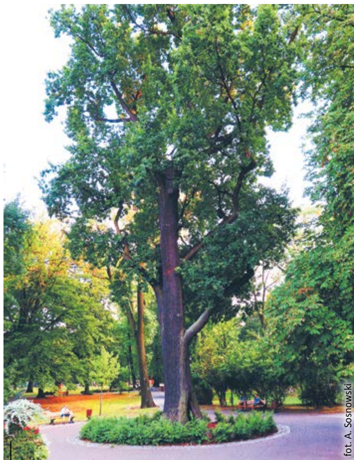
Wysokość dębu wynosi prawie 29 metrów. Obwód pnia – 480 centymetrów. Szacowany wiek – ok. 250 lat

autorem licznych publikacji poświęconych drzewom oraz wieloletnim doradcą Ministra Kultury w dziedzinie parków. Ekspert uczestniczy m.in. w konsultacjach pielęgnacyjnych dotyczących drzew w warszawskich łązienkach.