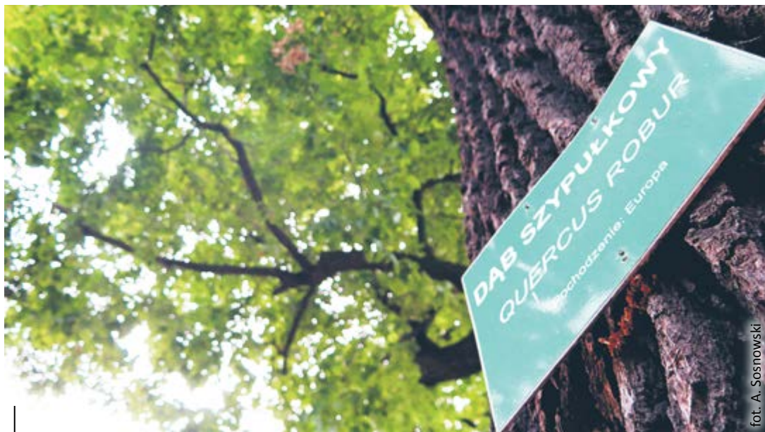
Dąb szypułkowy od lat zmagają się z groźnym pasożytem. Jego całkowite wyleczenie jest niemożliwe, ale zabiegi pielęgnacyjne mogą przedłużyć drzewu życie