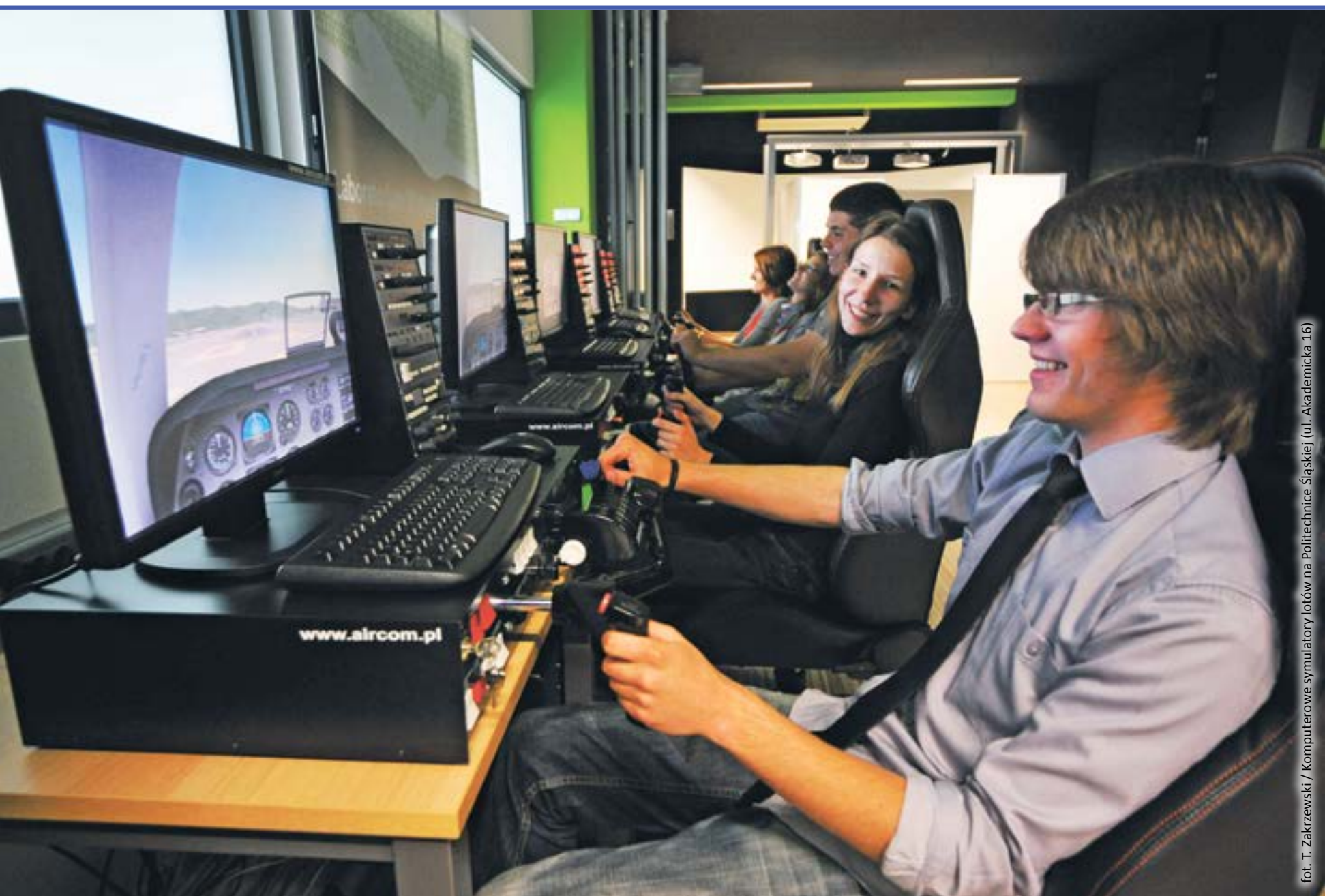
Komputerowe symulatory lotów na Politechnice Śląskiej (ul. Akademicka 16)