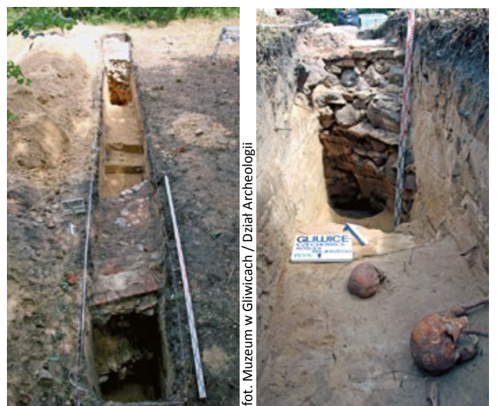
fol. Muzeum w Gliwicach / Dział Archeologii