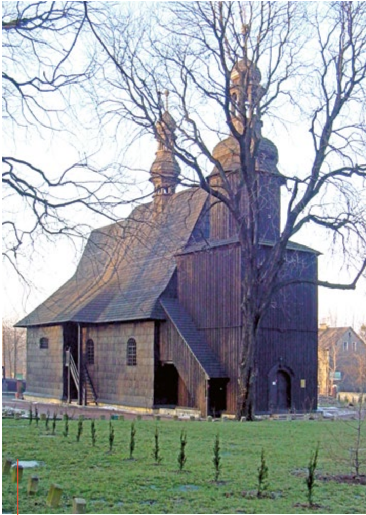
Drewniany strop kościoła przy ul. Kozielskiej i ściany zdobi dobrze zachowana polichromia. Zabytkowe malowidło przedstawia koronację Matki Boskiej przez Jezusa w otoczeniu aniołów i z błogostawieństwem Boga. Świątynię zdobi też figura Chrystusa „Ecce Homo” z 1505 r.