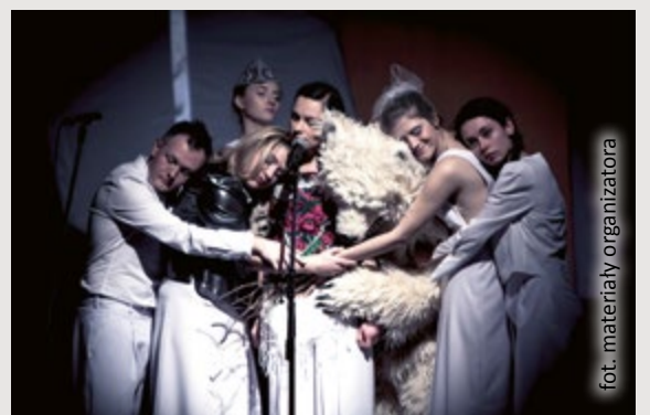
fol. materiały organizatora