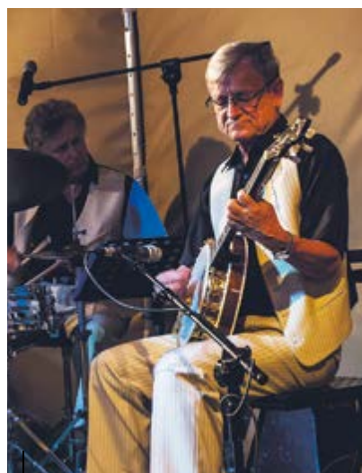
...a na Rynku zaprezentowała się Leliwa Jazz Band