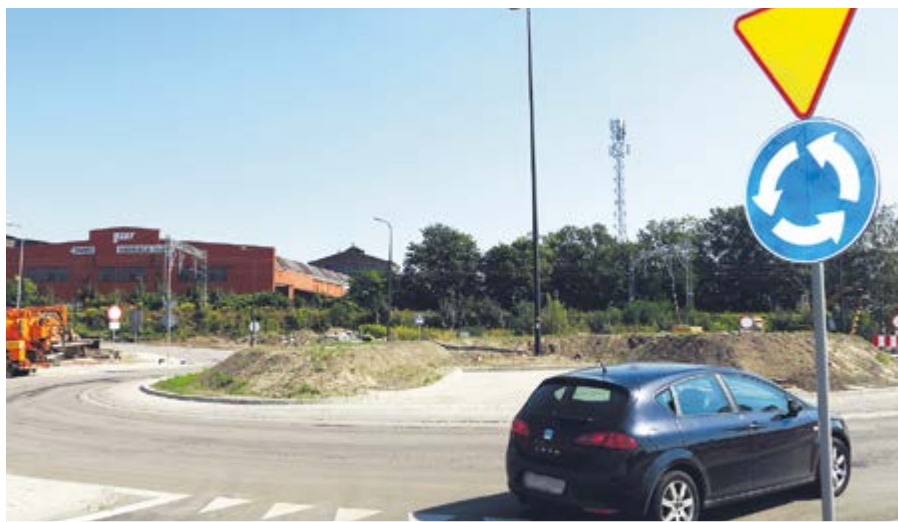
Poprzez nowe rondo można dojechać do ul. Jana Śliwki. Docelowo zostanie połączone z DTŚ i ul. Bohaterów Getta Warszawskiego

bois. Znowu przejezdny jest fragment ul. Dubois przy torach kolejowych, który łączy ul. Jana Śliwki i Sienkiewicza. Ruch odbywa się – tak jak wcześniej – dwukierunkowo.