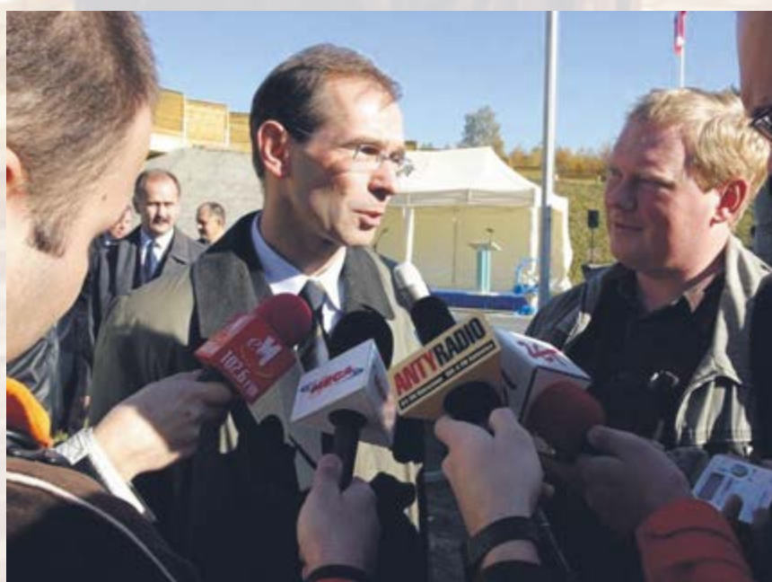
28 października uroczystie oddano do użytku gliwicki odcinek autostrady A4 z trzema węzłami autostradowymi: „Ostropa”, „Bojków”, „Sośnica”