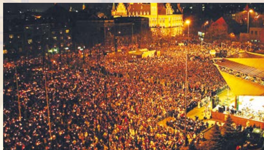
We Mszy Świętej żałobnej w intencji Ojca Świętego odprawionej 7 kwietnia na Pl. Krakowskim uczestniczyło około 50 tys. osób. Nabożeństwu przewodniczył biskup gliwicki Jan Wierzbicki