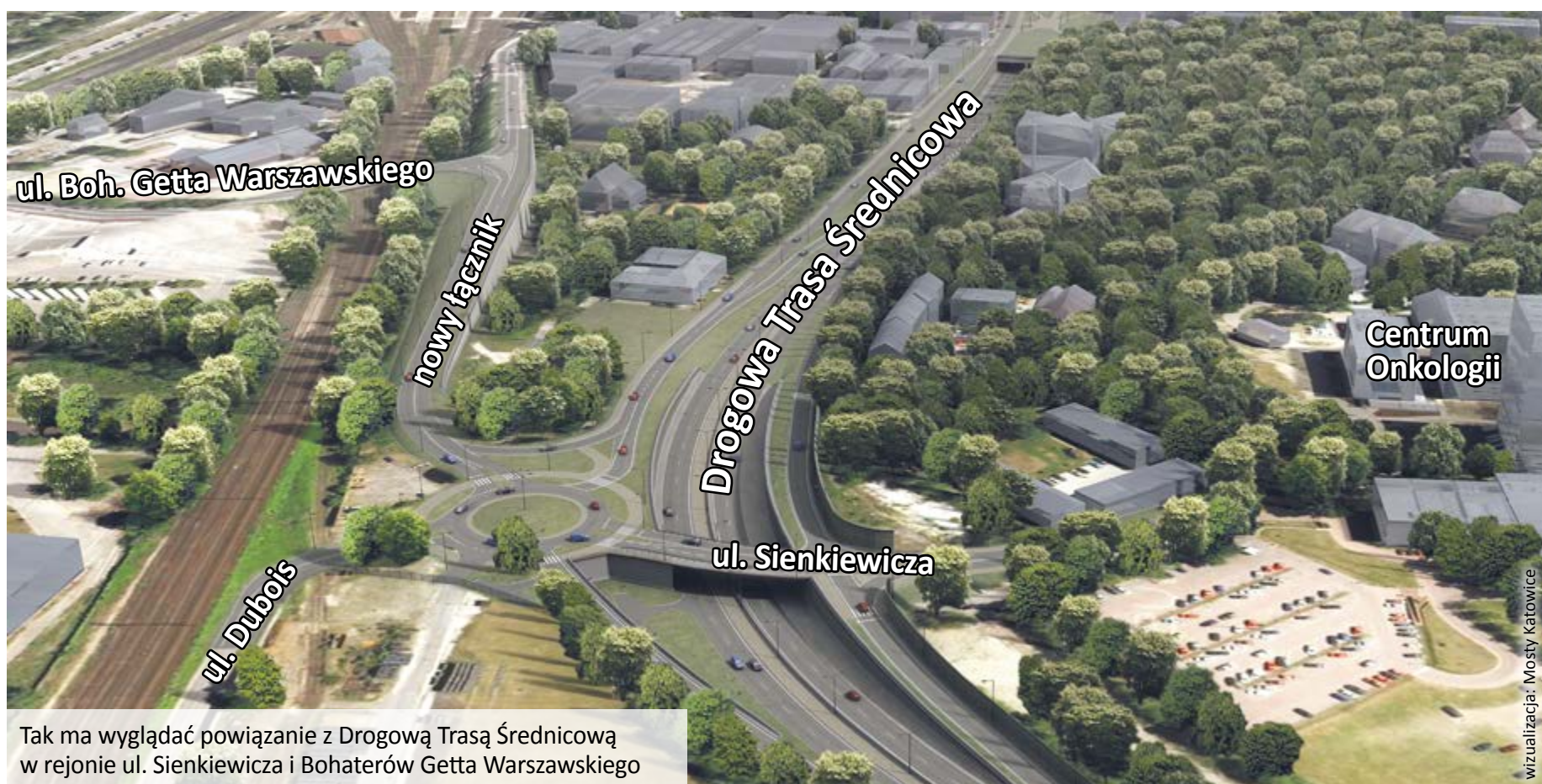
Tak ma wyglądać powiązanie z Drogową Trasą Średnicową w rejonie ul. Sienkiewicza i Bohaterów Getta Warszawskiego

– Prowadzenie prac na ul. Bohaterów Getta Warszawskiego będzie się wiązało z okresowymi utrudnieniami. Ruch samochodów będzie odbywał się wahadłowo, z wykorzystaniem tymczasowej sygnalizacji świetlnej. Zmiany mogą zostać wprowadzone w najbliższym czasie i będą obowiązywać przez mniej więcej dwa miesiące. Prosimy kierowców o zachowanie w tym miejscu ostrożności – mówi Danuta Żak, rzecznik prasowy DTŚ S.A. (al)