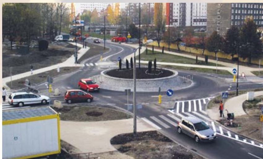
Przekazano do użytku nowe rondo na skrzyżowaniu ulic Jasnej, Kochanowskiego i Gwarków