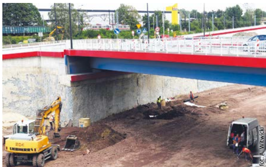
Na ul. Sienkiewicza przejeżdżamy przez nowy wiadukt nad budowaną Drogową Trasą Średnicową

Zakończyła się przebudowa fragmentu ul. Sienkiewicza, na której powstaje kolejne powiązanie Drogowej Trasy Średnicowej z miejskim układem komunikacyjnym. W ciągu ul. Sienkiewicza wzniesiono wiadukt nad DTŚ o rozpiętości przęsła ponad 36 metrów z jezdnią o szerokości 11 metrów i jednostronnym chodnikiem dla pieszych o szerokości 2,5 metra. Zbudowano także nowe rondo u zbiegu ulic Sienkiewicza i Du-