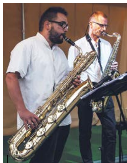
Miniony weekend zwieńczył koncert gliwickich „Saksoholików”