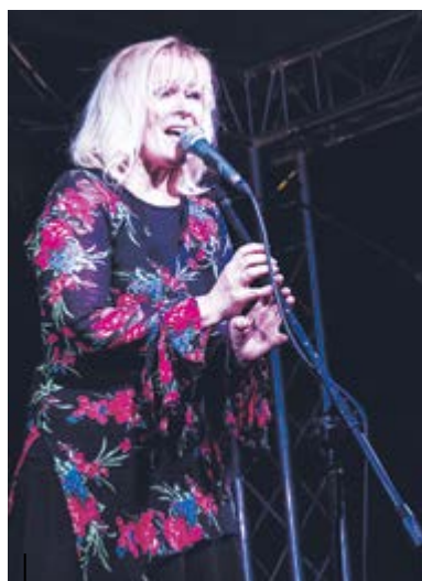
Dzień wcześniej w Parku Chopina wystąpiła Grupa Zayazd...