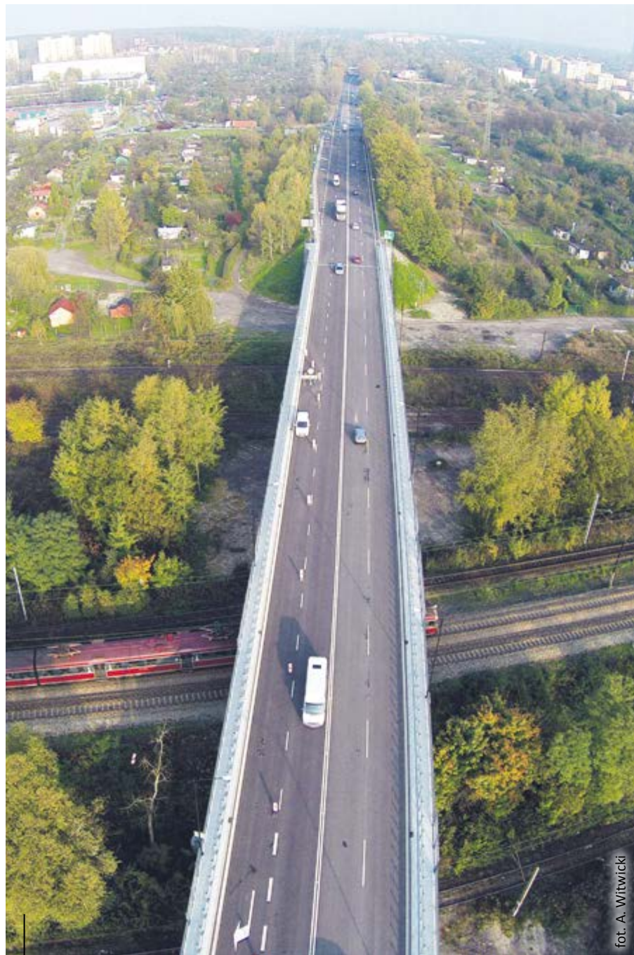
Związki metropolitalne miałyby zarządzać m.in. drogami krajowymi i wojewódzkimi. Na zdjęciu Droga Krajowa nr 88 w Gliwicach

Dokument został krytycznie oceniony m.in. przez Związek Miast Polskich oraz Śląski Związek Gmin i Powiatów. – Wbrew pozorom przedstawiony projekt ustawy wprowadza dodatkowy, czwarty rodzaj jednostki samorządu terytorialnego (obok gmin, powiatów i województw – przyp. red.) wraz z całą infrastrukturą organizacyjną. Jego utworzenie będzie istotnym obciążeniem dla podatników, przy czym nie rozwiąże istniejących problemów w zarządzaniu dużymi obszarami miejskimi, powodując jedynie nowe spory o charakterze kompetencyjnym – tłumaczy w swoim stanowisku Zarząd ŚZGiP. Jak podkreślają samorządowcy, brakuje