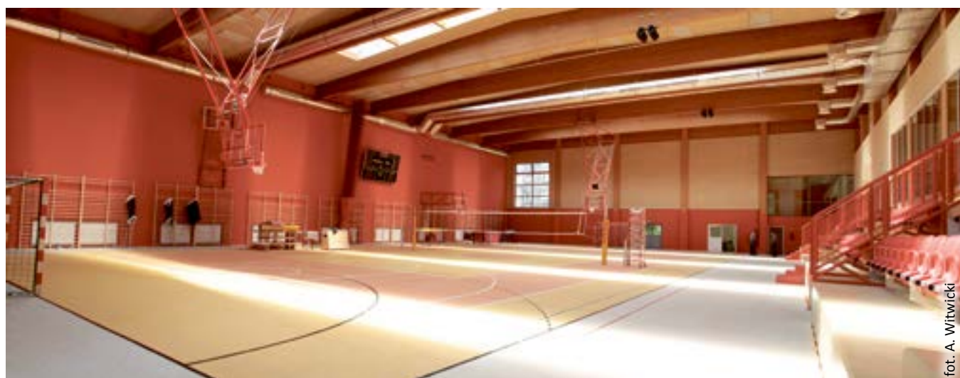
fol. A. Witwicki