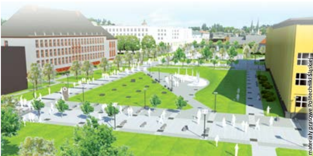
materiały prasowe Politechniki Śląskiej

wy asfalt zastąpi kostka granitowa, zarówno na chodnikach, jak i jezdni. Powstanie tam ścieżka rowerowa i parkingi. Wykonawcy zajmą się budową oświetlenia, kanalizacji deszczowej i sanitarnej. W dalszej kolejności powstanie reprezentacyjny plac z fontanną, pojawią się nowe elementy małej architektury i zieleni. Zwiększy się bezpieczeństwo w dzielnicy studenckiej – po modernizacji pojawią się tu kamery monitoringu. Inwestycja o wartości ponad 13,5 mln zł realizowana jest ze środków Politechniki Śląskiej oraz gliwickiego samorządu. (bom)