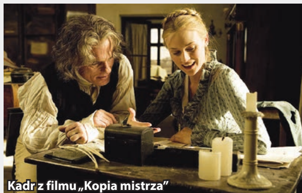
Kadr z filmu „Kopia mistrza”