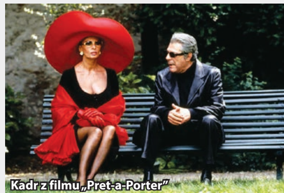
Kadr z filmu „Pret-a-Porter”