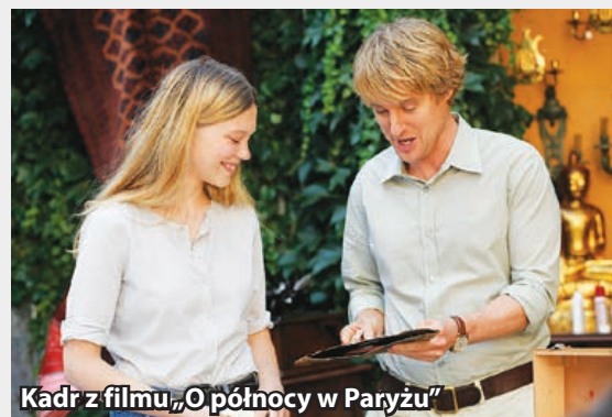
Kadr z filmu „O północy w Paryżu”