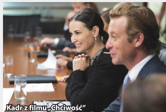
Kadr z filmu „Chciwość”