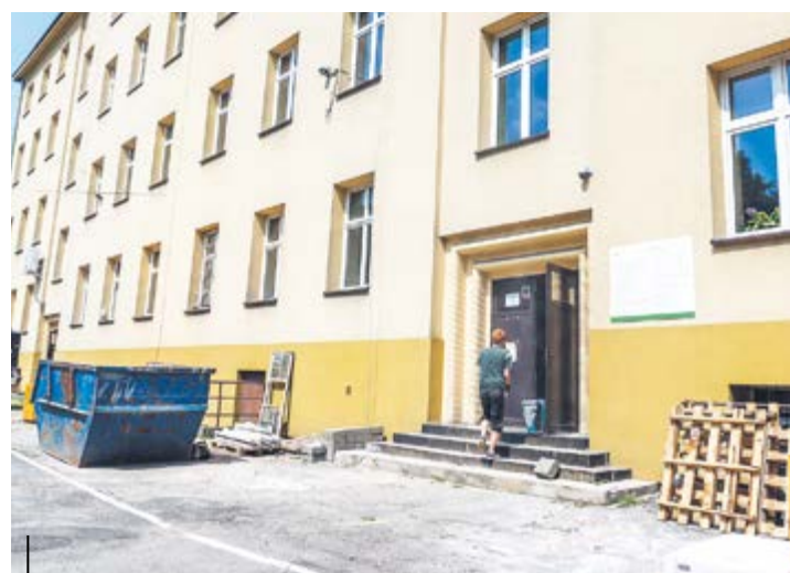
Wymiana instalacji, montaż windy, remont sal – to tylko niektóre z prac wykonywanych w MDK

Planowany remont filii w Bojkowie potrwa dłużej. Inwestycja została rozłożona na etapy i na finał będziemy musieli poczekać 3 lata. Pierwszy etap prac rozpocznie się pod koniec sierpnia i będzie kosztował około 500 tys. zł. Budynek musi przejść generalny remont.