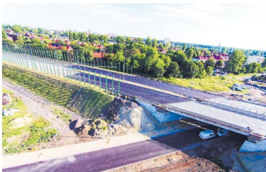
Kompleksowa przebudowa ul. Królewskiej Tamy była konieczna, bo trzeba dostosować ją do wjazdów i zjazdów ze „średnicówki”

W ubiegłym roku oddano do użytku wiadukt nad DTŚ na ul. Konarskiego, nowy most nad Kłodnicą w ciągu Drogi Krajowej nr 88 oraz drogowy by-pass