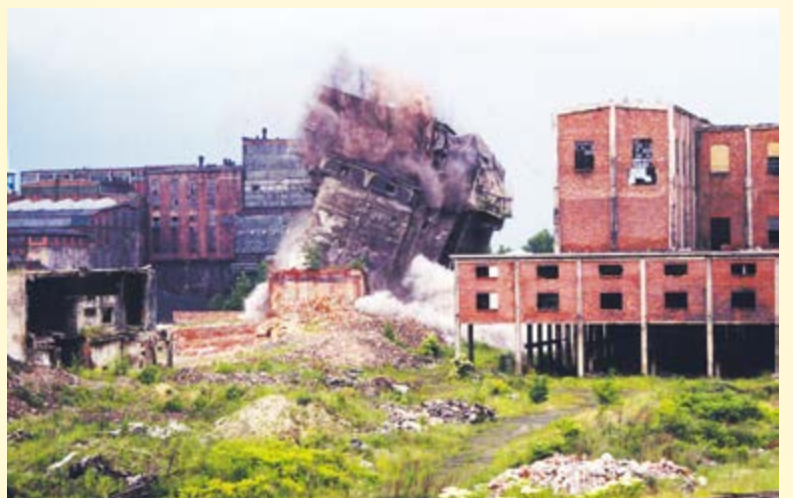
Wyburzenie budynków kopalni Gliwice, przygotowanie terenu pod budowę Centrum Edukacji i Biznesu „Nowe Gliwice”