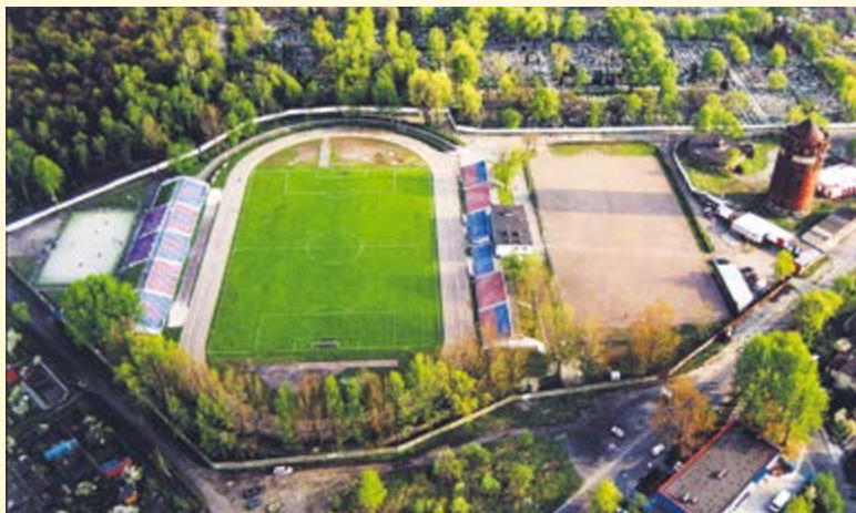
W czerwcu GKS „Piast” Gliwice awansował do II ligi. W miejscu starego stadionu już niebawem pojawi się nowoczesny obiekt sportowy na miarę XXI wieku