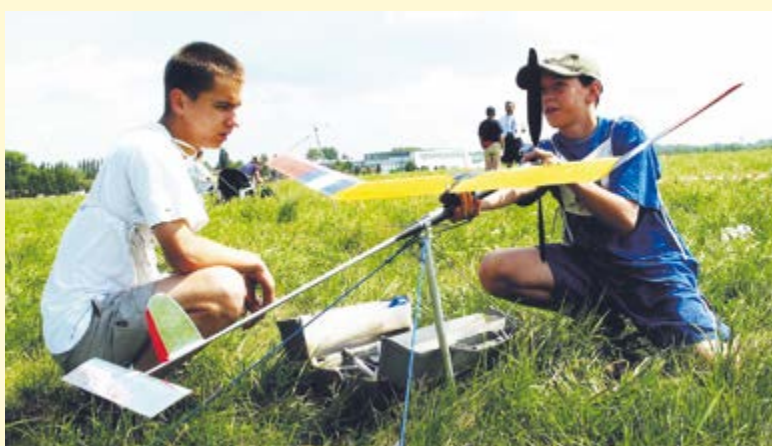
Mistrzostwa Polski Modeli Latających, lotnisko w Gliwicach