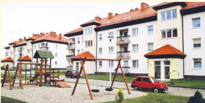
We wrześniu Gliwicom przybyło nowe osiedle położone w sąsiedztwie ul. Żabińskiego (os. Bajkowe). Klucze lokatorom nowych mieszkań wręczał prezydent Gliwic, Zygmunt Frankiewicz.

Pod koniec października oddano do użytku także kolejne domy ZBM II TBS (ul. Uszczyka i Dworska)