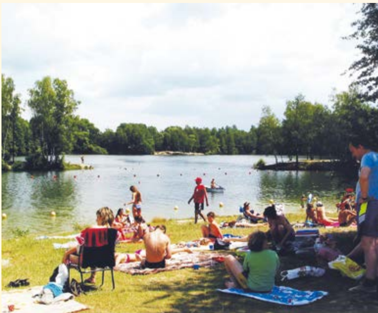
Wypoczynek na kąpielisku w Czechowicach – wakacje 2003 r.