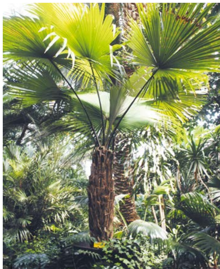
Palma KERRIDOKA w naturalnym środowisku występuje w tropikalnej Azji. Od niedawna można ją podziwiać w gliwickiej Palmiarni. Robi wrażenie!