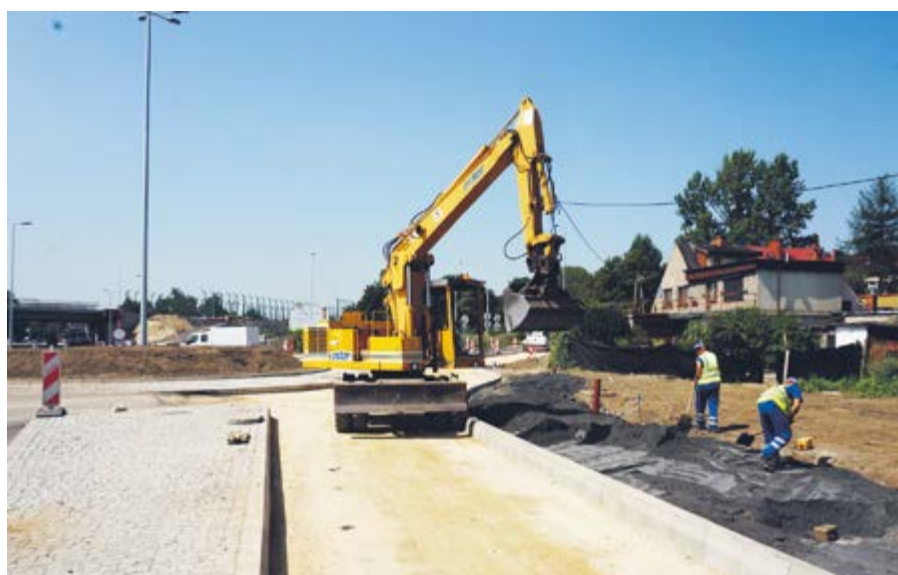
Końcowe prace przed otwarciem nowego ronda u zbiegu ul. Królewskiej Tamy i Błogostawionego Czesława

przy ul. Dworcowej (na gotowych stropach tunelu). Wiosną tego roku otwarto węzeł DK 88 z ul. Portową i budowaną „średnicówką” wraz z dwoma nowymi rondami oraz nowy wiadukt nad DTŚ i kładkę dla pieszych pomiędzy ul. Robotniczą i Franciszkańską.