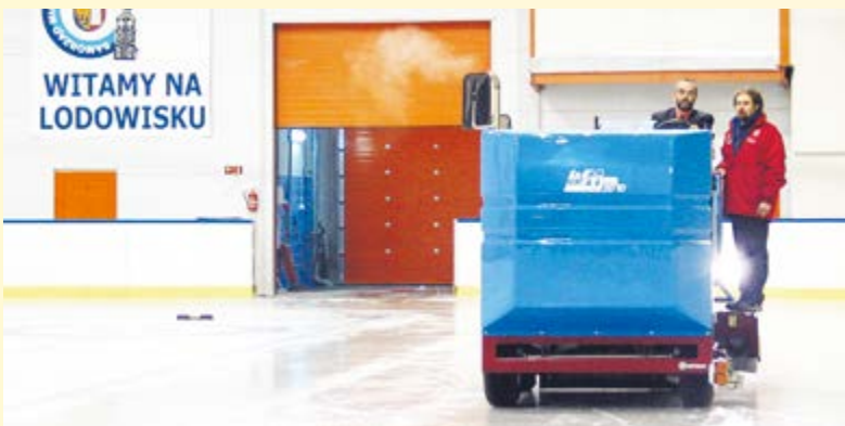
W grudniu dobiegły końca prace przy gruntownej modernizacji lodowiska TAFLA przy ul. Akademickiej. Nad zmodernizowaną płytą lodowiska wzniesiono nowoczesną halę. Przebudowano też szatnie i zaplecze socjalne obiektu