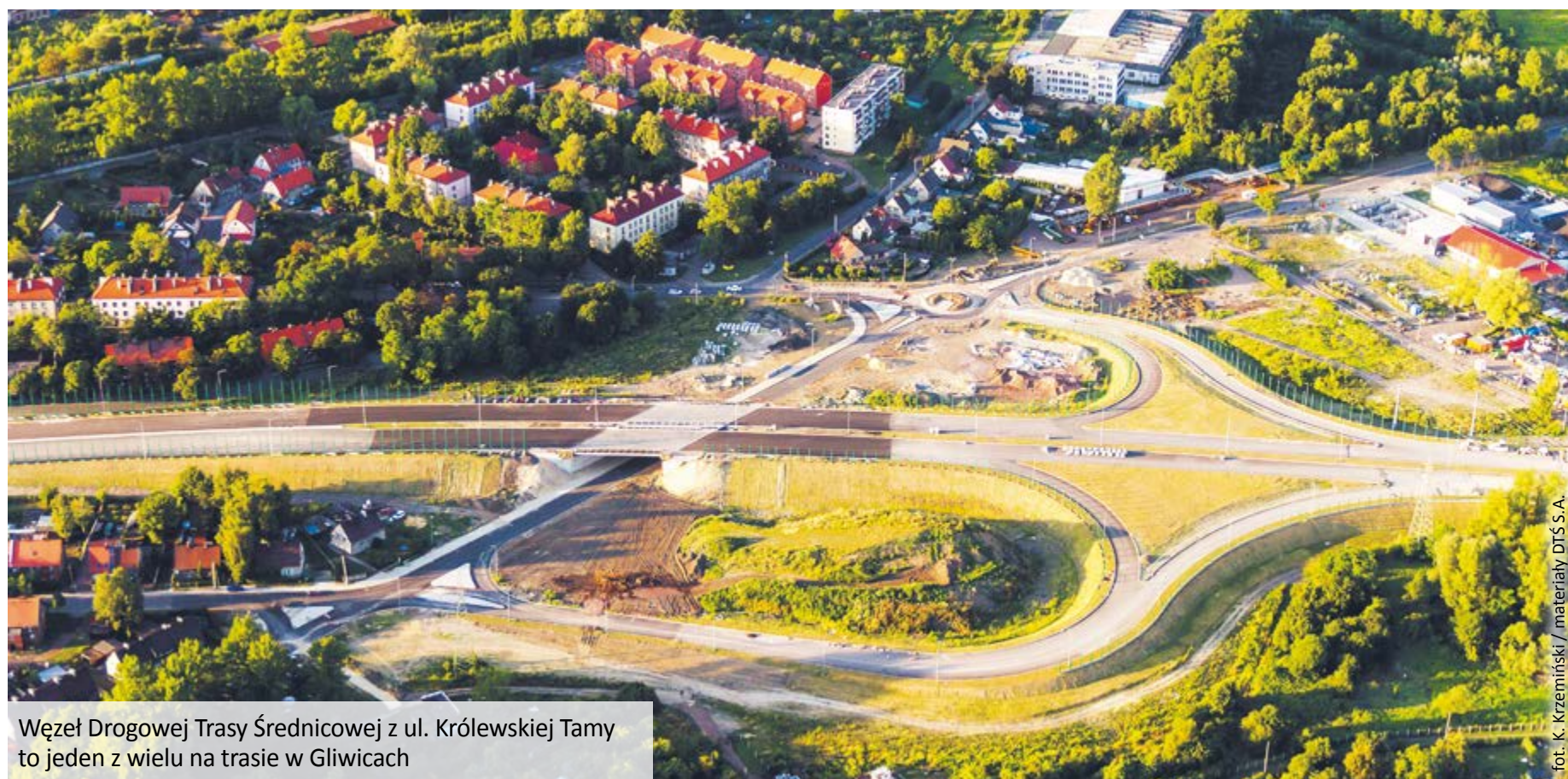
Węzeł Drogowej Trasy Średnicowej z ul. Królewskiej Tamy to jeden z wielu na trasie w Gliwicach