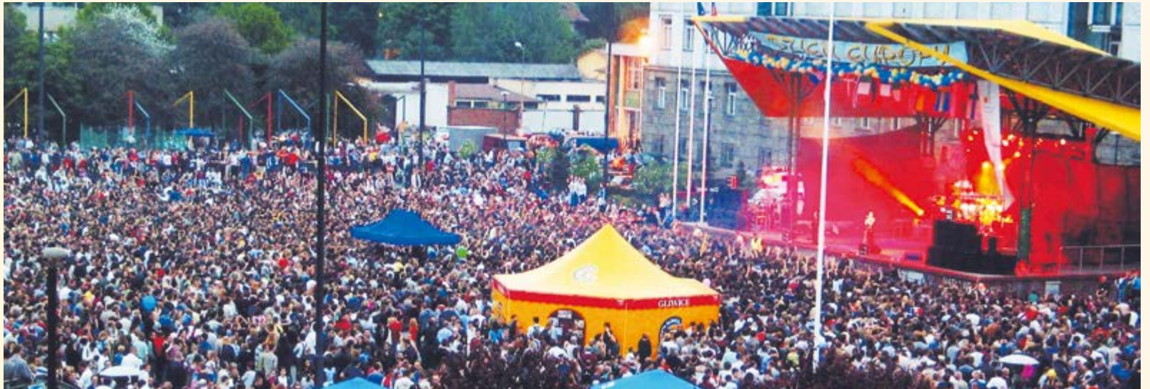
9 maja – Dzień Europy na Placu Krakowskim w Gliwicach