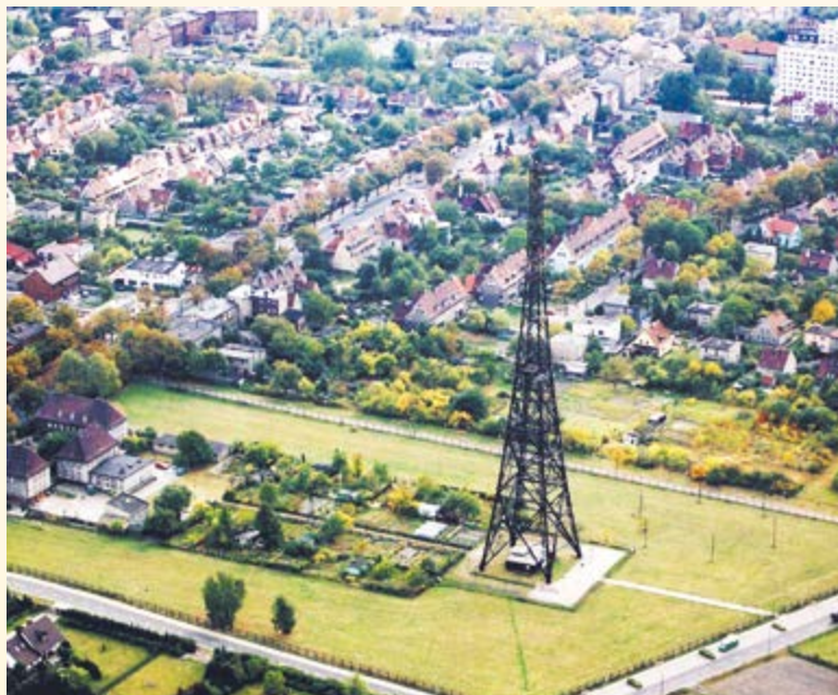
Radiostacja i okolice z lotu ptaka