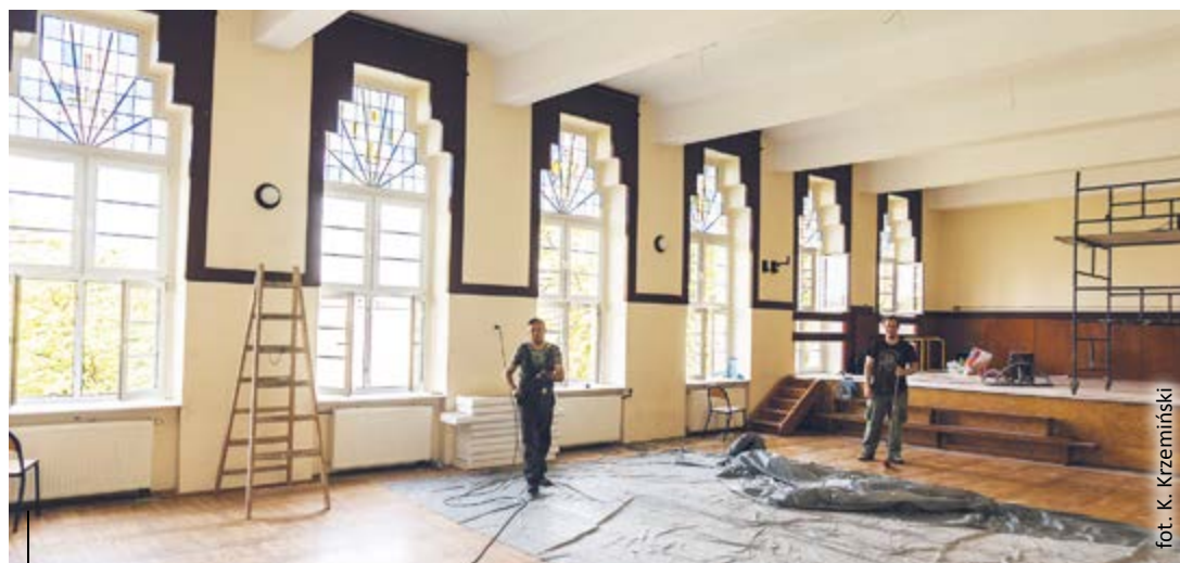
W budynku przy ul. Barlickiego praca wre. Inwestycja zakończy się na początku listopada